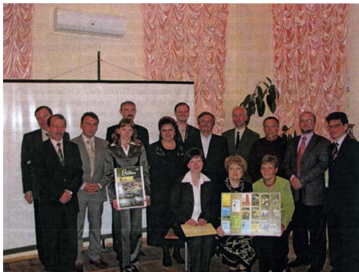
Презентація ювілейного XXV номера Всеукраїнського наукового історичного журналу «Сумська старовина». Члени редколегії, редакції, автори. 14 травня 2009р. р.