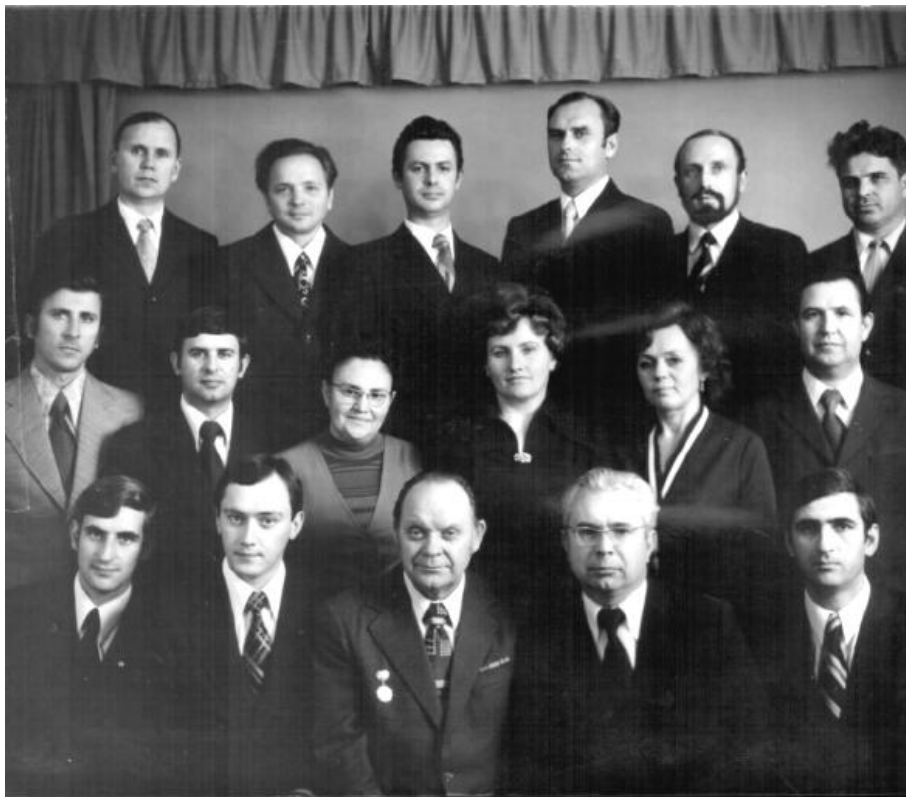
Кафедра технології машинобудування ЧФ КПІ. 1975 рік

За рік – незвільнений секретар парторганізації філіалу, а з 1974 р. керував кафедрою технології машинобудування.