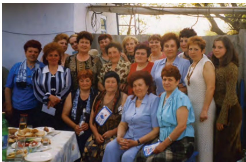
«Є в садах моє мале село»