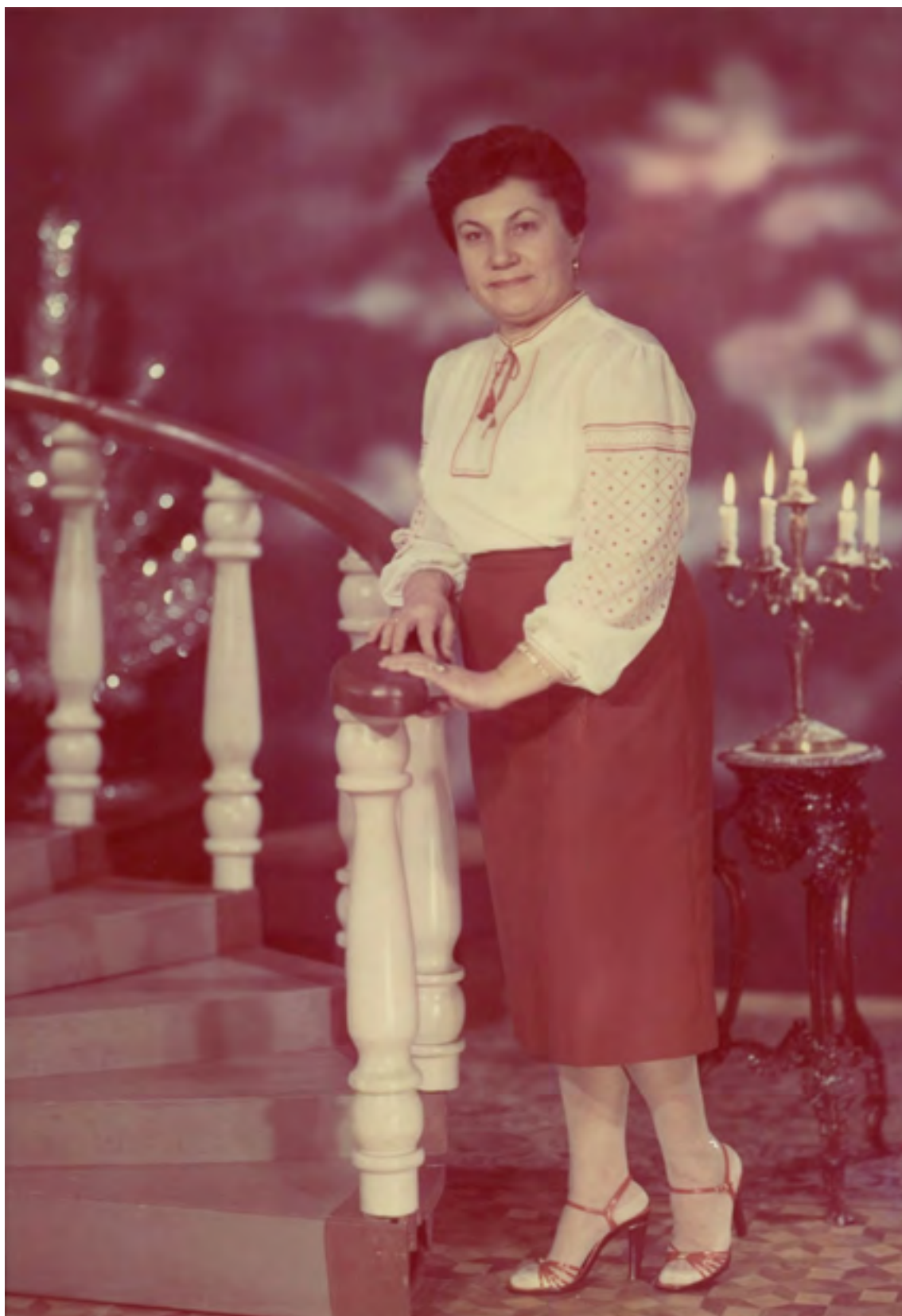
АКАДЕМІК ЄВДОКІЯ ПЕТРІВНА ГОЛОБОРОДЬКО

«Стояла я і слухала весну...» (Леся Українка)