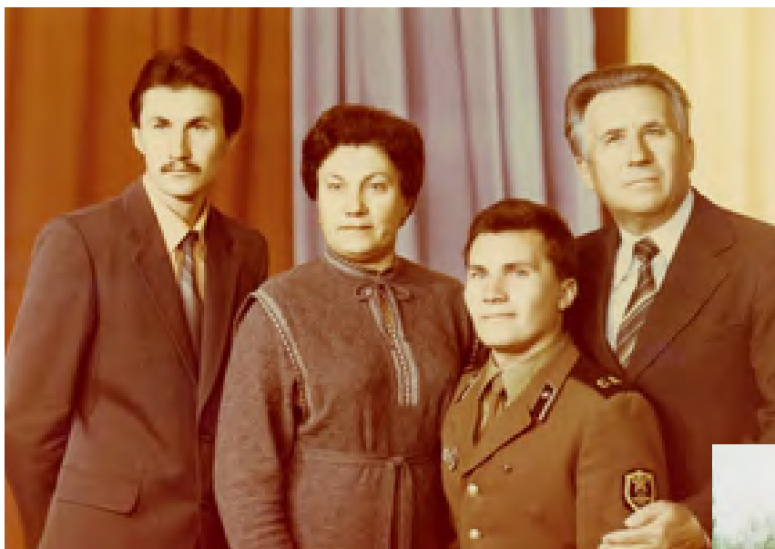
«На побывке с нами молодой солдат»