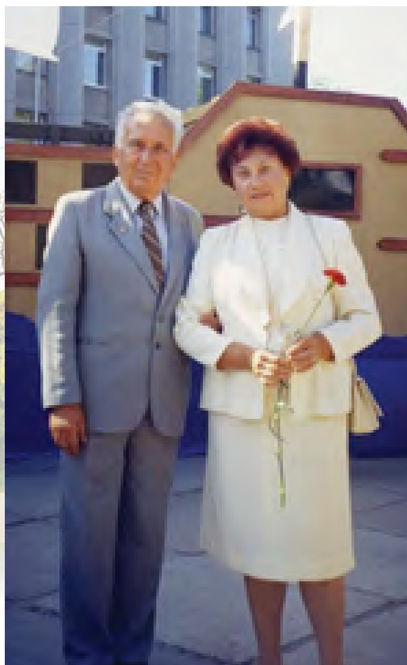
«Мы долгое эхо друг друга»