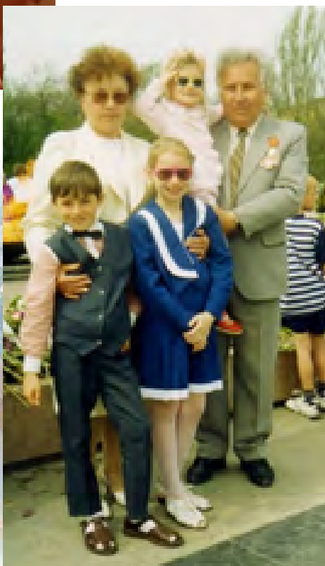
«З роду в рід кладе життя мости»