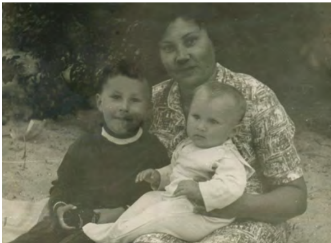
«Сину, сину, сину! Ангел мій.»