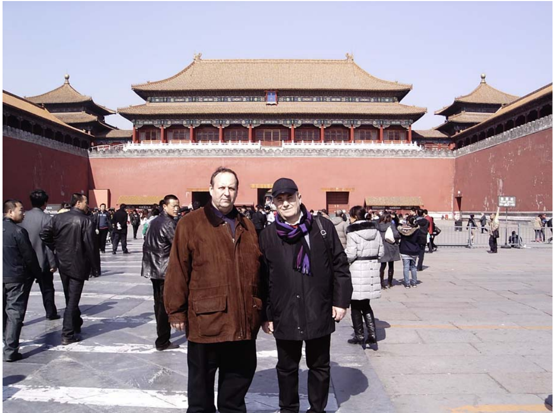
Офіційний візит до Китаю (2011 рік)