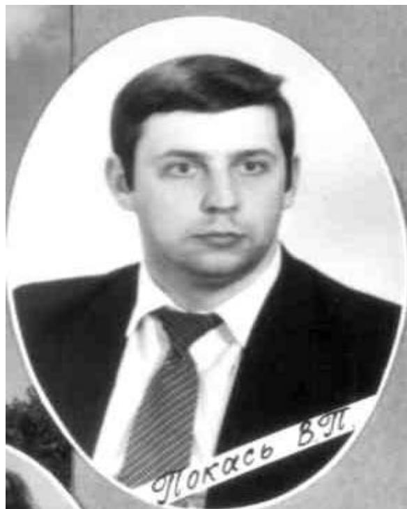
Студент-випускник природничо-географічного факультету, КДПУ ім. М. О. Горького 1984 року