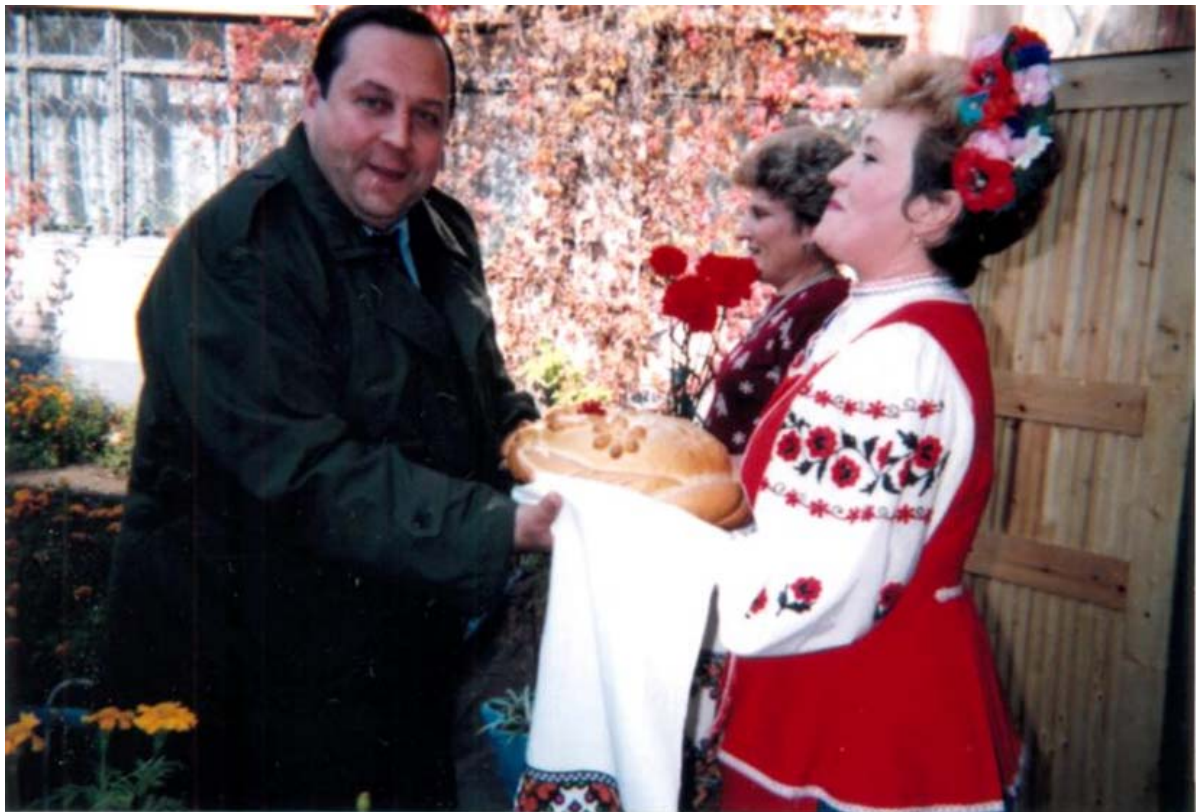
Місто Дніпропетровськ. Відкриття Всеукраїнської науково-практичної конференції (1997 рік)