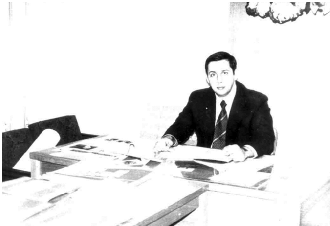
Директор студентського містечка. 1984 рік