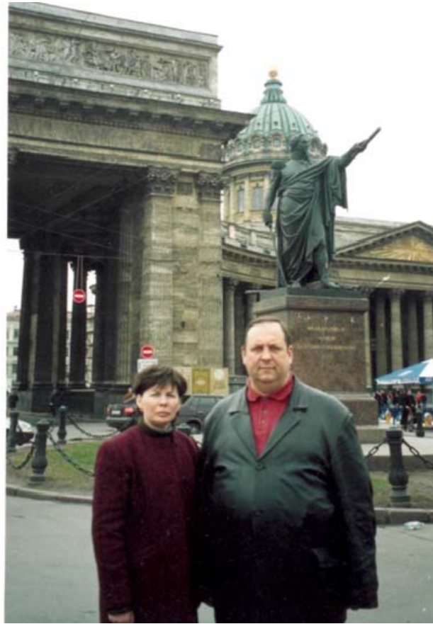
Місто Санкт-Петербург. Біля пам'ятника Кутузову (травень 2005 рік)