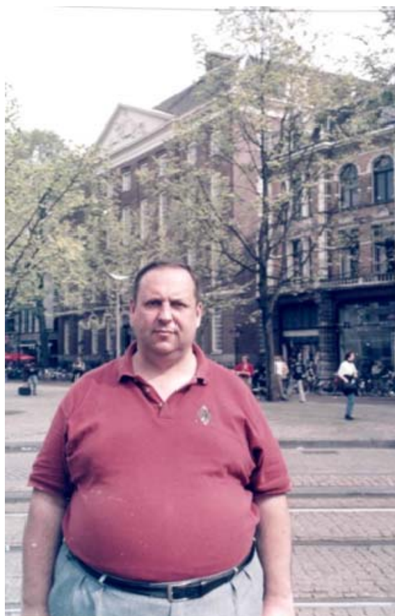
Нідерланди, місто Амстердам. Біля університету (2006 рік)