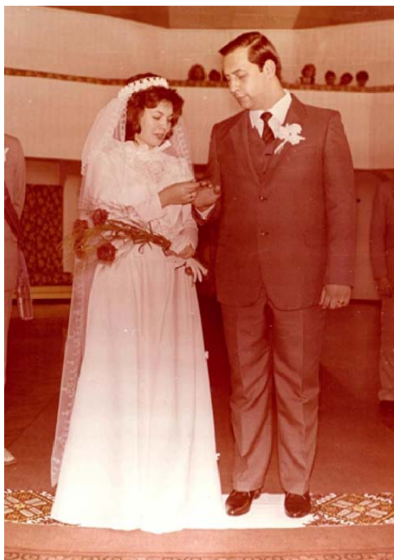
Одруження (21 вересня 1984 рік)