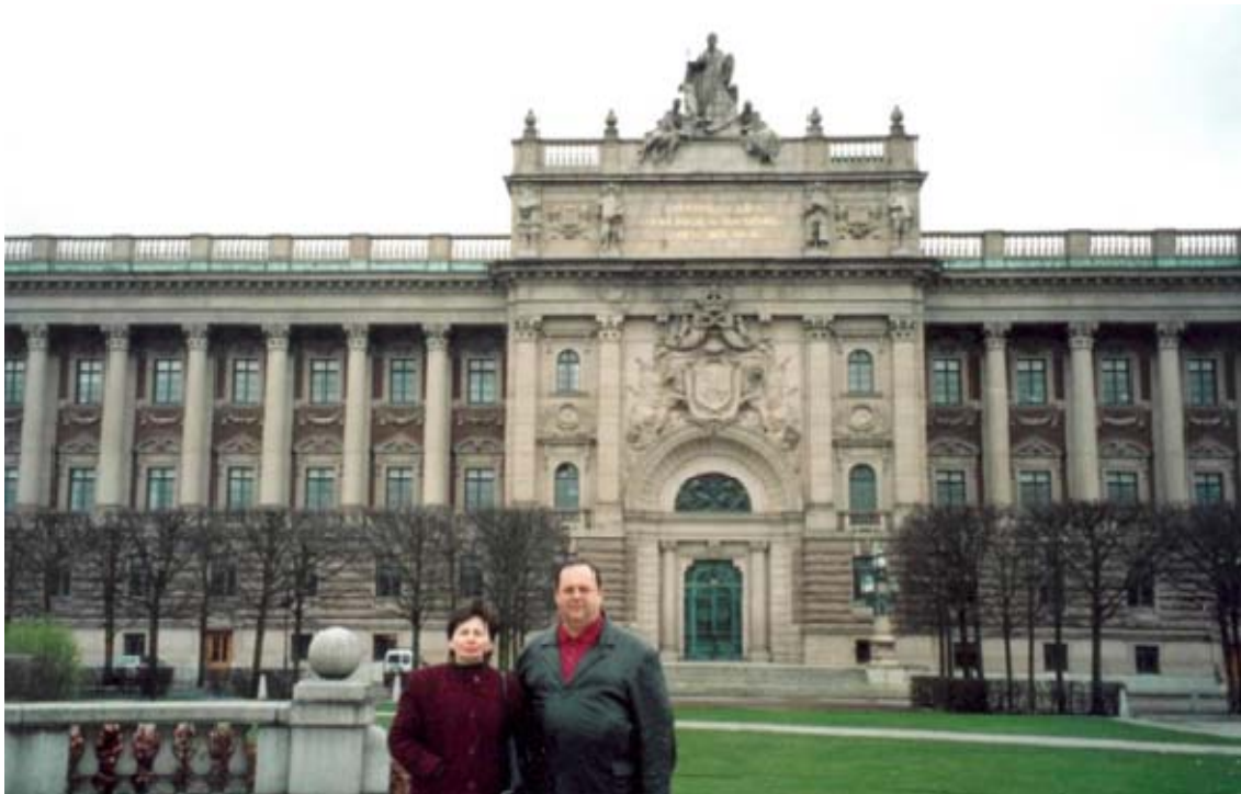
Швеція, місто Стокгольм. Парламент (травень, 2005 рік)