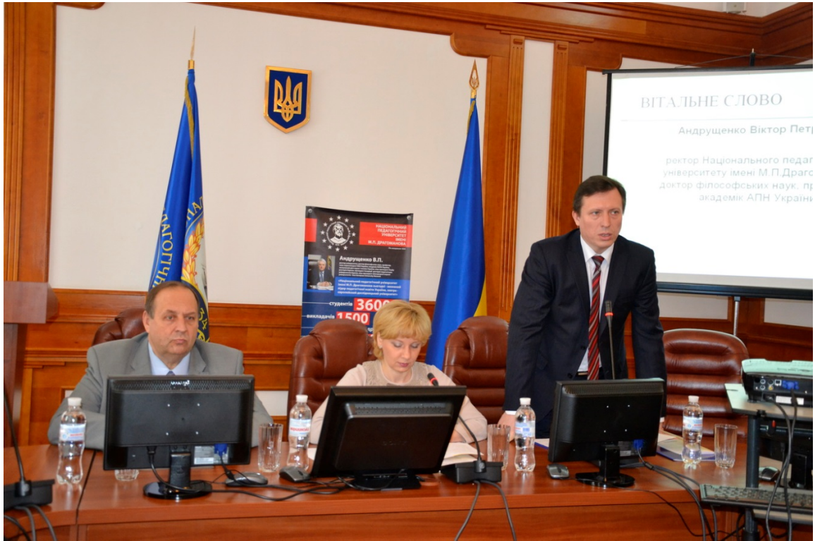
Нові концепції викладання іноземної мови в світлі сучасних вимог. Міжнародна науково-методична конференція (5 листопада 2014 рік)