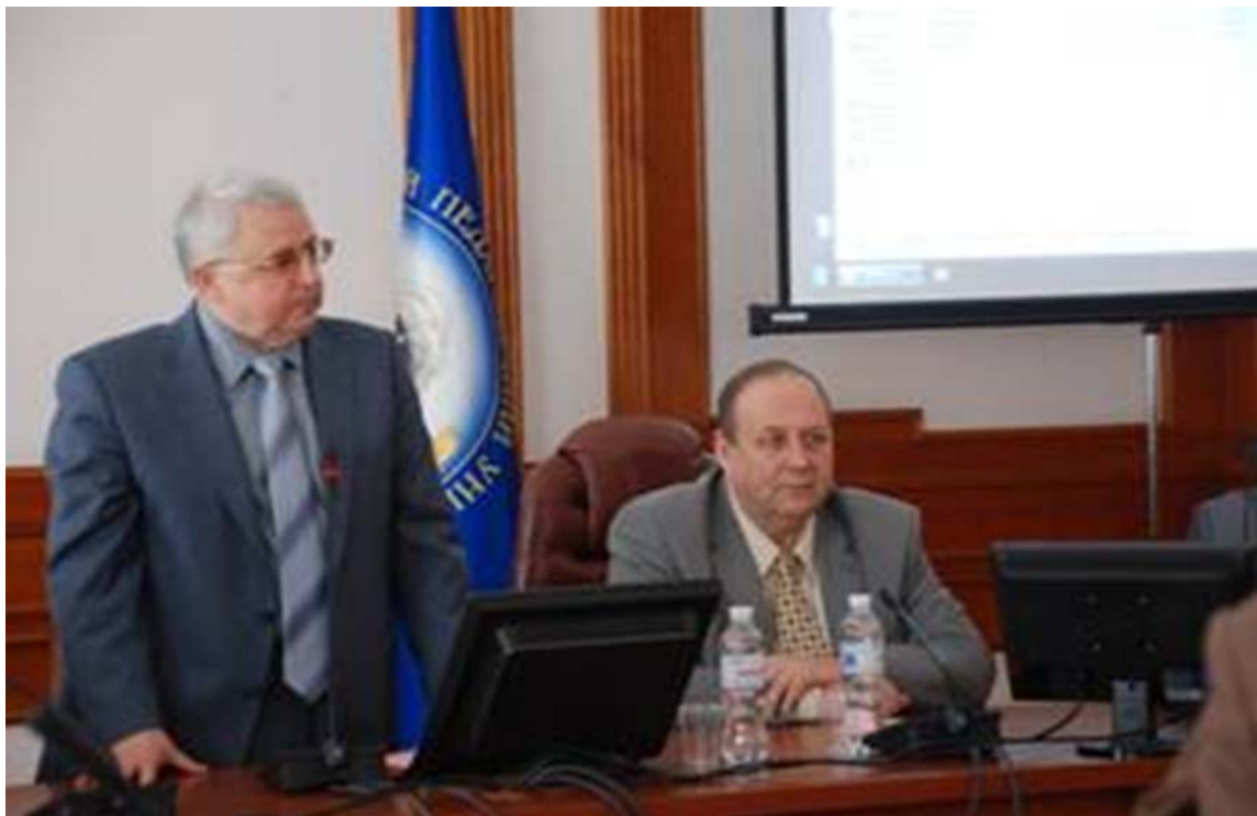
Студентська науково-практична конференція “Екологічні проблеми сучасності” на факультеті природничо-географічної освіти та екології (квітень 2016 рік)