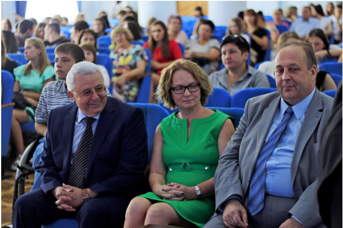
Посвята першокурсників-природничиківу студенти (2016 рік)