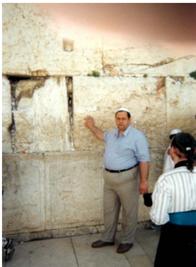
Офіційна поїздка до Ізраїлю. Стіна Плача. (1997 рік)