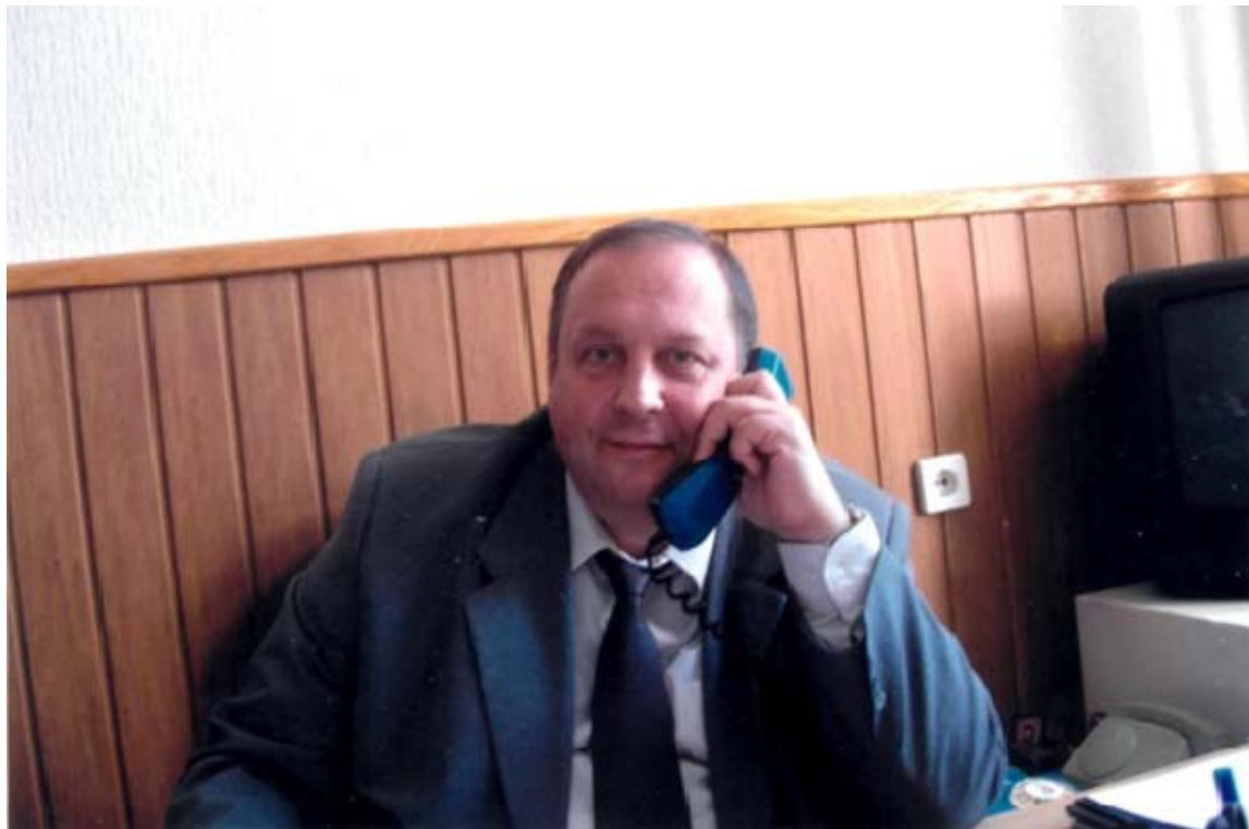
У кабінеті (2007 рік)