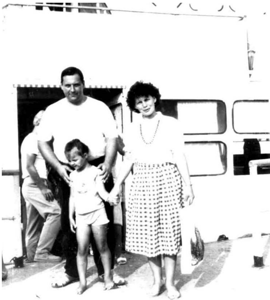
Відпочинок з сім'єю у Ялті (1992 рік)