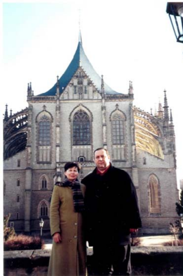
Польща, місто Кутна Гора. Храм святої Барбари (січень 2005 рік)