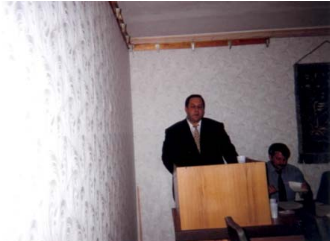
Захист кандидатської дисертації (22 червня 1999 року)