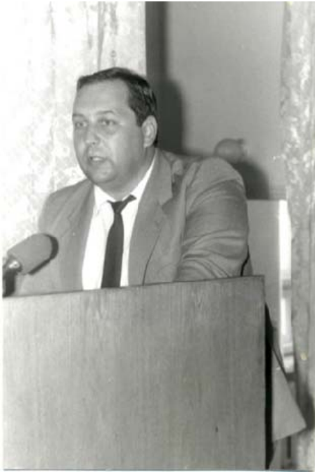
Виступ В. П. Покася, начальника управління дошкільних та інтернатних закладів Міністерства освіти України, в Корсунь-Шевченківському педагогічному училищі (1993 рік)