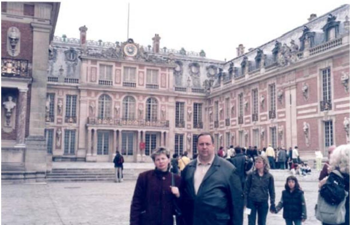
Франція, місто Версаль (8 травня 2006 рік)