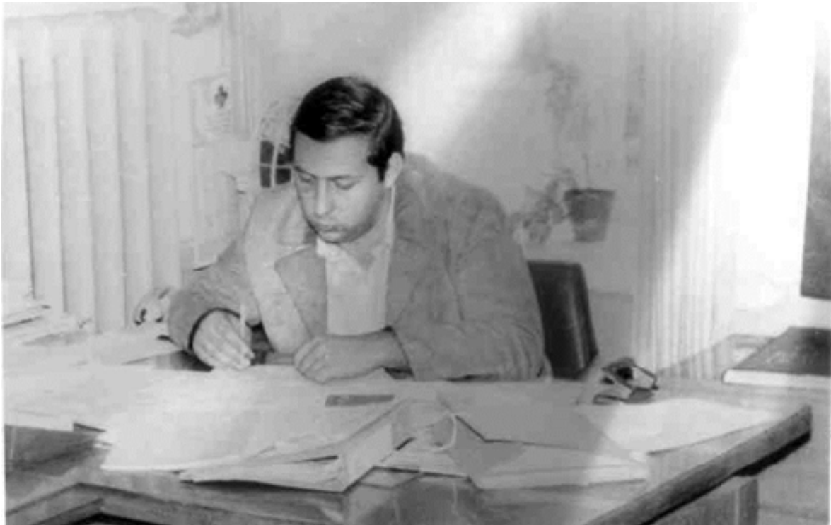
Студентські роки. Написання кваліфікаційної роботи (1984 рік)