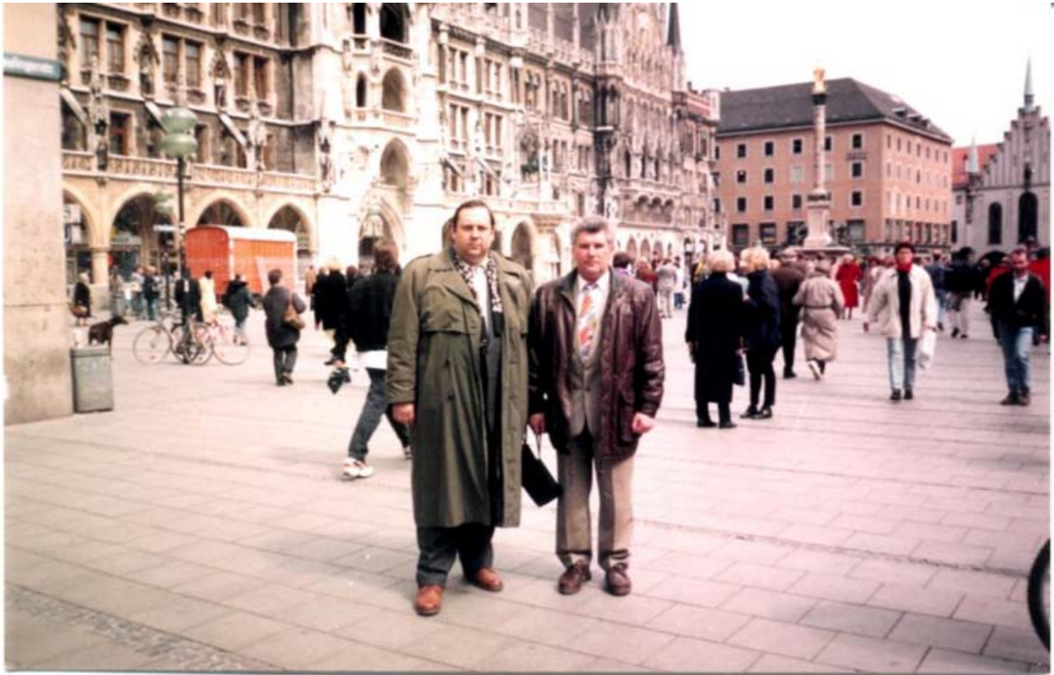
Офіційний візит до Мюнхена (1997 рік)