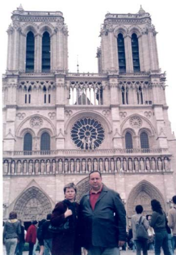
Франція, місто Париж. З дружиною біля головного собору Парижа Нотр-Дам де Парі (собор Паризької Богоматері), який стоїть у самому центрі міста на острові Сіте (місце, звідки починалася забудовуватися Франція) (2006 рік)