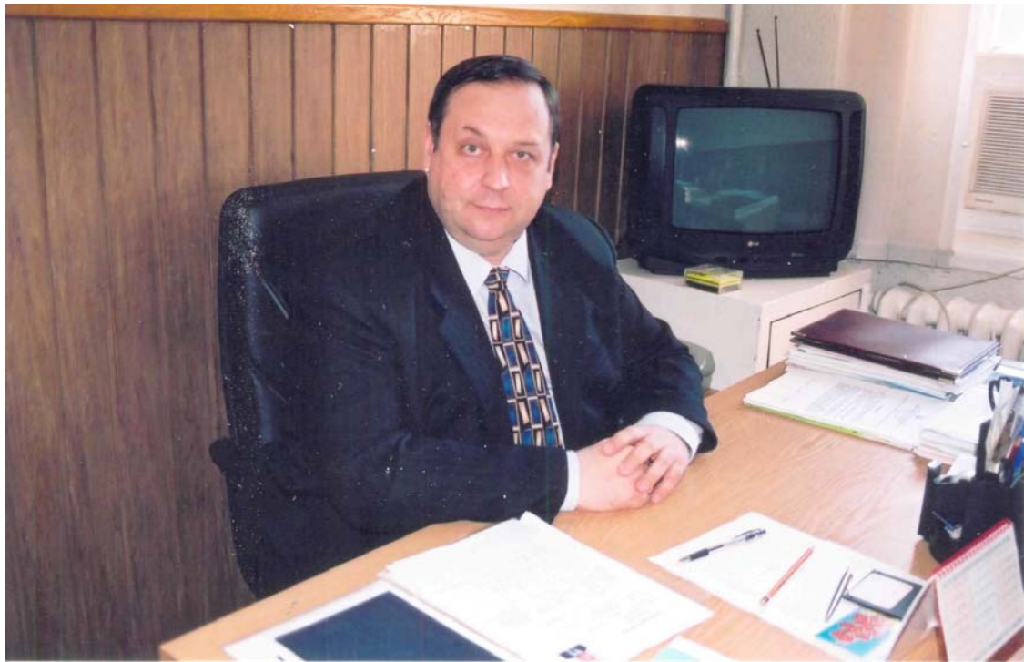
За робочим місцем (2001 рік)