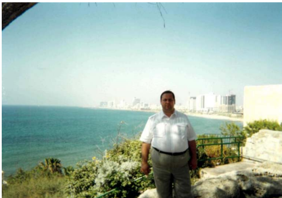
Офіційний візит до Ізраїлю. Місто Яффа. (1997 рік)