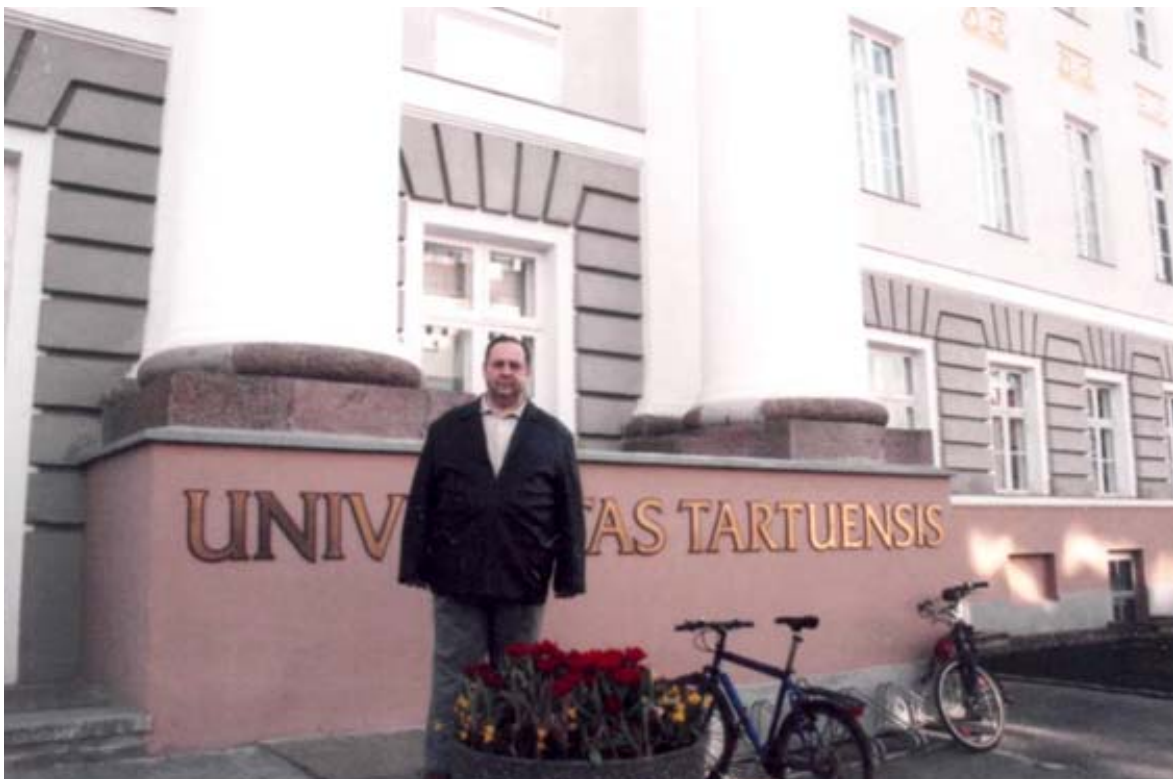
Естонія, місто Тарту. Відвідання університету (квітень, 2008 рік)