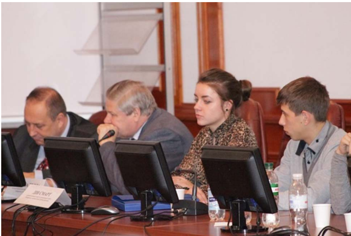
Нагородження студентів ректорськими та іменними стипендіями (2014 рік)