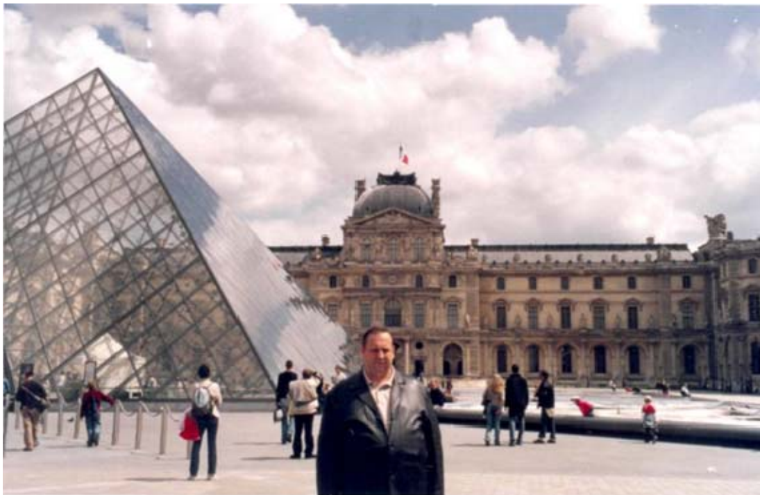
Франція, місто Париж. Відвідання Лувру – королівського палацу, найбільшого музею світу (2006 рік)