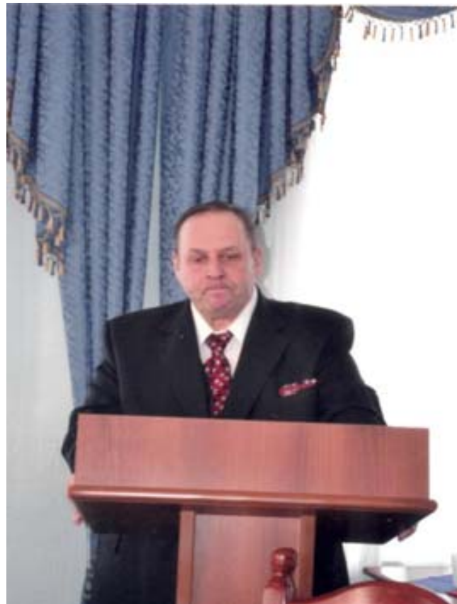
Захист докторської дисертації (2012 рік)