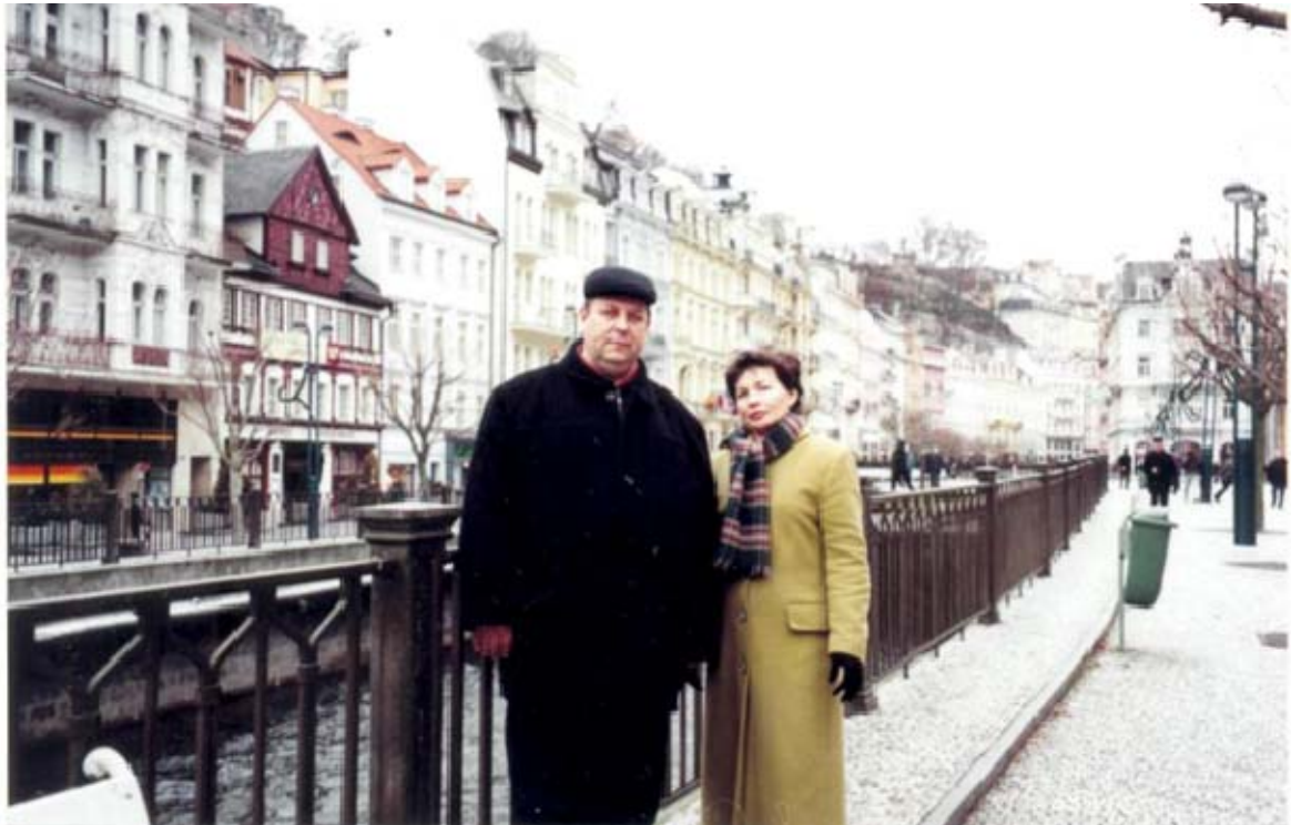
Різдво в Європі. Чехія, м. Карлові Вари (січень, 2005 рік)