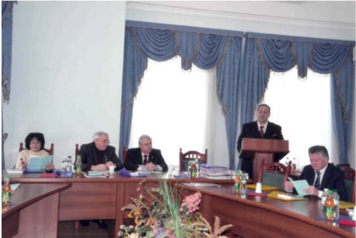
Захист докторської дисертації (2012 рік)