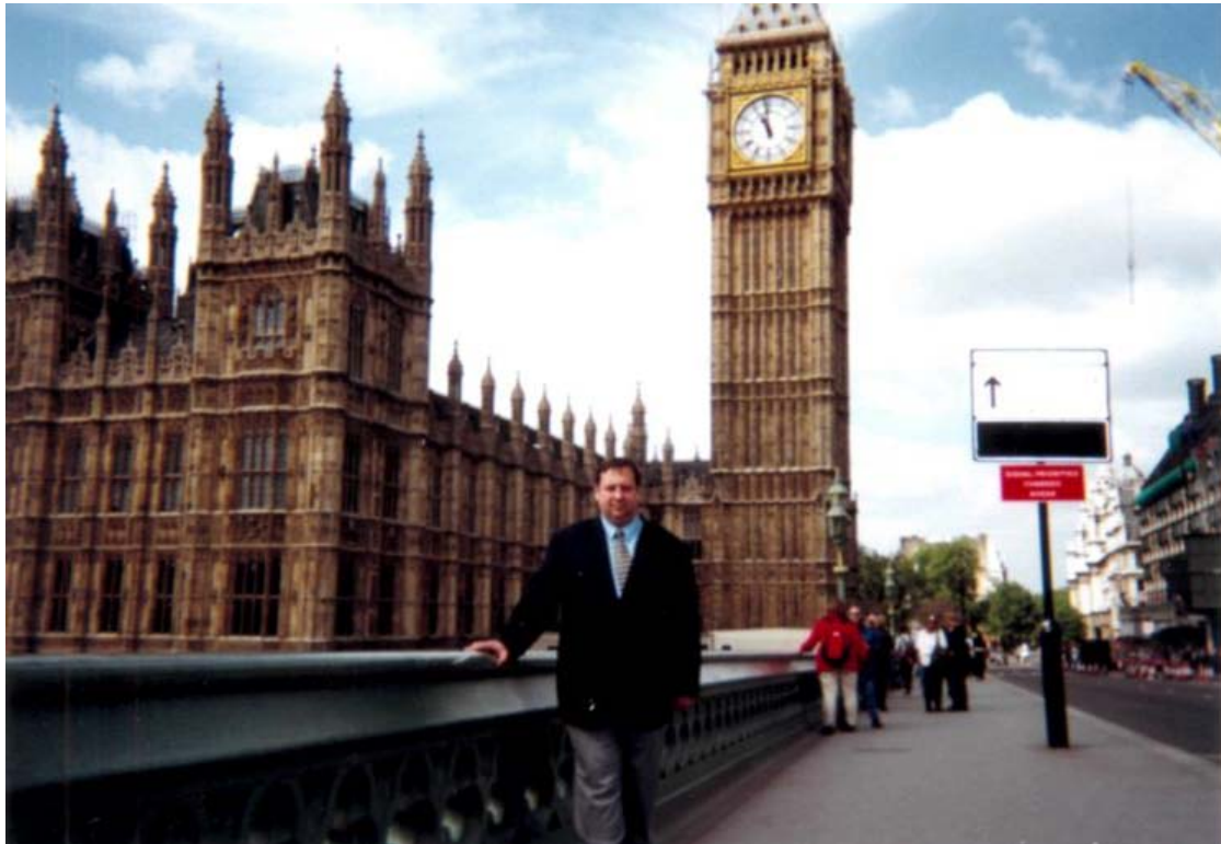
Офіційна поїздка. Велика Британія, місто Лондон. Біг-Бен (1999 рік)