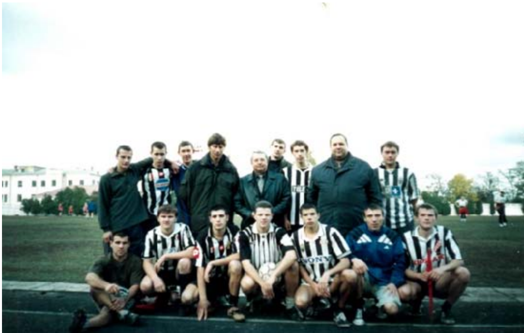
Студентська збірна футбольна команда факультету після виграшної гри (2003 рік)