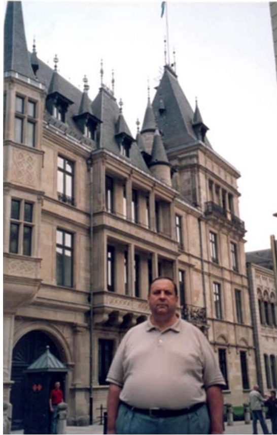
Герцогство Люксембург (травень, 2006 рік)