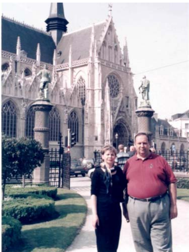
Бельгія, місто Брюссель (2006 рік)