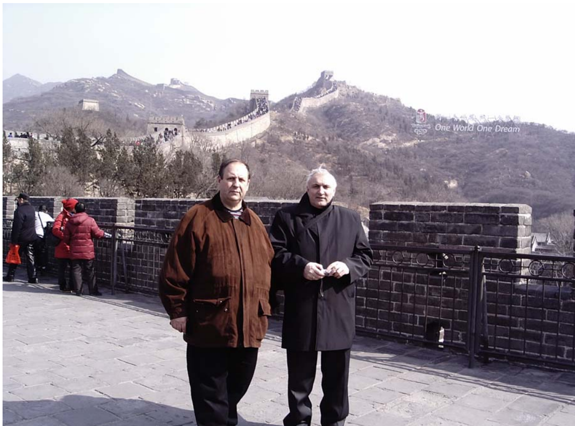
Китай, місто Пекін. Велика Китайська стіна (2011 рік)