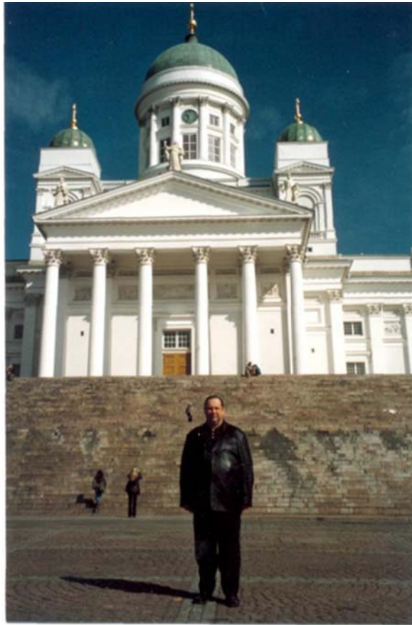
Фінляндія, місто Гельсінкі. Біля православного собору (2005 рік)