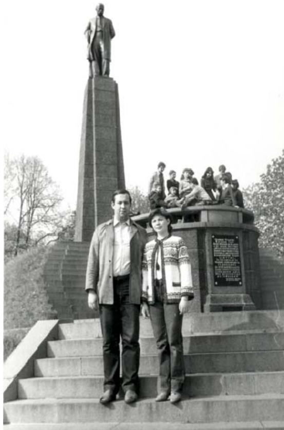
Місто Канів. На могилі Великого Кобзаря (квітень, 1984 рік)