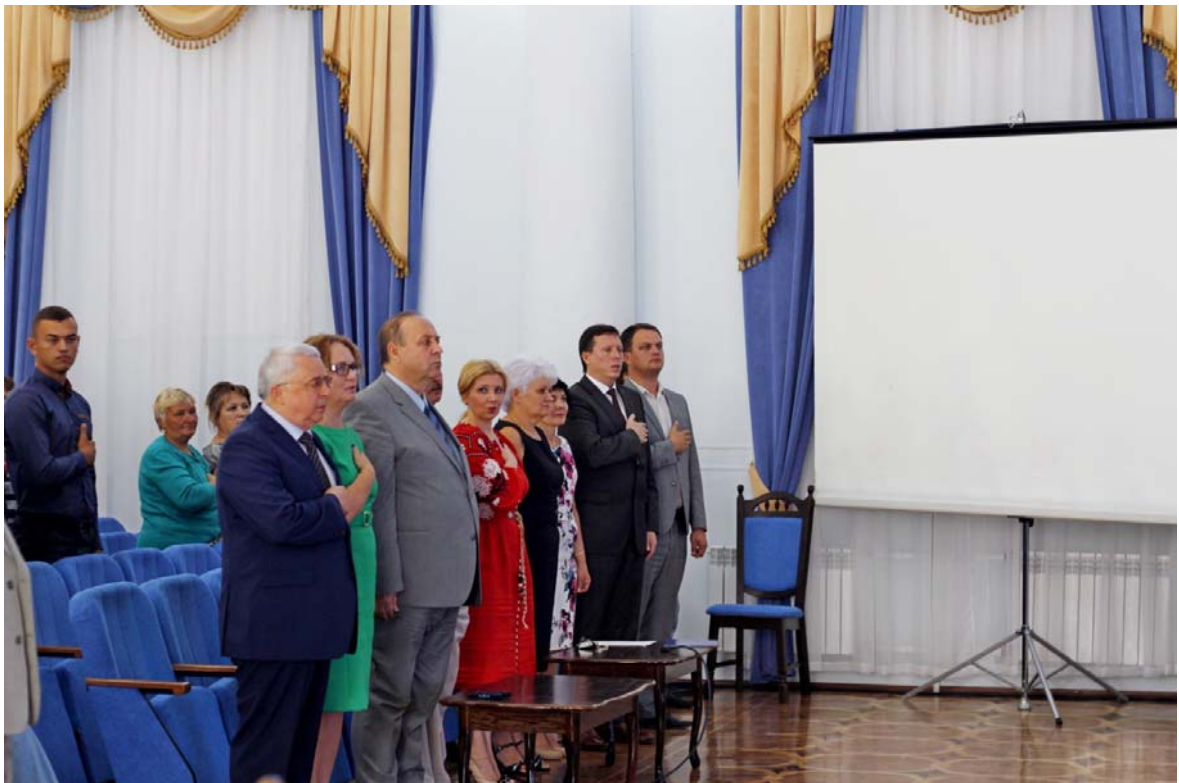
Посвята першокурсників у студенти (2016 рік)