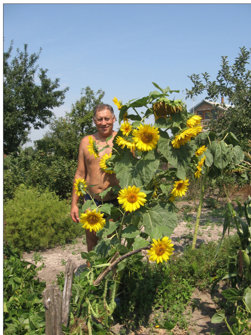
Улюблена рослина, 2005 р.