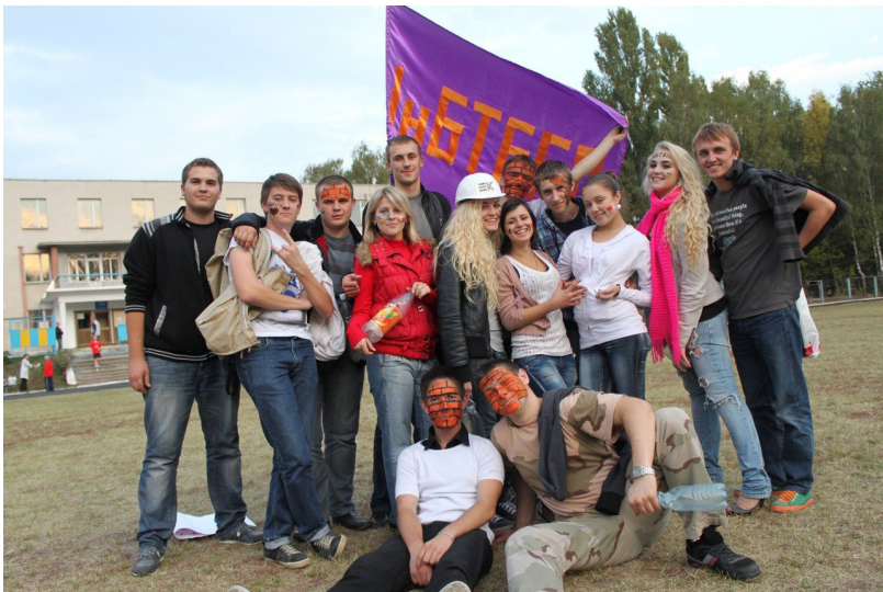
Команда факультету будівництва – чемпіон ВНТУ з футболу