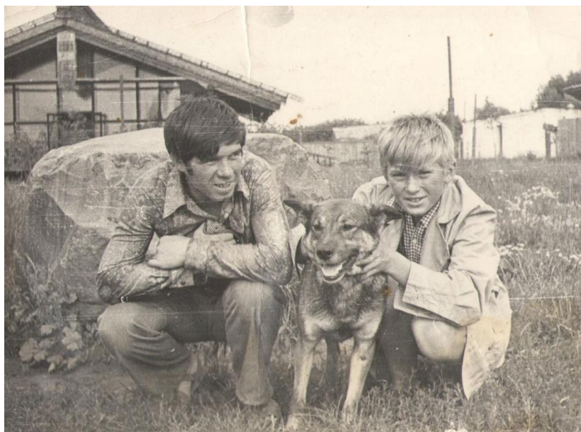
На батьківщині С. Єсеніна. 1974