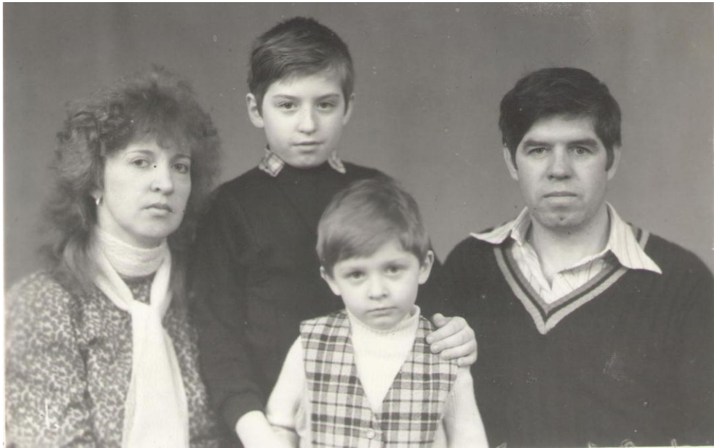
З дружиною і дітьми