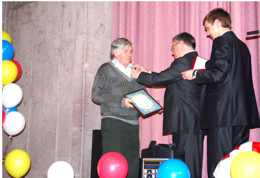
Вручення Почесного знаку «Хрест Петра Калнишевського». 2010