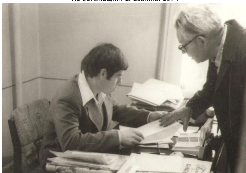
Роменський краєзнавчий музей. Завідуючий відділом