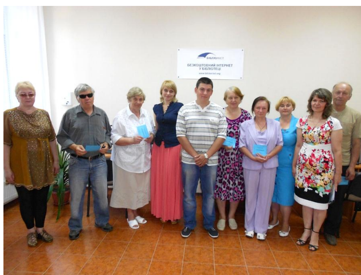
Випускники Університету III віку отримали сертифікати після проходження курсів комп'ютерної грамотності