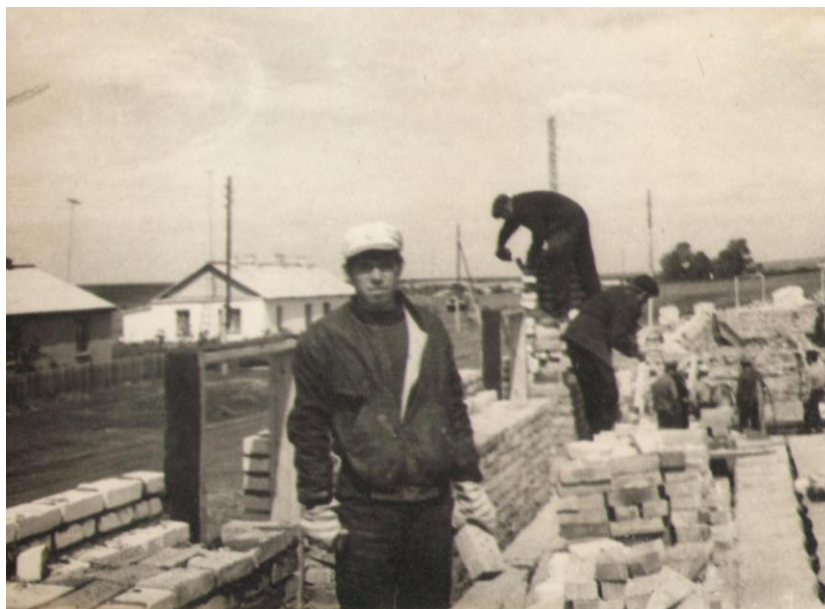
Студентський будівельний загін. 1971