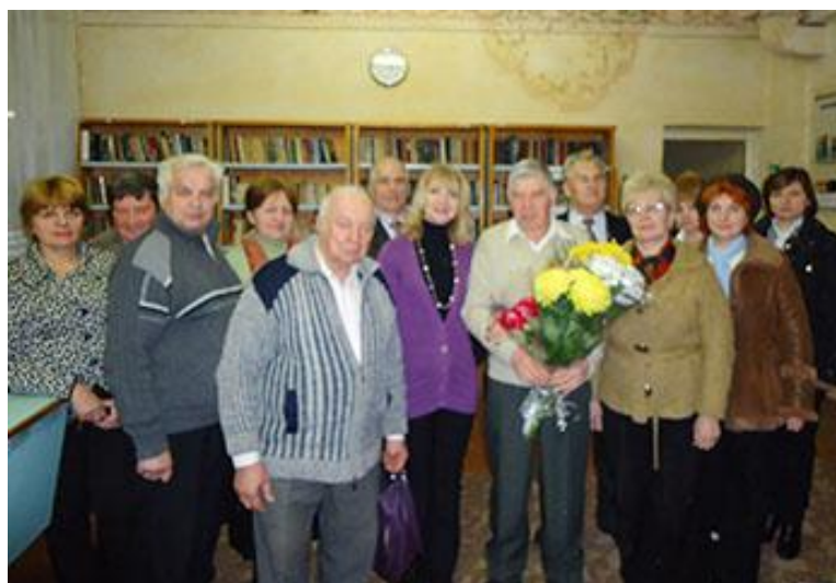
Моє 60-річчя у бібліотеці. 2011