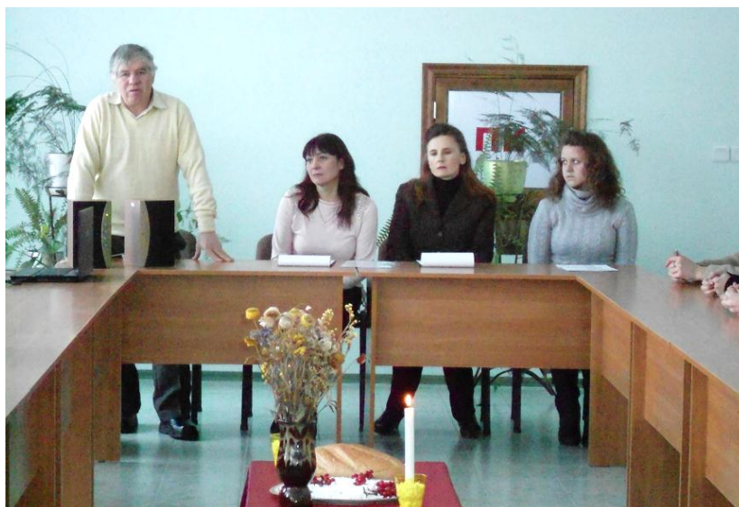
Захід до річниці пам'яті голодомору