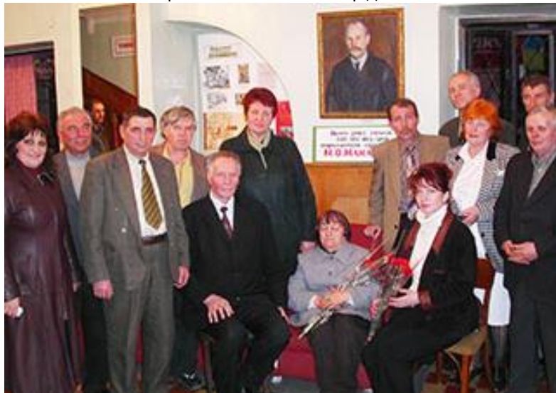
На вшануванні М. О. Макаренка. 2007