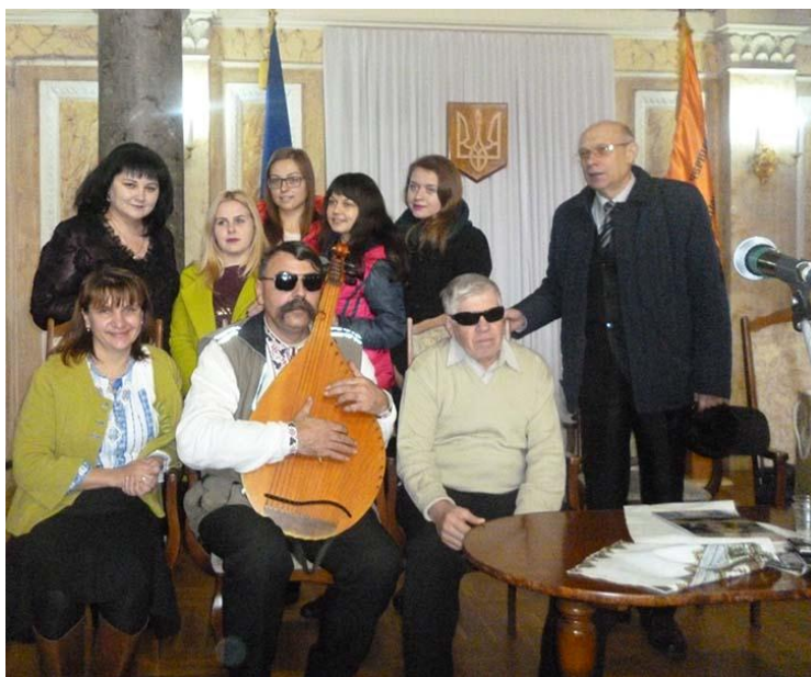
В Мармуровій залі Чернівецького національного університету ім. Ю. Федьковича