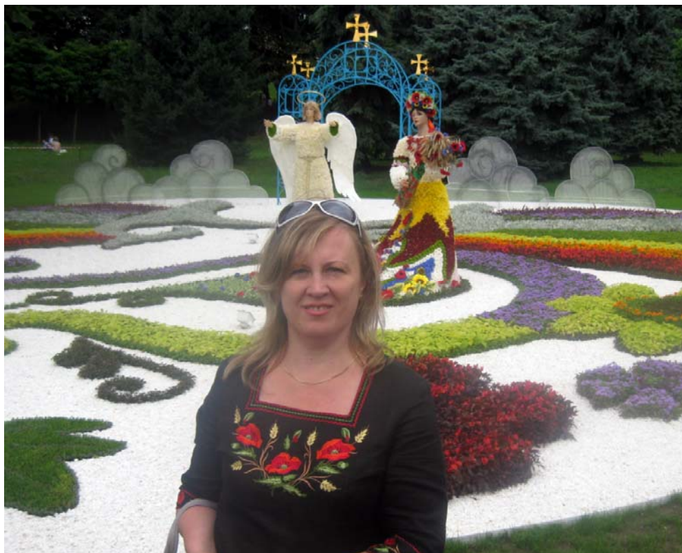
У День Незалежності України (м. Київ, 24 серпня 2014 р.)