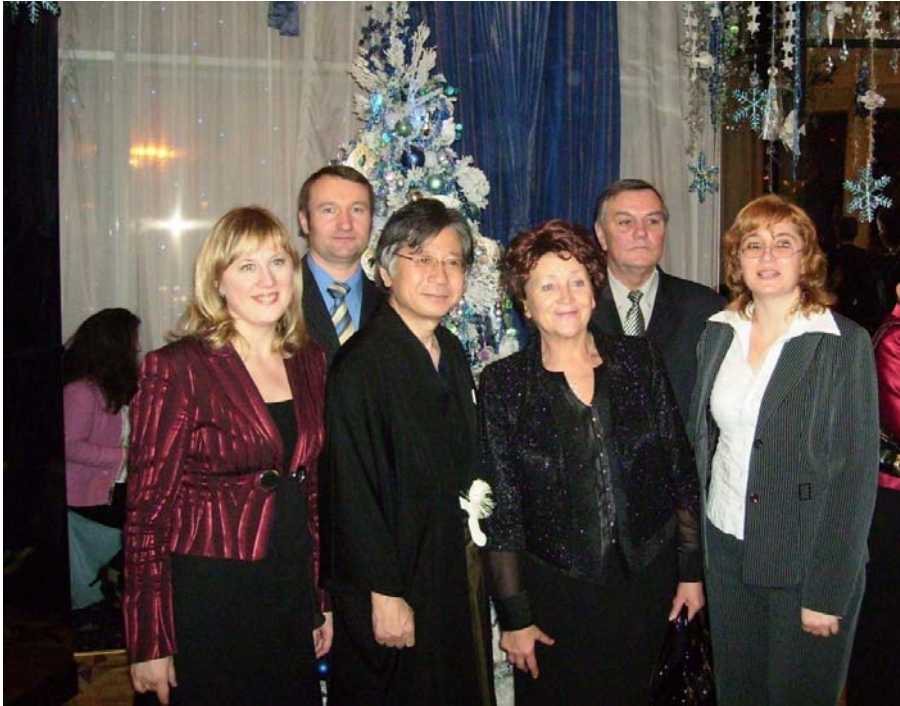
На святкуванні Дня народження Імператора Японії за запрошенням Надзвичайного і Повноважного Посла Японії в Україні Муцуо Мабучі (м. Київ, 10 грудня 2007 р.)