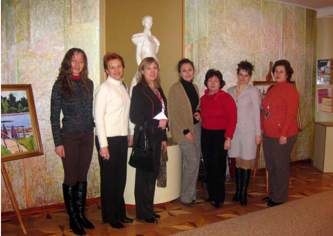
З колегами в музеї Лесі Українки Східноєвропейського національного університету імені Лесі Українки (м. Луцьк, 25 листопада, 2008 р.)