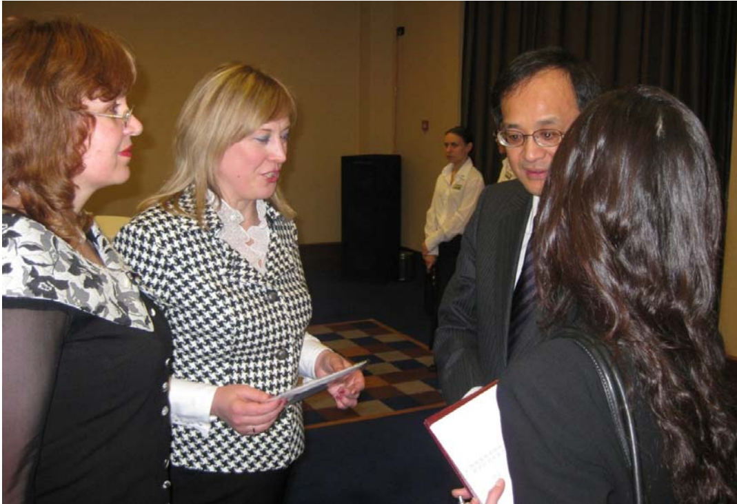
Під час бесіди з Надзвичайним і Повноважним Послом Японії в Україні Тадаші Ідзава (м. Київ, 15 грудня 2008 р.)