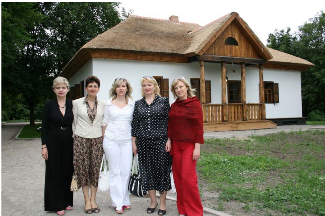
На батьківщині М.В. Гоголя в складі журі Гоголівського конкурсу (с. Гоголеве, Полтавська обл., 5 червня 2009 р.)