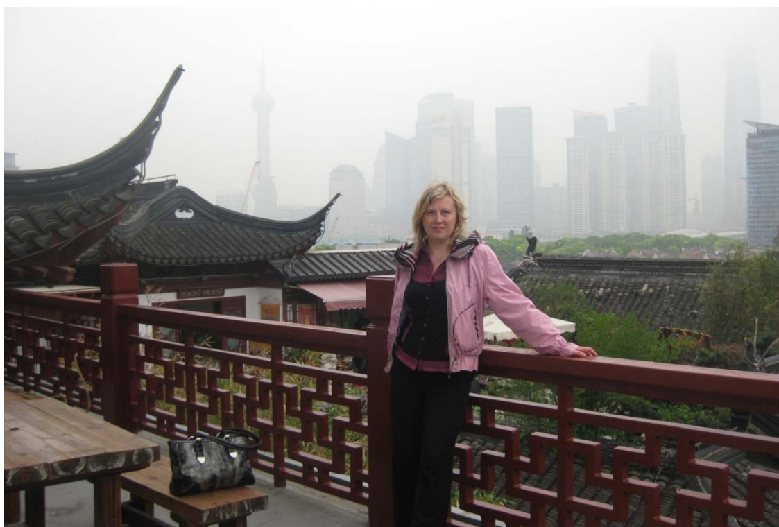
Під час прогулянки м. Шанхаєм (11 травня 2011 р.)