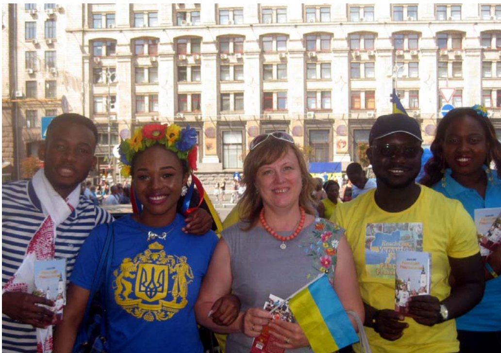
На Хрещатику (м. Київ, 24 серпня 2015 р.)