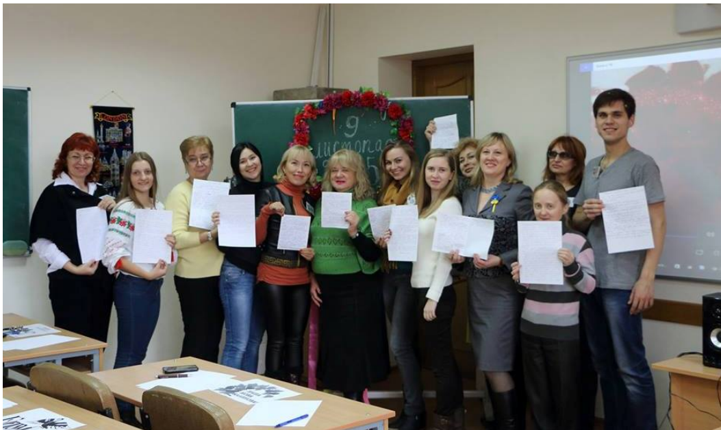
Усі щасливі – диктант написали! З колегами і студентами в День української писемності та мови (9 листопада 2015 р.)