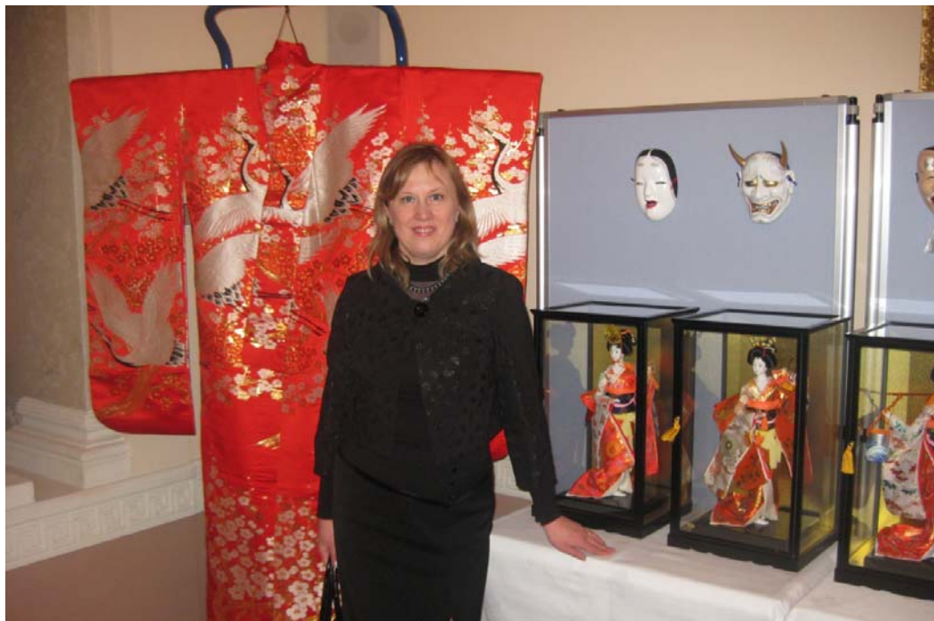
На святкуванні Дня народження Імператора Японії за запрошенням Надзвичайного і Повноважного Посла Японії в Україні Тадаші Ідзава (м. Київ, 10 грудня 2010 р.)