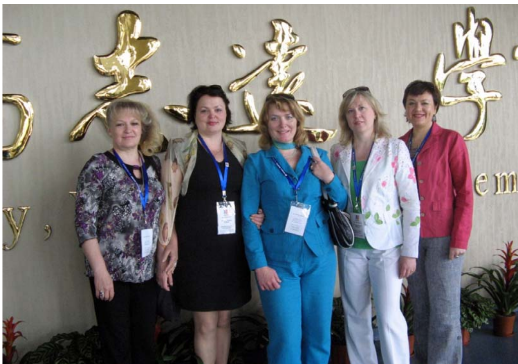
З колегами на Міжнародному конгресі в Шанхайському університеті іноземних мов (м. Шанхай, Китай, 10 травня 2011 р.)