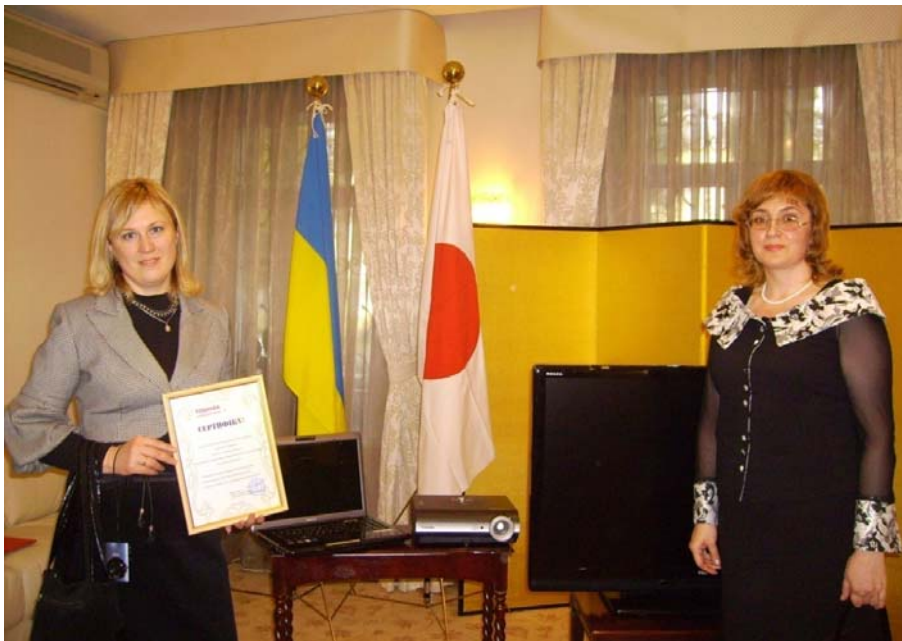
У резиденції посла Японії в Україні на церемонії дарування мультимедійної техніки Інституту іноземної філології (1 жовтня 2008 р.)