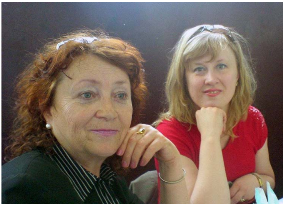
У Шепетинській ЗОШ Дубенського району Рівненської області під час Всеукраїнського науково-практичного семінару "Використання інтерактивних технологій у процесі вивчення зарубіжної літератури" (15 травня 2007 р.)