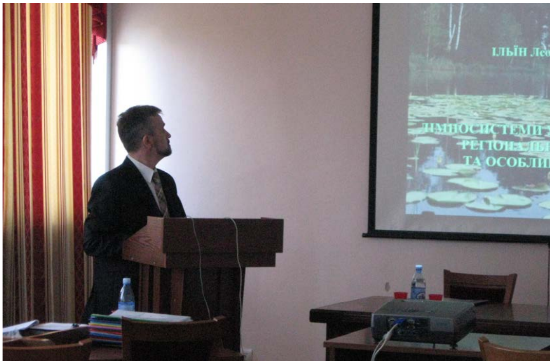
Захист докторської дисертації у Київському національному університеті імені Тараса Шевченка (25 травня 2009 р.)