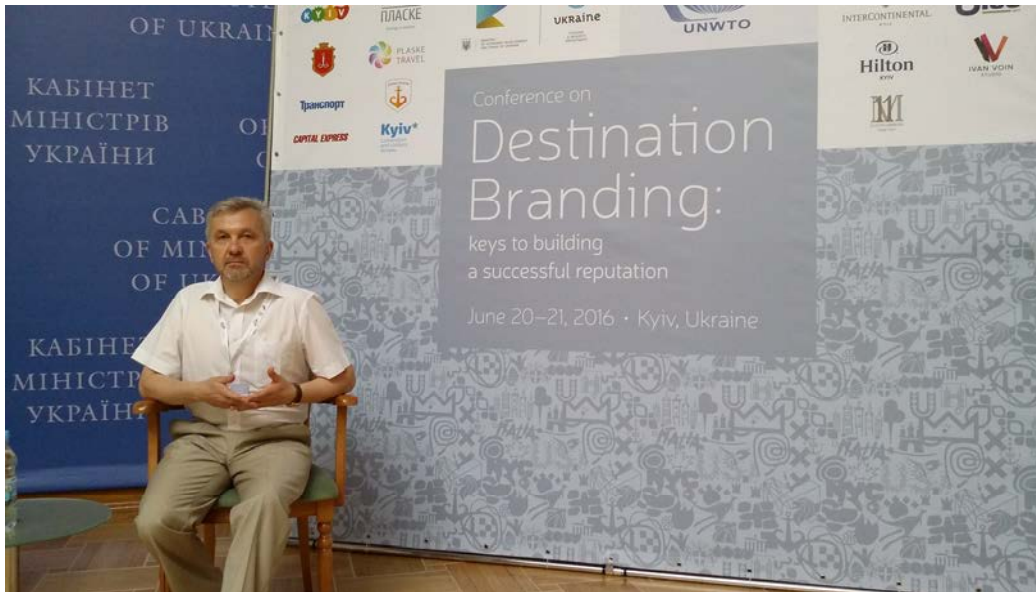
На засіданні наукової ради з туризму і курортів Міністерства економічного розвитку і торгівлі (21 червня 2016 р.)