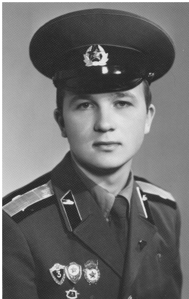
Старшина (Група радянських військ у Німеччині, 1987 р.)