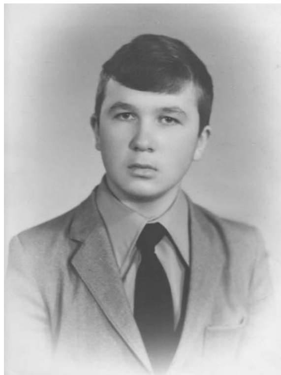
Випускник середньої школи (1984 р.)