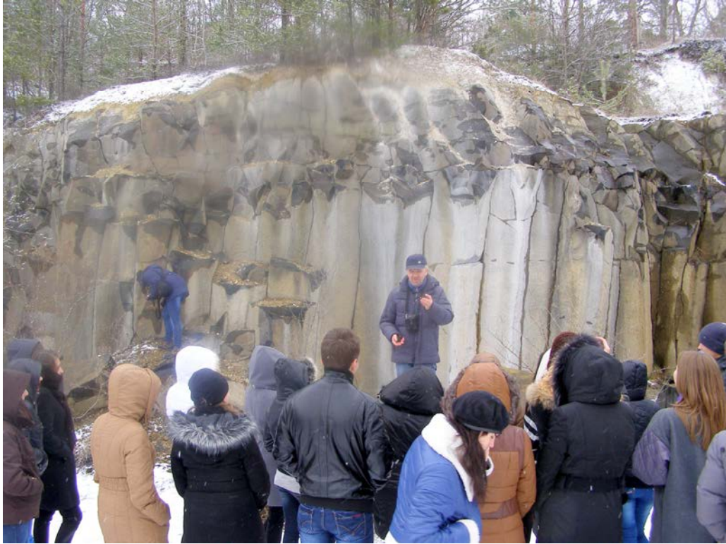
Заняття на виїзді (Рівненщина)