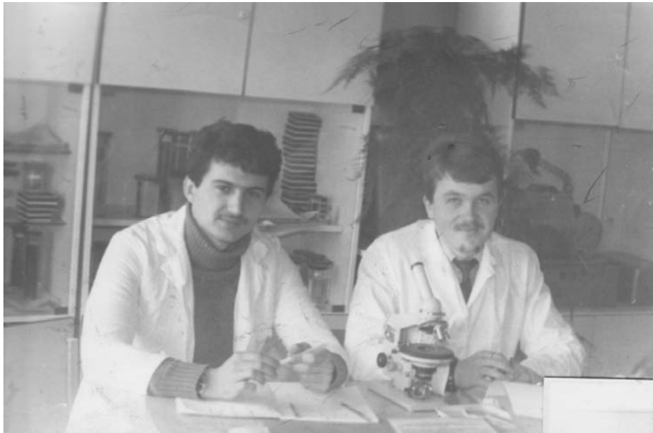
На практичному занятті (1988 р.)