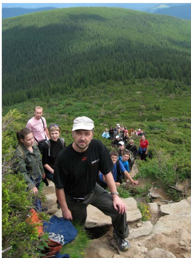
Навчальна природничо-наукова практика в Карпатському національному природному парку