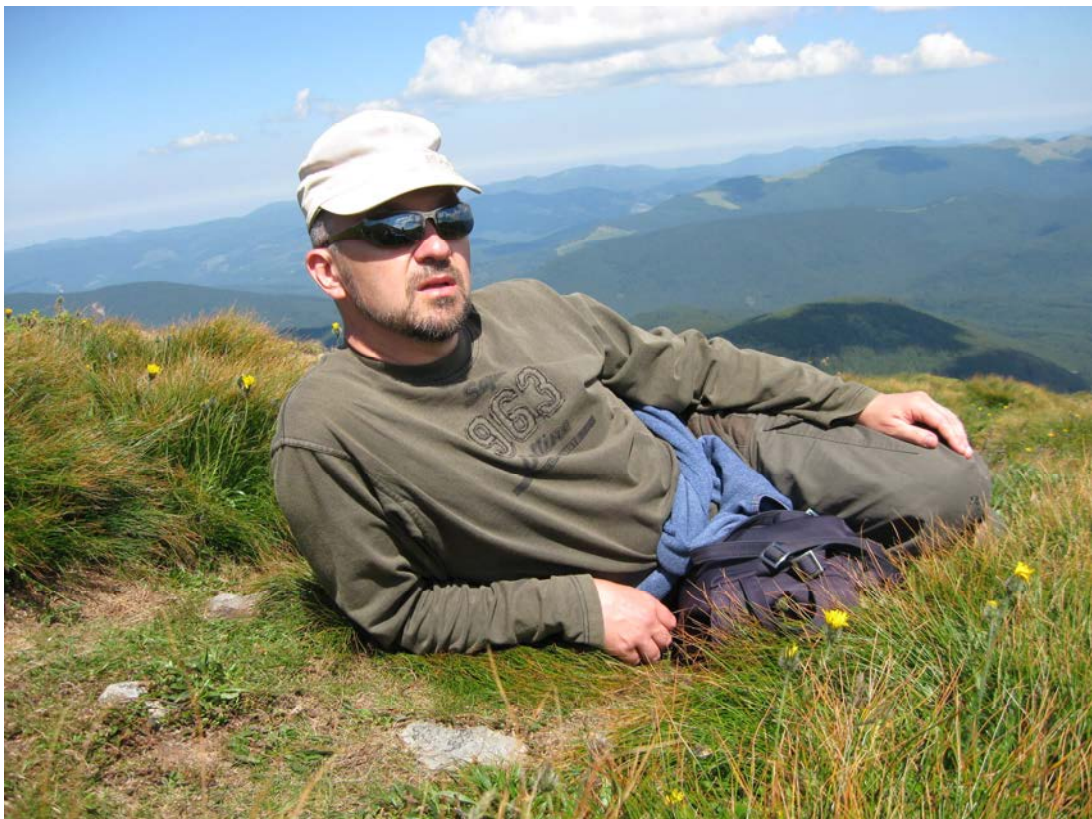
В Українських Карпатах