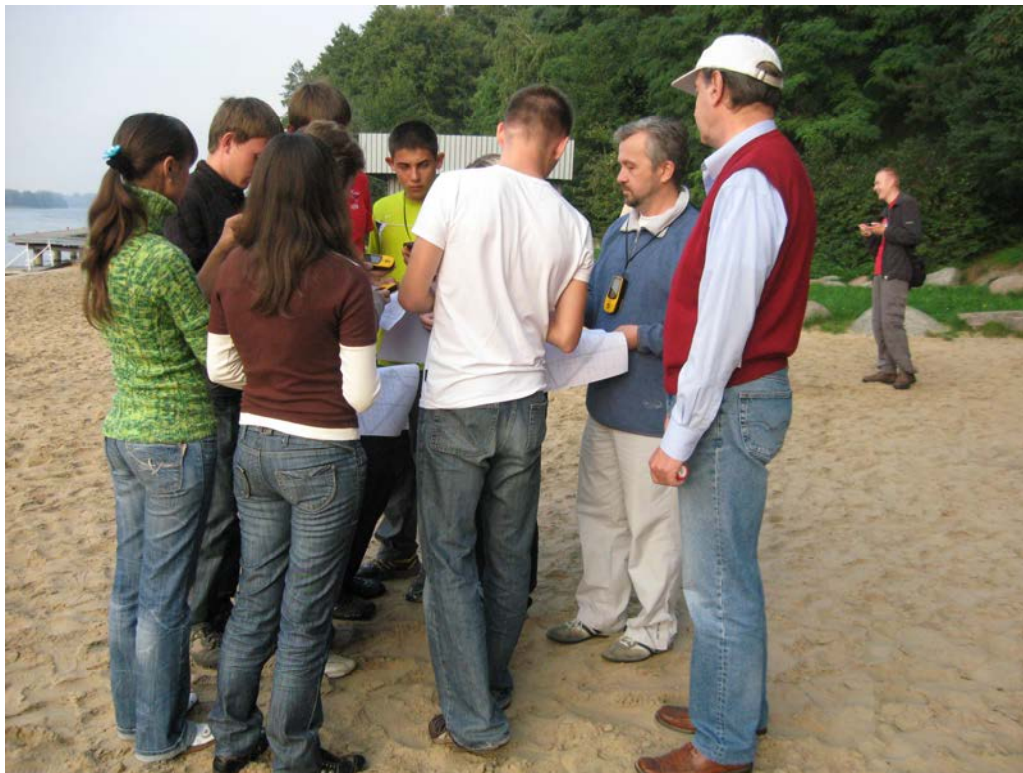
З проф. Зигмунтом Млінарчеком (Польща) під час практичних занять зі студентами СНУ ім. Лесі Українки (навчальна природничо-наукова практика, Великопольське Поозер'я, Польща)