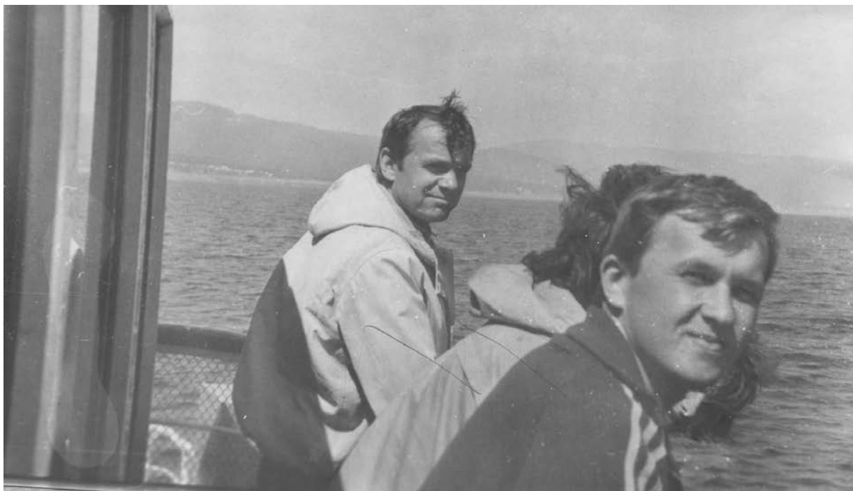
На озері Байкал (комплексна практика, 1990 р.)