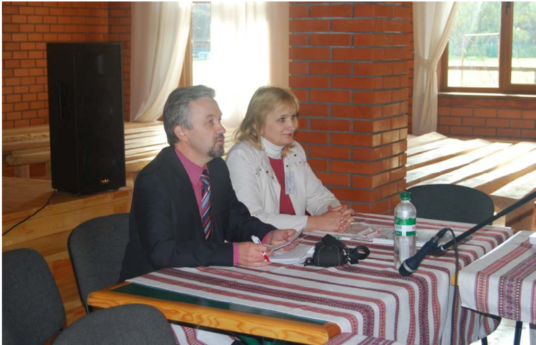
Під час Міжнародної науково-практичної конференції в Шацькому національному природному парку (2012 р. )