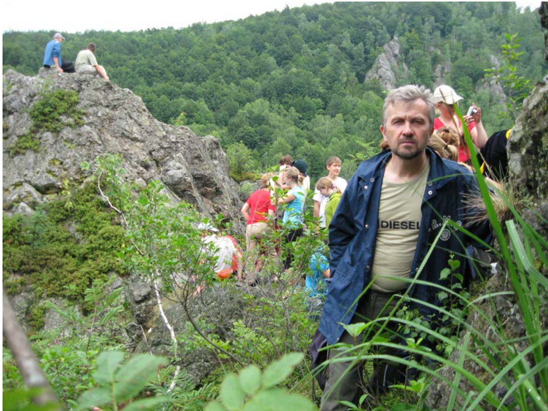
Навчальна природничо-наукова практика в Закарпатті