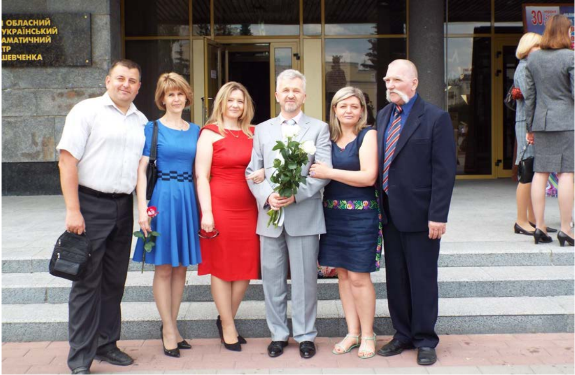
З членами кафедри туризму та готельного господарства (2016 р.)