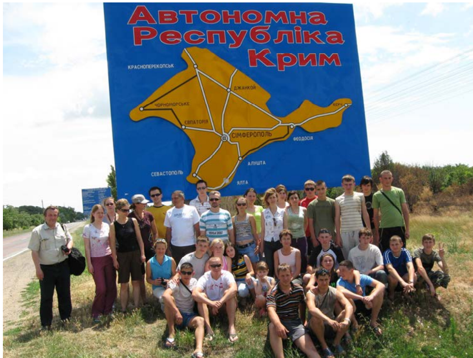
Спільна українсько-польська навчальна професійно-орієнтована практика студентів-туризмознавців СНУ ім. Лесі Українки та Університету ім. Адама Міцкевича в Познані (Польща)