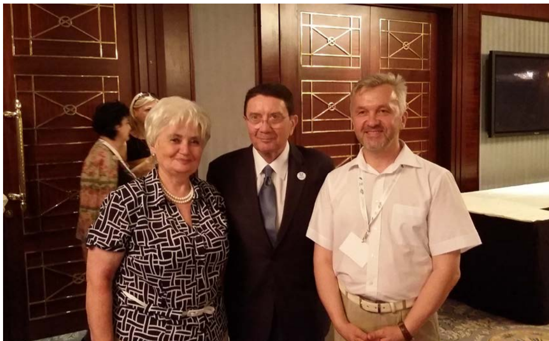
З Талемом Ріфаї, Генеральним секретарем Всесвітньої туристичної організації (UNWTO) (2016 р.)