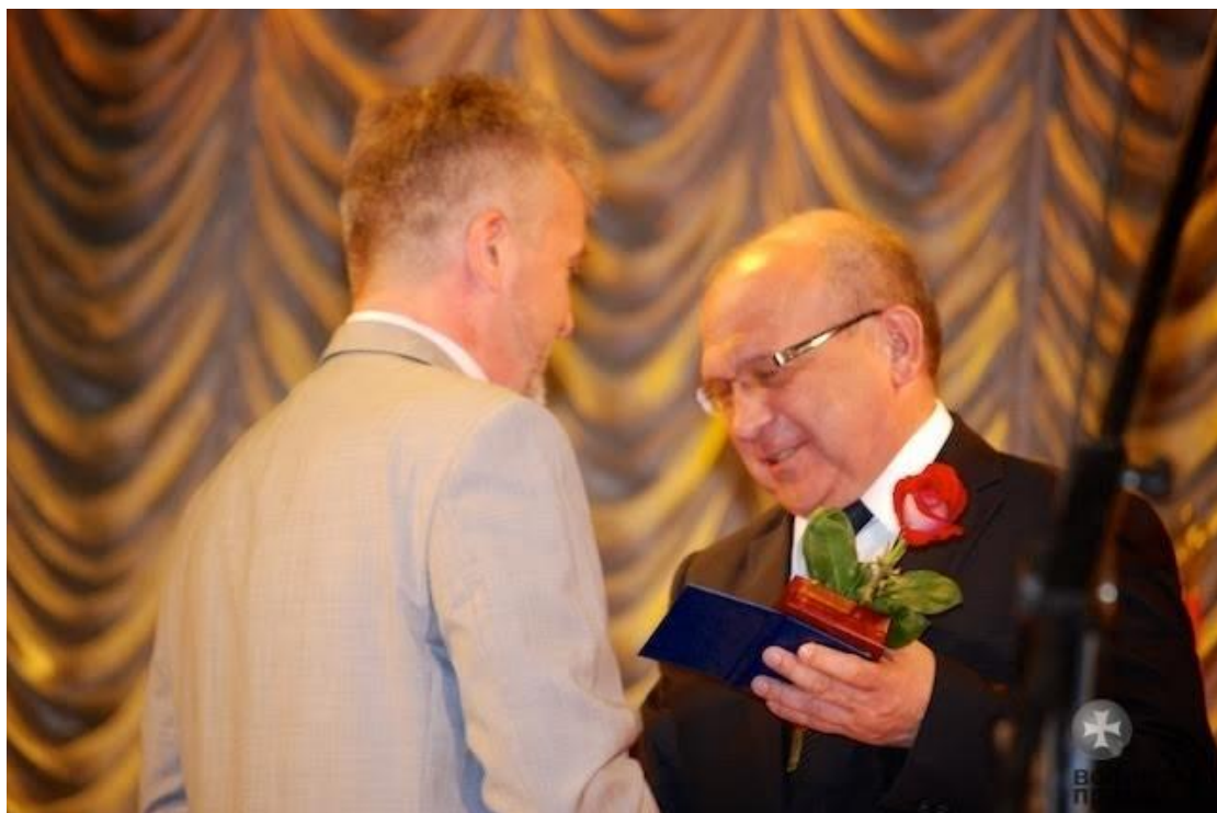
Вручення нагрудного знака «Відмінник освіти» (2016 р.)