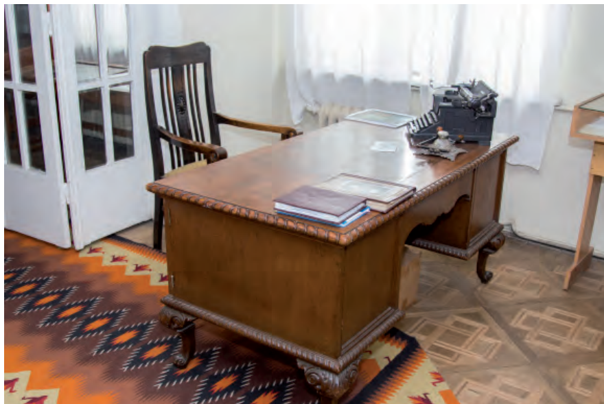
Виставкова зала музею