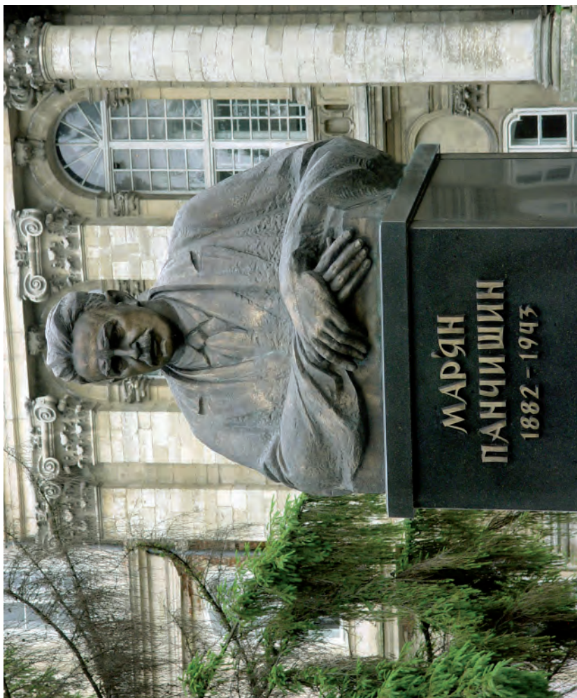
Пам'ятник М. Панчинину на площі перед Львівською областною клінічною лікарнею.