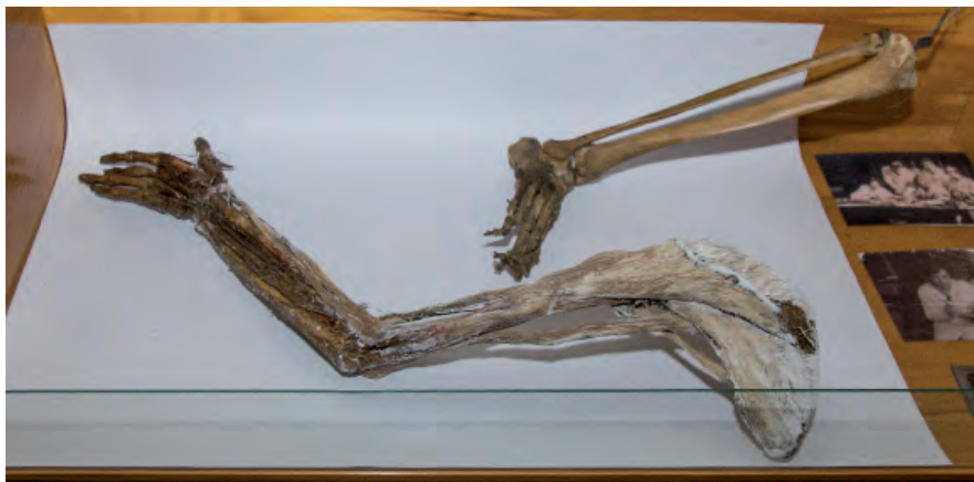
Муляжі кінцівок для наочної демонстрації студентам, які власноруч виготовив М. Панчишин