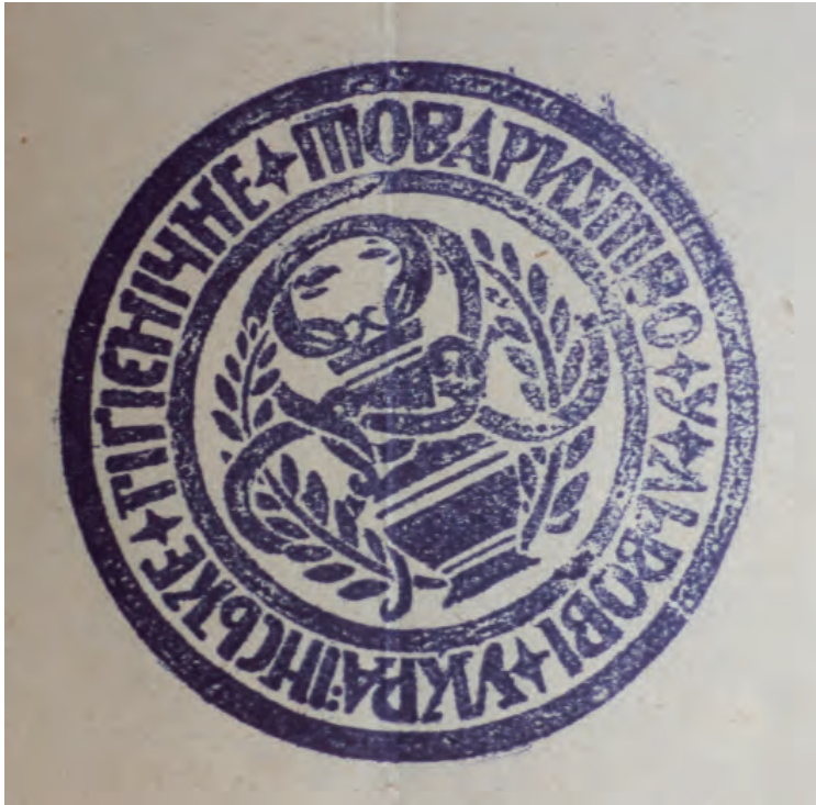
Печатка Українського гігієнічного товариства у Львові