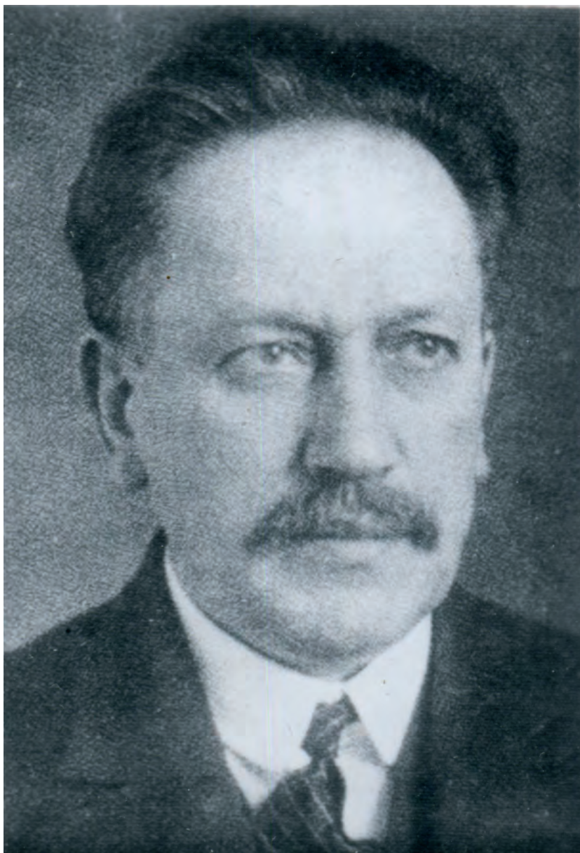
Мар'ян Панчишин (1939 р.)