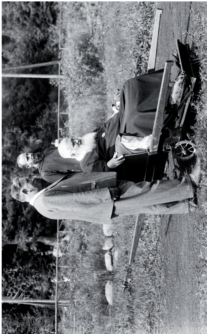
Митрополит Андрей Шептицький, його особистий лікар д-р Мар'ян Панчишин та монах-студит брат Атаназій (Підлюте, липень-серпень 1935 р.)