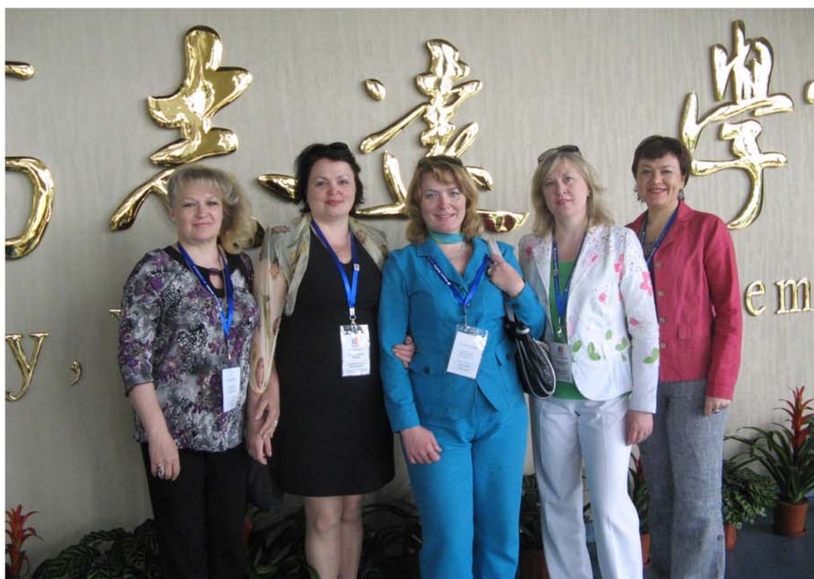
На міжнародній конференції в м. Шанхай (КНР), травень 2011 р.