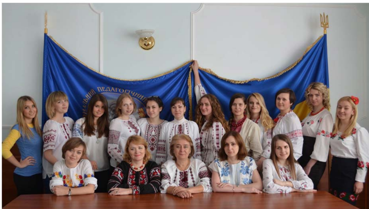
15.05.2014. День вишиванки на факультеті іноземної філології