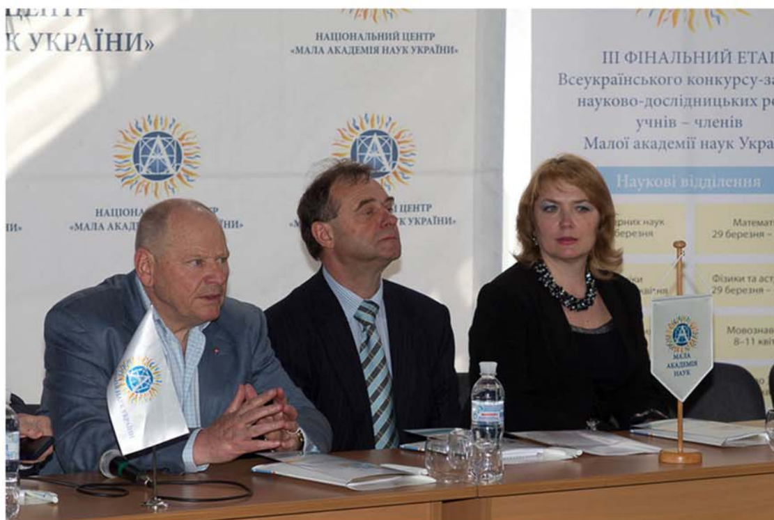
Співпраця з Малою академією наук України