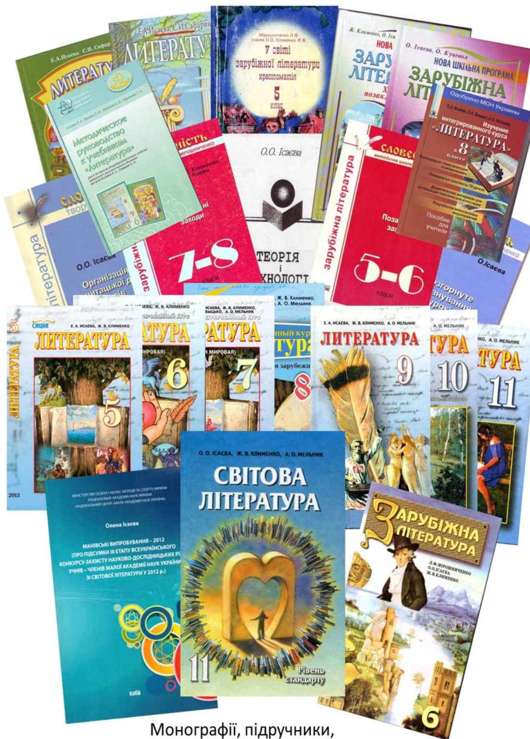
Монографії, підручники, посібники проф. Ісаєвої О.О.