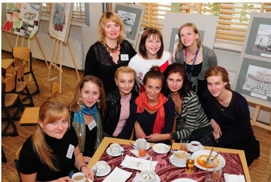
Разом зі студентами на Міжнародному студентському фестивалі у м. Варшава, 22.09.2010