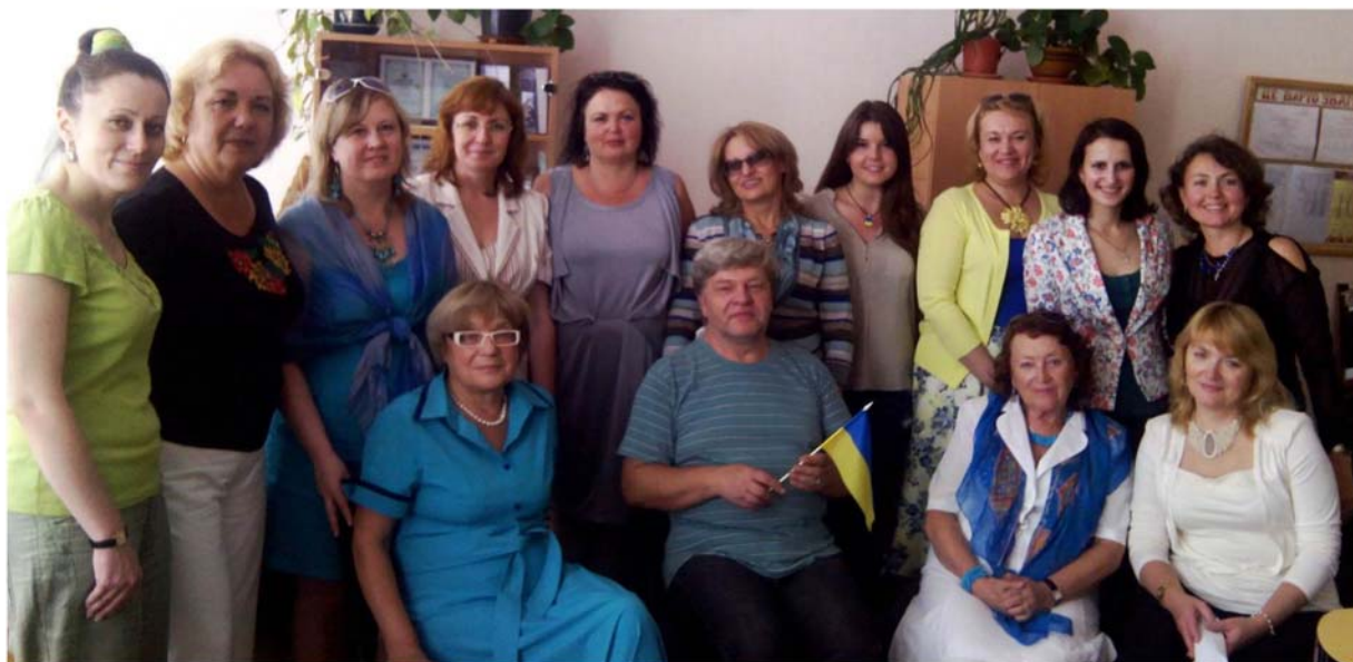
У колі рідної кафедри, вересень 2014 р.