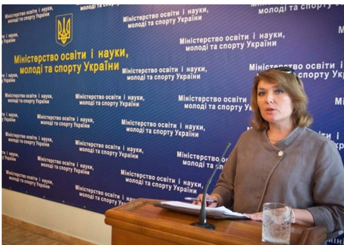
Виступ на колегії МОН (травень 2013 р.)