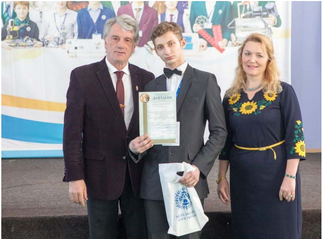
Віктор Ющенко та Олена Ісаєва нагороджують переможців відділення літературознавства, фольклористики та мистецтвознавства Всеукраїнського конкурсу-захисту МАН (2017)