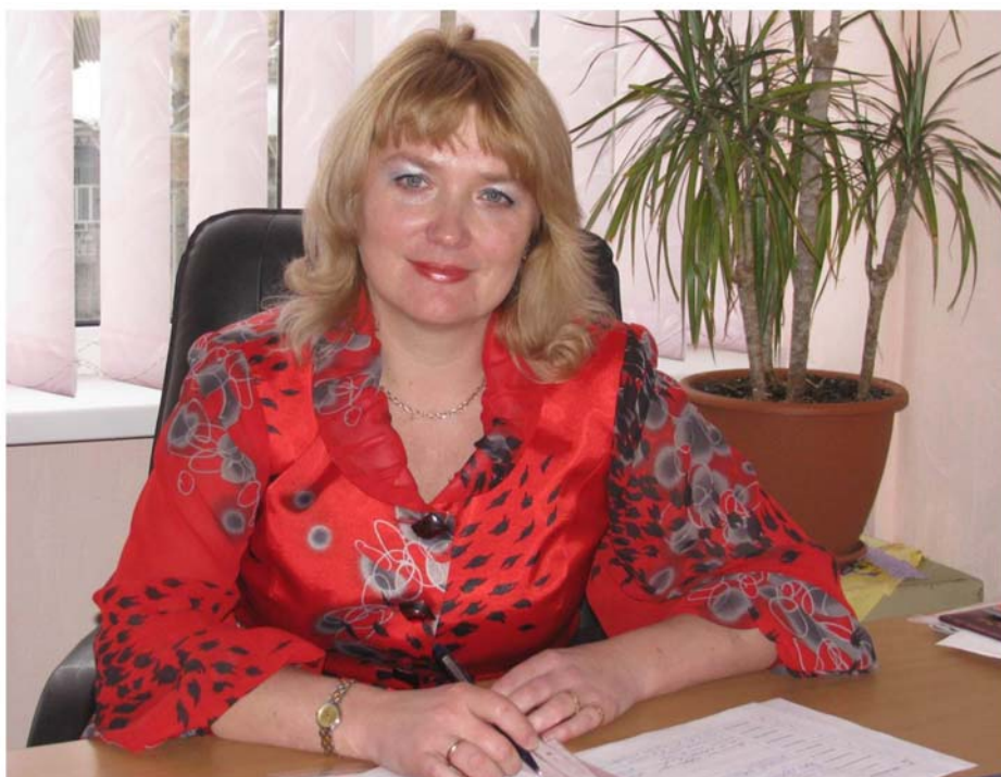
На кафедрі, 05.03.2010 р.