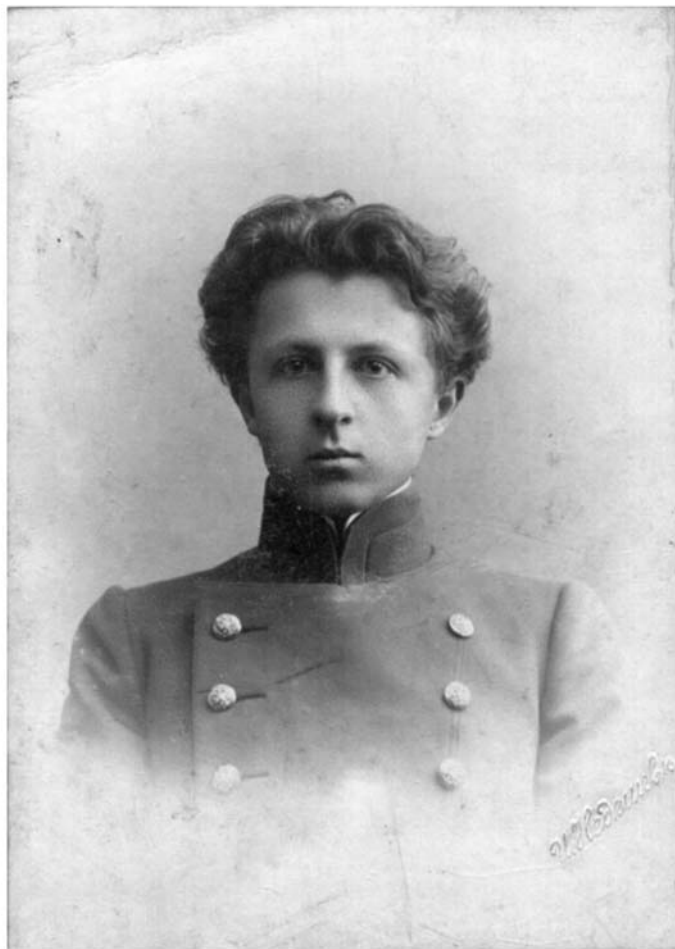
М. В. Птуха – студент перших курсів Петербурзького університету (1906–1907 рр.)