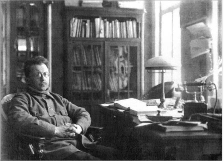
М. В. Птуха у своєму кабінеті (перша половина 30-х років)