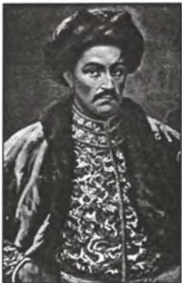
Гетьман Іван Мазепа – Національний герой України, великий син Української Православної Церкви.

Царизм не одне століття, а згодом і комуно-московська машина, багато років переконували українську спільноту, що