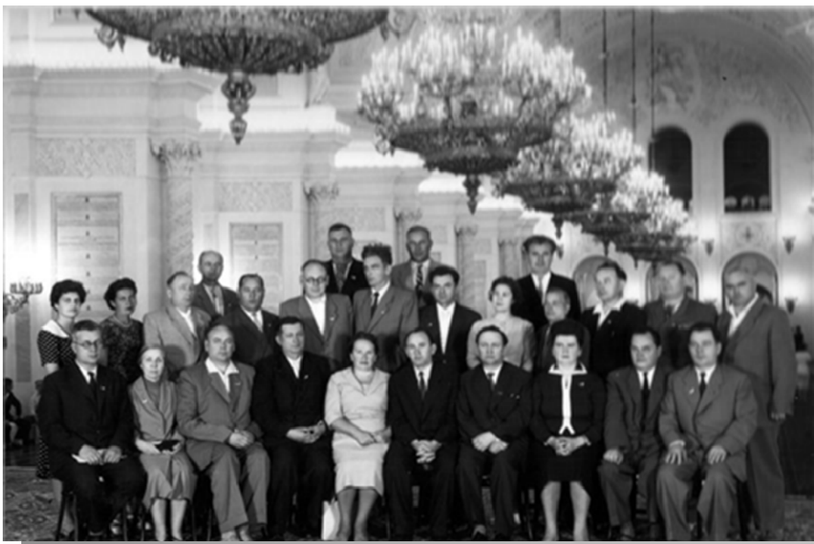
4-7 липня 1961 р., Москва. Марія Максимівна (в центрі) на Всесоюзній нараді працівників вищої школи

педагогічного університету імені М. П. Драгоманова – то перший крок ректора Київського педагогічного інституту імені О. М. Горького академіка Марії Максимівни Підтиченко. У правильності обраного Марією Максимівною європейського курсу академічного розвитку свідчить курс сучасної України на співпрацю у Європейському просторі.