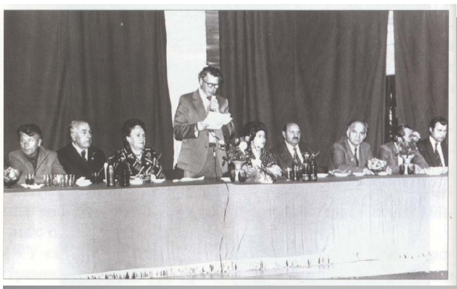
Марія Максимівна під час святкування 25-річчя Київської міської організації Товариства "Знання"

Серед різних категорій слухачів лунали її цікаві і зворушливі виступи.