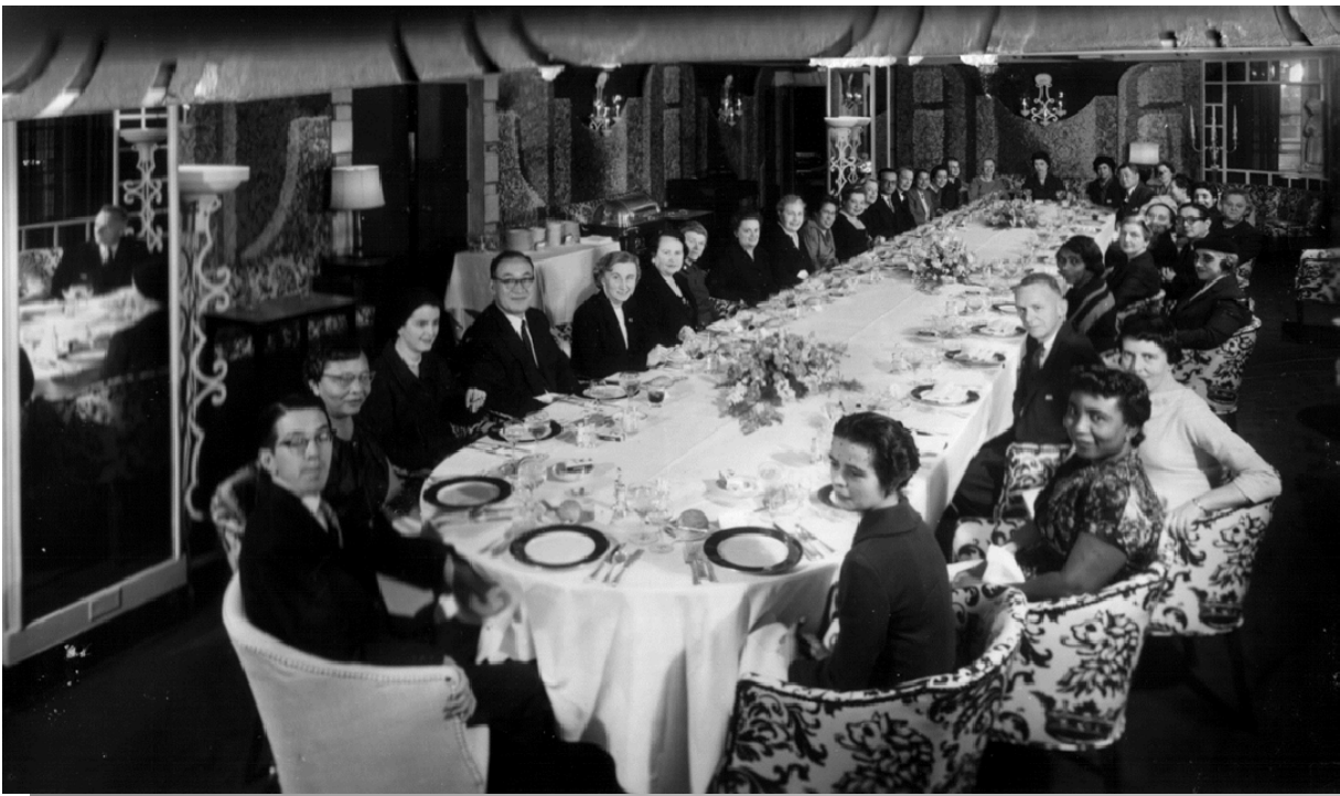
20.11.1958 р. США. Прійом Президії МДФЖ, організований Елеонорою Ейзенхауер в овальній залі Білого дому