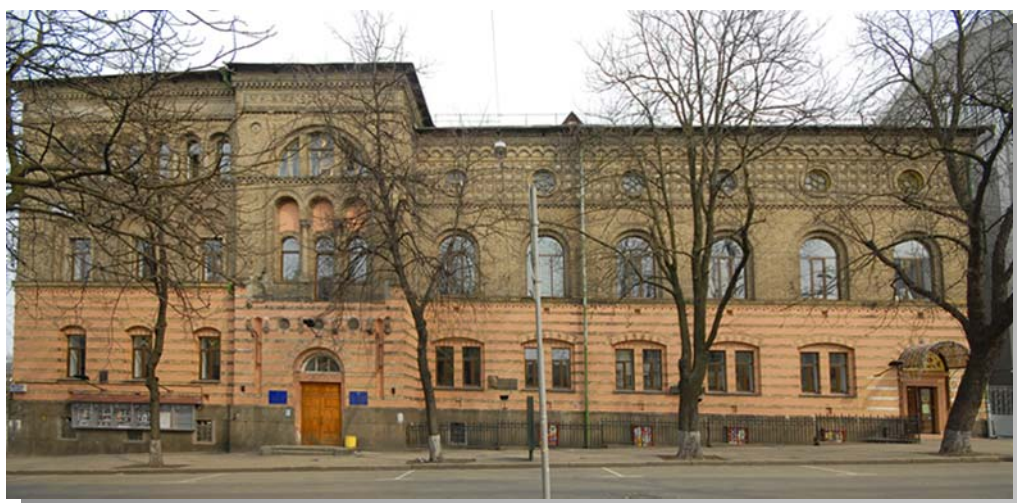
Київський державний інститут театрального мистецтва імені І. Карпенка-Карого