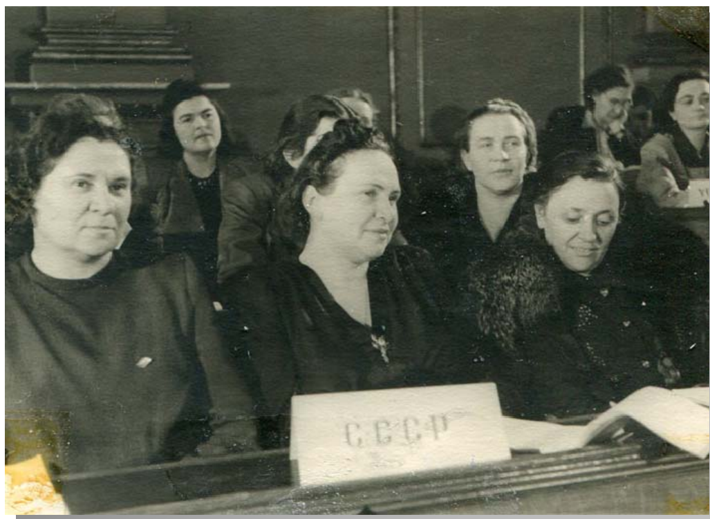
Делегація від СРСР на Конгресі МДФЖ

Антифашистські комітети жінок різних країн були складовою цією міжнародною організацією, яка збирала в свої ряди активні феміністські, пацифістські, антивоєнні жіночі організації світу.