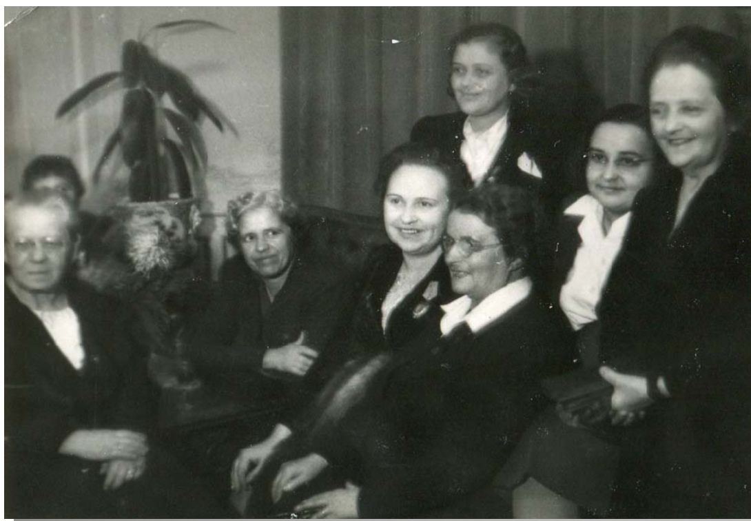
1948 рік, грудень. Прийом членів Президії МДФЖ в чехословацькому посольстві у Будапешті