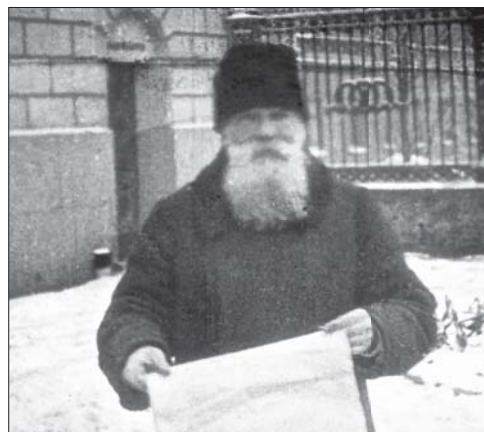
Голова Української Центральної Ради Михайло Грушевський (кінокадр). Київ, 1917 рік

«Члени Виконавчого Комітету на чолі з головою Бурчаком сквапно посходили з балкону назустріч професорові, і за хвилину славнозвісного українського діяча, переслідуваного від царського