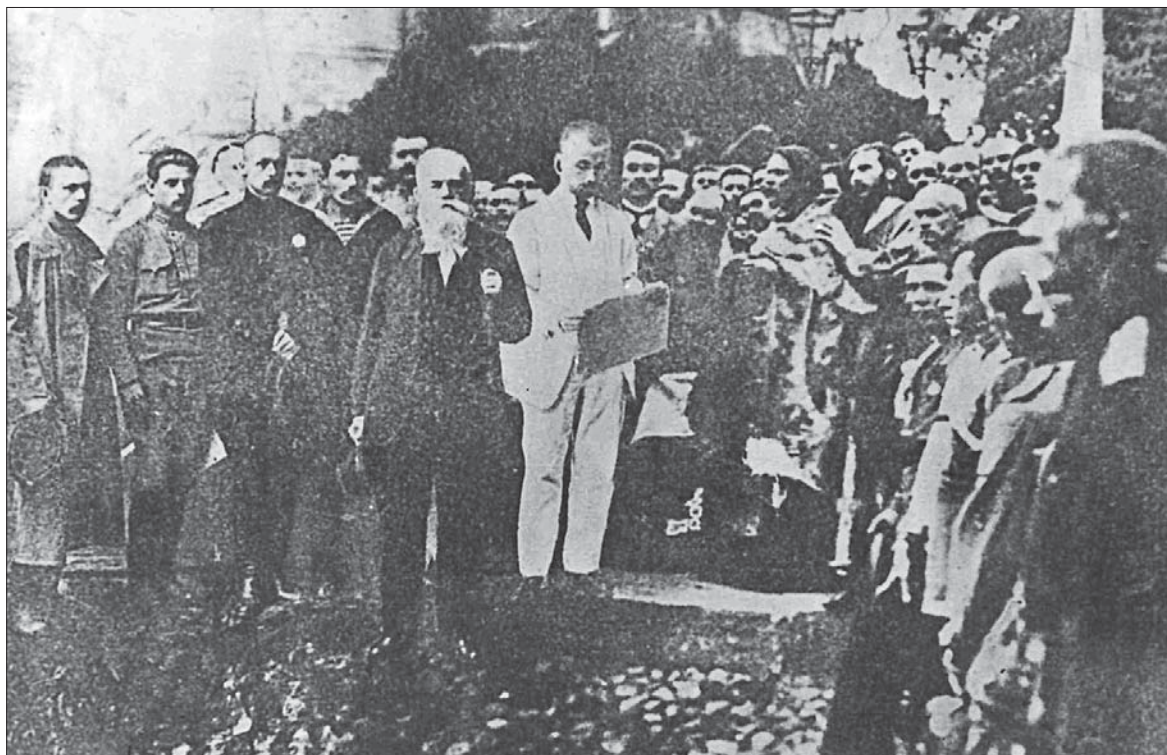
Проголошення I Універсалу Центральної Ради. Київ, 10 червня 1917 року. В центрі — Михайло Грушевський

На цьому ґрунті й з'явився I Універсал. Його появу прискорили 4-ті загальні збори Ради, які відбулися 1–3 червня 1917 року. Збори постановили негайно видати Універсал до українського народу і пояснити суть вимог української демократії. Грушевський безпосередньо брав участь у виробленні I Універсалу, про що писав у своїх «Споминах» 40 .