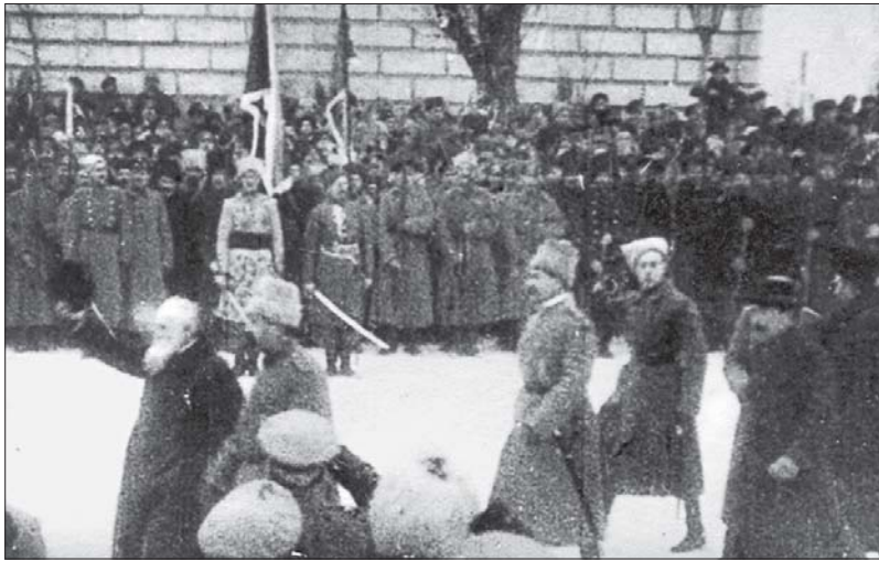
Михайло Грушевський біля будинку Української Центральної Ради (кінокадр). Грудень 1917 року

Він закликав делегатів підтримати УЦР і стати в її обороні. Були проведені кардинальні заходи. Розроблено й опубліковано проект Конституції УНР. Створено Особливий комітет з оборони України, до якого увійшли М. Порш, С. Петлюра і В. Єщенко. 26 грудня 1917 року прийнято постанову про створення армії, а 30 грудня — і флоту УНР. Проте і тут припустилися помилки. Армія і флот УНР формувалися на засадах добровільності й оплати. Утім, і цього виявилось замало. Розпочався більшовицький наступ на Україну під командуванням Р. Сіверса, Ю. Сабліна та О. Єгорова.