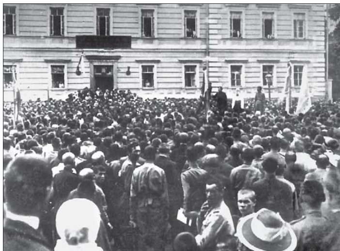
Михайло Грушевський промовляє на мітингу. Липень 1917 року

прийнятого 3 липня на спеціальному засіданні Ради. У ньому наголошувалося, що «доля всіх народів Росії міцно зв'язана з загальними здобутками революції. Ми рішуче ставимось проти замірів самовільного здійснення автономії України до Всеукраїнського Учредительного Зібрання». Водночас повідомлялося, що «прямуючи до автономного ладу на Україні, Центральна Рада в згоді з національними меншостями України підготовлятиме проекти законів про автономний устрій України, для внесення їх на затвердження Учредительного Зібрання» 53 .