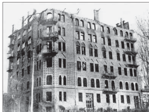
Прибутковий будинок Грушевських на вулиці Паньківській, знищений артилерією Михайла Муравйова.

Облога Києва більшовицькими військами мала особисто для Грушевського трагічні наслідки. Муравйов видав наказ, в якому вказувалося: «Немилосердно винищувати всіх ворогів революції». Це була помста за вбивство гайдамаками відомого більшовика Леоніда Пятакова. До «ворогів революції» потрапив і фамільний будинок Грушевських на Паньківській вулиці. Його розстріляли запальними снарядами. Очевидець трагедії Грушевських К. Бельговський писав, що від будинку «к утру 26 января