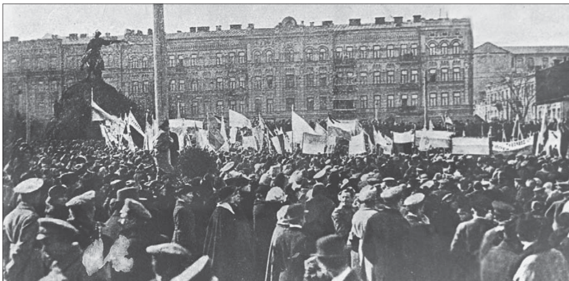
Демонстрація на Софійській площі в Києві.