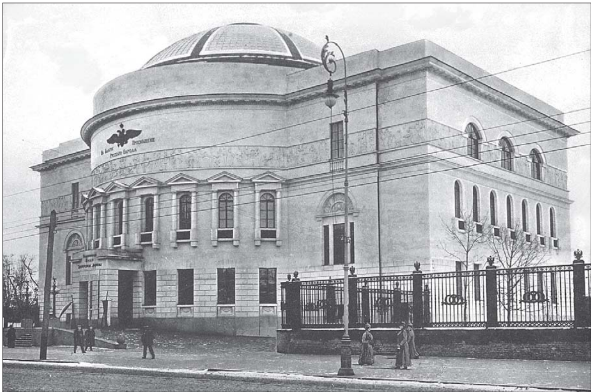
Педагогічний музей. Саме тут розташовувалась Українська Центральна Рада

А втім, факт обрання саме Грушевського в історіографії не викликає одностайності. Більше того, іноді кваліфікується як головна причина поразки першого етапу української революції. Це, звичайно, ледве чи відповідає дійсності. На 1917 рік в Україні не було більш харизматичного і популярного національного політичного і громадського діяча, ніж Грушевський. Про це майже одностайно писали його сучасники (Д. Дорошенко, О. Шульгин). Лідером українства він став ще задовго до 1917 року. Насправді, такі його особисті якості, як твердий характер, політична амбітність, воля в досягненні мети, патріотизм у поєднанні з багатим політичним досвідом та незаперечним авторитетом — усе це працювало на його користь.