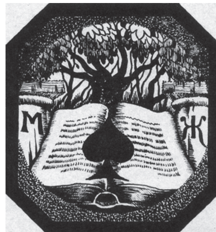
Іл. 104. М. Жук. Екслібрис «МЖ». Друга пол. 1920-х. Пап., літограф.

і в стилістично близьких ілюстраціях «Дитячий сон» (іл. 100) і «Бабусина казка» (іл. 101).