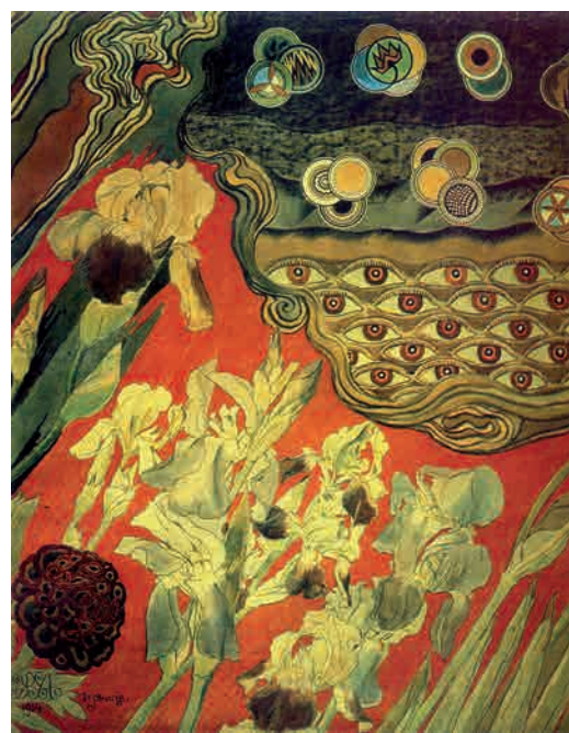
Гл. 175. М. Жук. Панно «Півники». 1914. Пап., паст., акв.