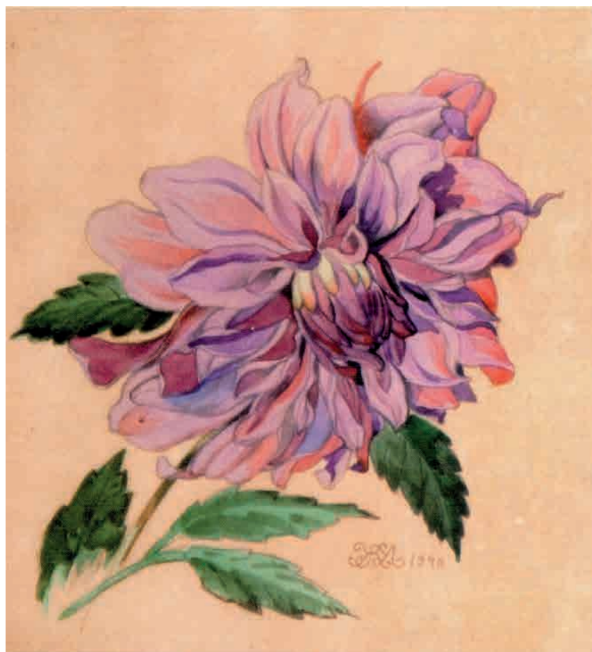
Іл. 349. М. Жук. Жоржина. 1940. Пап., іт. ол., акв.