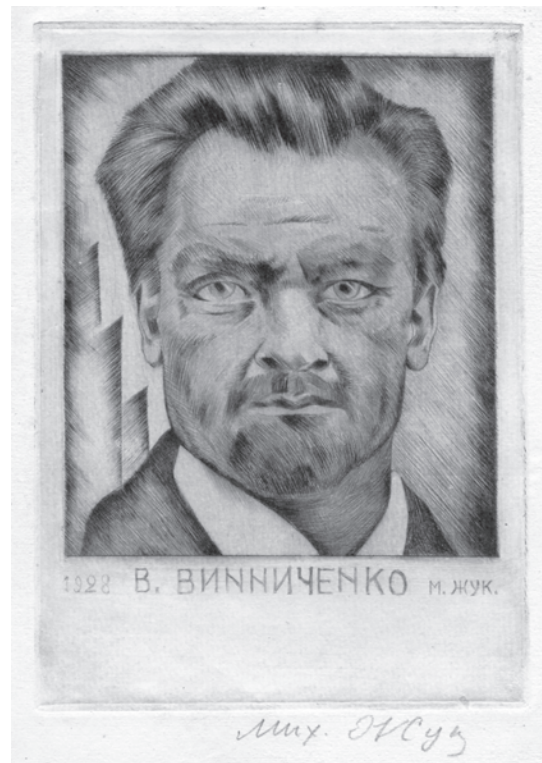
Іл. 62. М. Жук. Портрет Володимира Винниченка. 1928. Пап., офорт, суха голка

Вочевидь, невдовзі після зустрічі з Терещенком в «перлині Причорномор'я», куди доля закинула їх обох, було створено портрет режисера (іл. 273). На глядача привітно дивиться молодий чоловік із пишним хвилястим волоссям на голові, красивими рисами обличчя, магічним поглядом очей, елегантною краваткою. Мистець знову звертається до випробуваних засобів, які дають можливість глибше розкрити образ, — символічного тла і зображення рами, в даному випадку вишуканої, коштовної, що вже є своєрідним коментарем до образу. Характеристику доповнює символіка тла: портали обабіч голови, що можуть сприйматись як натяк на пройдений