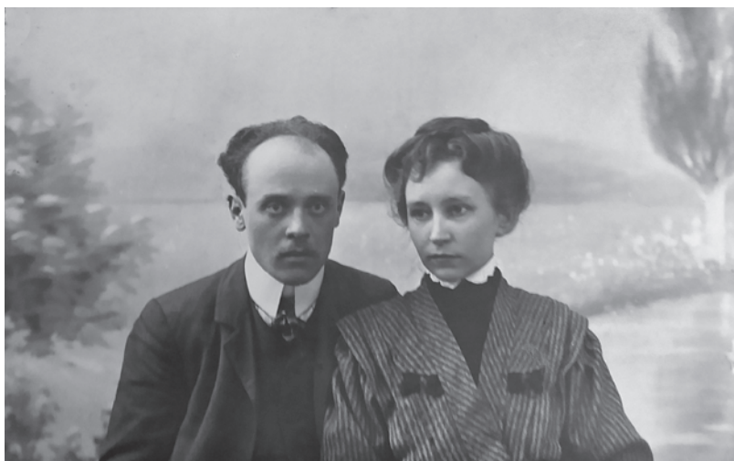
Лл. 17. Жук з дружиною. 8 трав. 1909 р. Фото