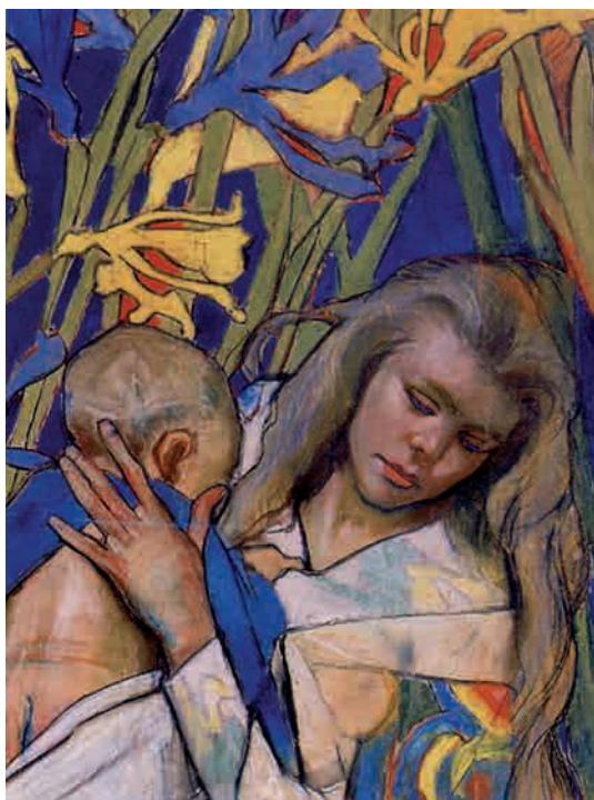
Іл. 176. С. Виспянський. Caritas. Проект поліхромії для Францисканського костела в Кракові (деталь). Біля 1905. Пап., наст.