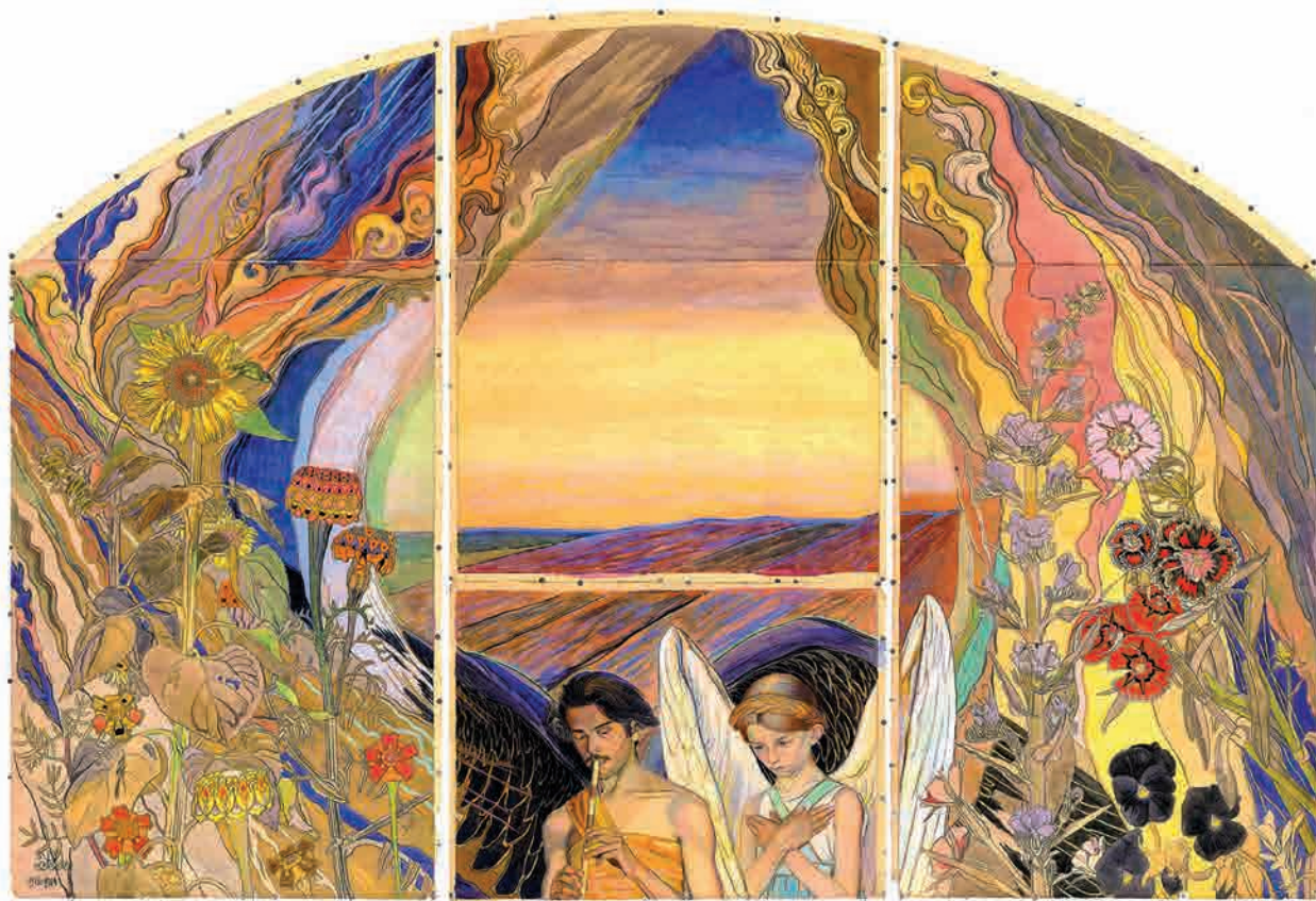
Іл. 177. М. Жук. Біле і чорне. 1912–1914. Пап., гуаш, наст., акв.