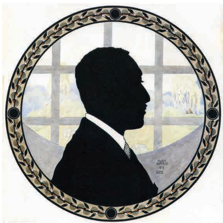
Іл. 210. М. Жук. Силуетний портрет невідомого. 1919. Пап., зм. техн.