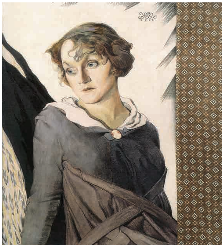
Іл. 212. М. Жук. Жіночий портрет. 1919. Пап., акв., іт. ол., туш, аплікація тканини