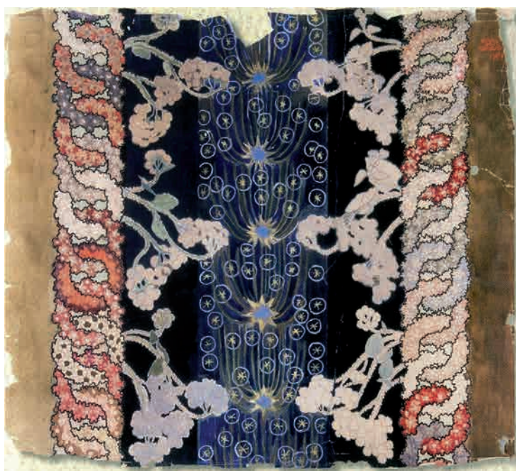
Гл. 174. М. Жук. Панно. 1907. Пап., туш, гуаш, акв., іт. олівець, паст.