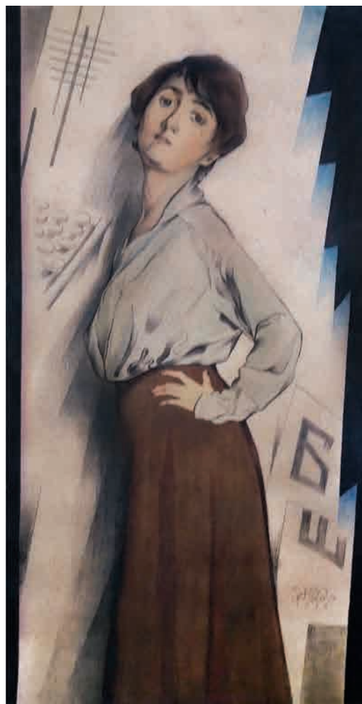
Іл. 211. М. Жук. Портрет друкарки. 1918. Пап., вуг., акв., туш, паст.