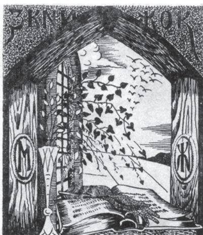
Іл. 103. М. Жук. Екслібрис «З книжок МЖ». Друга пол. 1920-х. Пап., літограф.