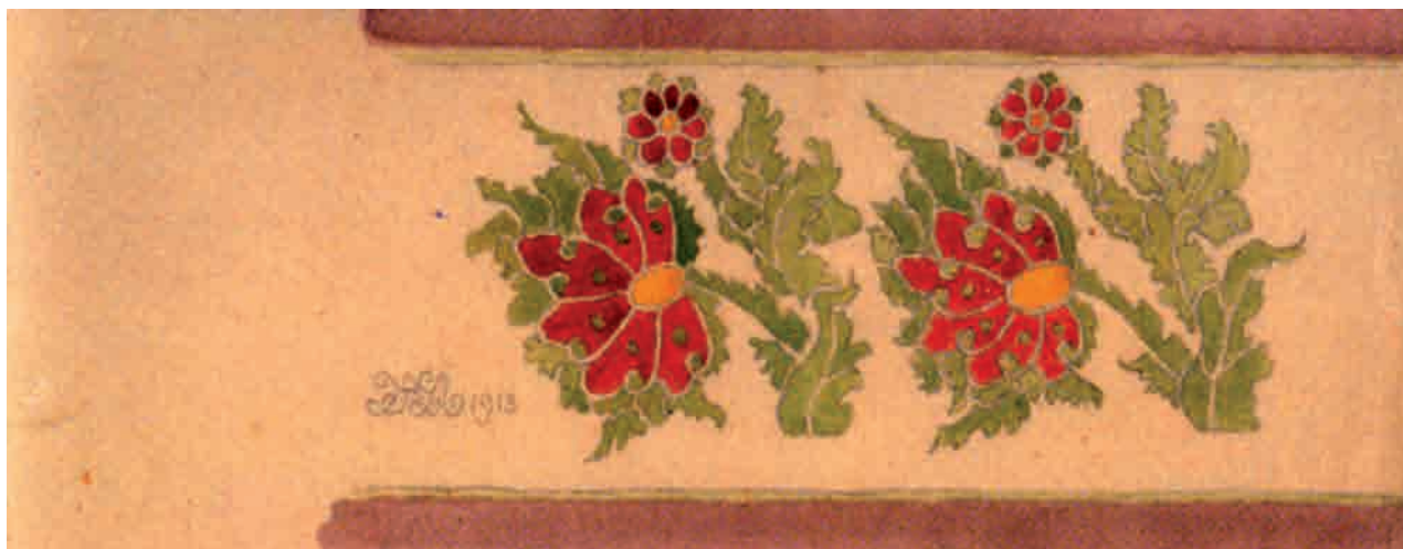
Гл. 173. М. Жук. Ескіз панно. 1913. Пап., ол., акв.