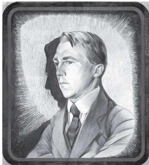
Іл. 48. М. Жук. Портрет Володимира Ярошенка. 1919. Пап., іт. ол.

вродливий і артистично витончений слуга Мельпомени, революціонер у театральній сфері, який за короткий час, очоливши «Молодий театр», вивів українське театральне мистецтво на рівень кращих європейських досягнень. Висока освіченість (знання, окрім грецької і латинської, слов'янських, німецької, французької, англійської, норвезької мов), ерудиція, чітка зорієнтованість у світових художніх процесах, завдяки чому режисер-реформатор зміг наповнити репертуар свого театру власноруч перекладеними творами світової класики і новітньої драматургії, явно імпонували Жукові. Він зобразив молодого режисера в момент, коли той дещо нахилився і про щось глибоко замислився. Ця схильність Курбаса до філософських роздумів, аналітики і стала тією головною рисою, яку виділив в його характері Жук і втілив в портретному образі. Символічним коментарем, як і раніше у Жука, виступає тло: зліва над Курбасом нависли чіткі дугасті лінії, що нагадують падури стелі, праворуч позначені паралелі дощатої підлоги сцени з театральною маскою і розкиданими трояндами. Але головне завдання для мистця досягти особливої виразності характеру, і він