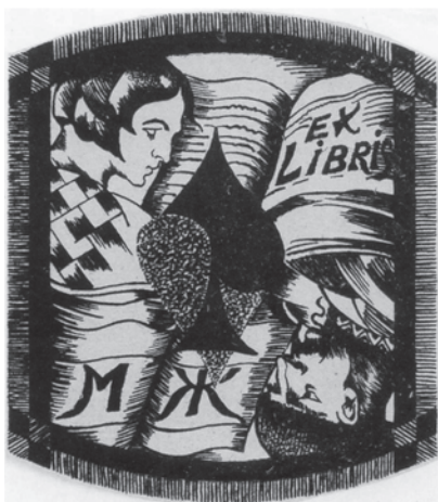
Іл. 102. М. Жук. Ex Libris МЖ. Друга пол. 1920-х. Пап., літограф.