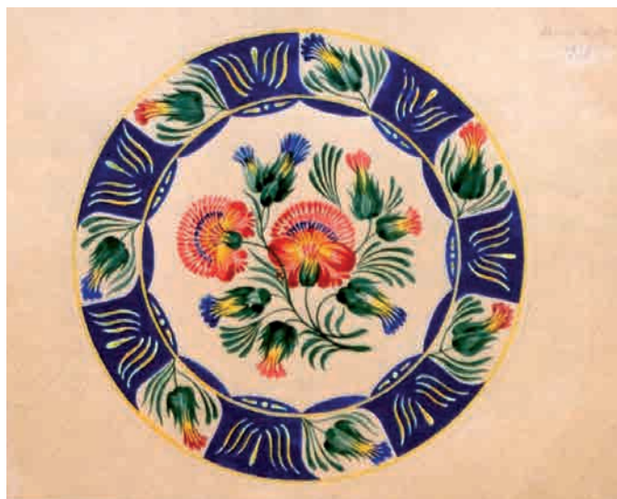
Іл. 348. М. Жук. Підглазурний трафарет. 1938. Пап., гуаш, акв.