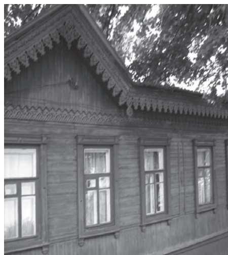
Лл. 18. Старий будинок по вул. М. Коцюбинського в Чернігові