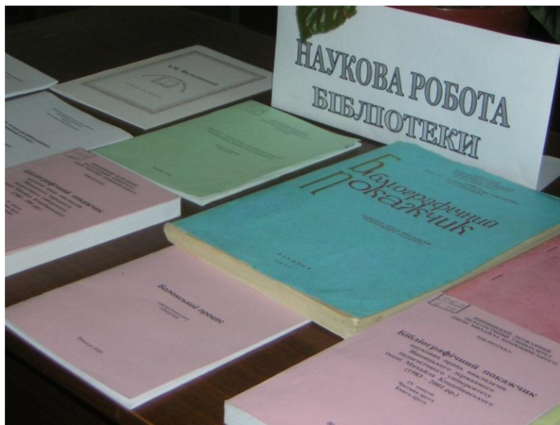
Видання бібліографічних покажчиків «Праці викладачів»

За діяльності Янківської Г.П. було розпочато видання бібліографічного покажчика наукових праць викладачів педагогічного інституту. Це видання було першим значним кроком до зібрання та систематичного упорядкування праць наукових працівників інституту. Перше видання «Бібліографічний покажчик наукових праць викладачів педагогічного інституту» (ротапринтне), де було зібрано публікації наукових працівників педінституту станом на 1967 р., вийшло у 1970 р.