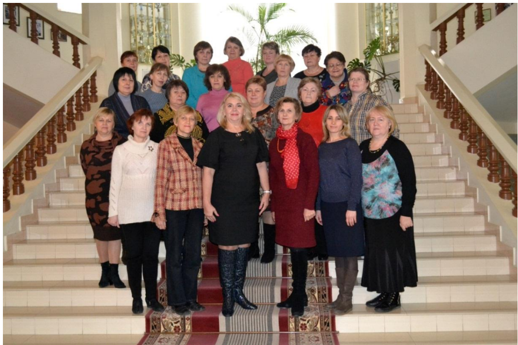
Колектив бібліотеки з ректором університету Н.І. Лазаренко (2017 р.)

Так, я книгар. Не лікар, не аптекар, Не інженер, не вчитель, не банкір... Я більше: Я Книгар! Бібліотекар! На заздрість всім, всьому наперекір! Бо посудіть: Хіба ще є багатство, Таке неоціненне, як моє? Ніяке товариство, жодне братство Такого скарбу банку не збере!