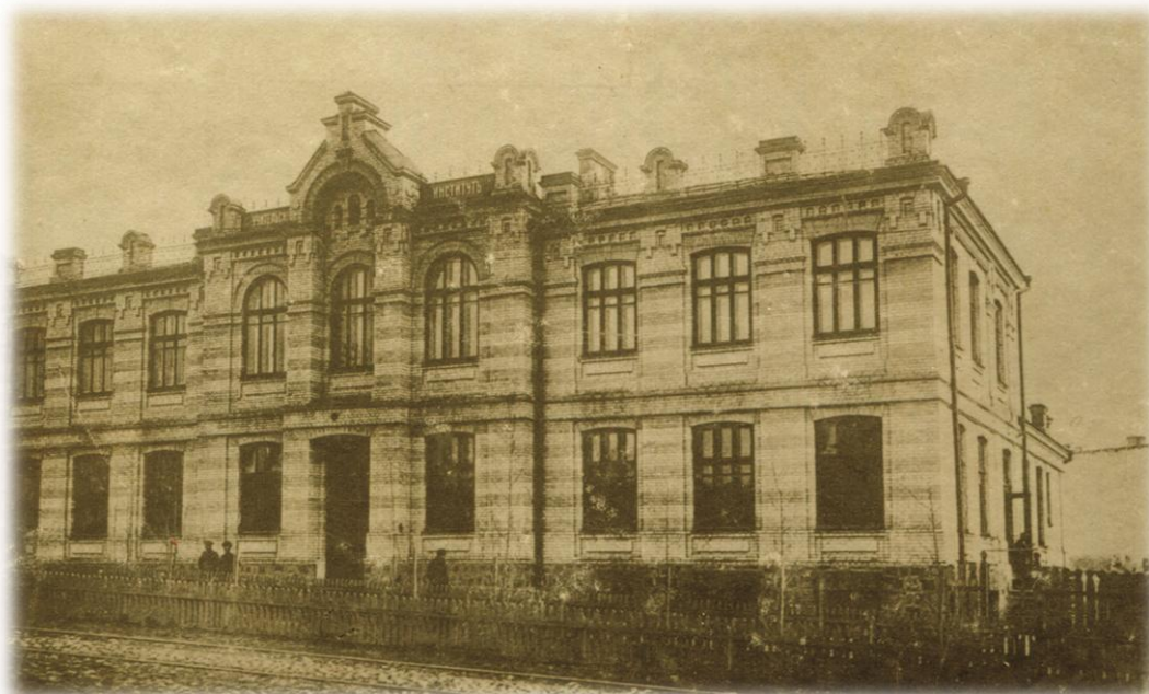
Перша будівля учительського інституту

Будівля інституту була розташована у гамірному місці – вулиця вела з міста на вокзал. Опалення було місцевим (голландські печі). Денне освітлення відповідало тодішнім нормам, а вечірнє було досить слабким, на перших порах забезпечувалося гасовими лампами (електричне освітлення з'явилося у 1913 р.) [9, с.14].