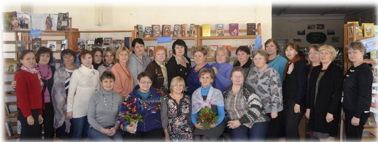
Колектив бібліотеки 2017 р.

Час випробує нас на професійну принадність. Бібліотечному ремеслу навчалася протягом життя не одне покоління працівників бібліотеки та на практиці переконалися, що коли повністю опануєш бібліотечну справу, вона з ремесла стає мистецтвом. А чи є критерії, за якими оцінюється робота бібліотекаря? Професіоналізм? Ерудованість? Інтелігентність? Уміння працювати з інформацією? Чи все це разом, помножене на душевну щедрість, толерантність, дієве прагнення бути відданому раз і назавжди обраній справі. Якби це не було, але все це притаманне у повній мірі колективу бібліотеки Вінницького педуніверситету.