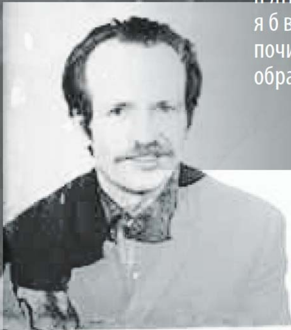
ЧОРНОВОЛ ВЯЧЕСЛАВ МАКСИМОВИЧ. 1938 года