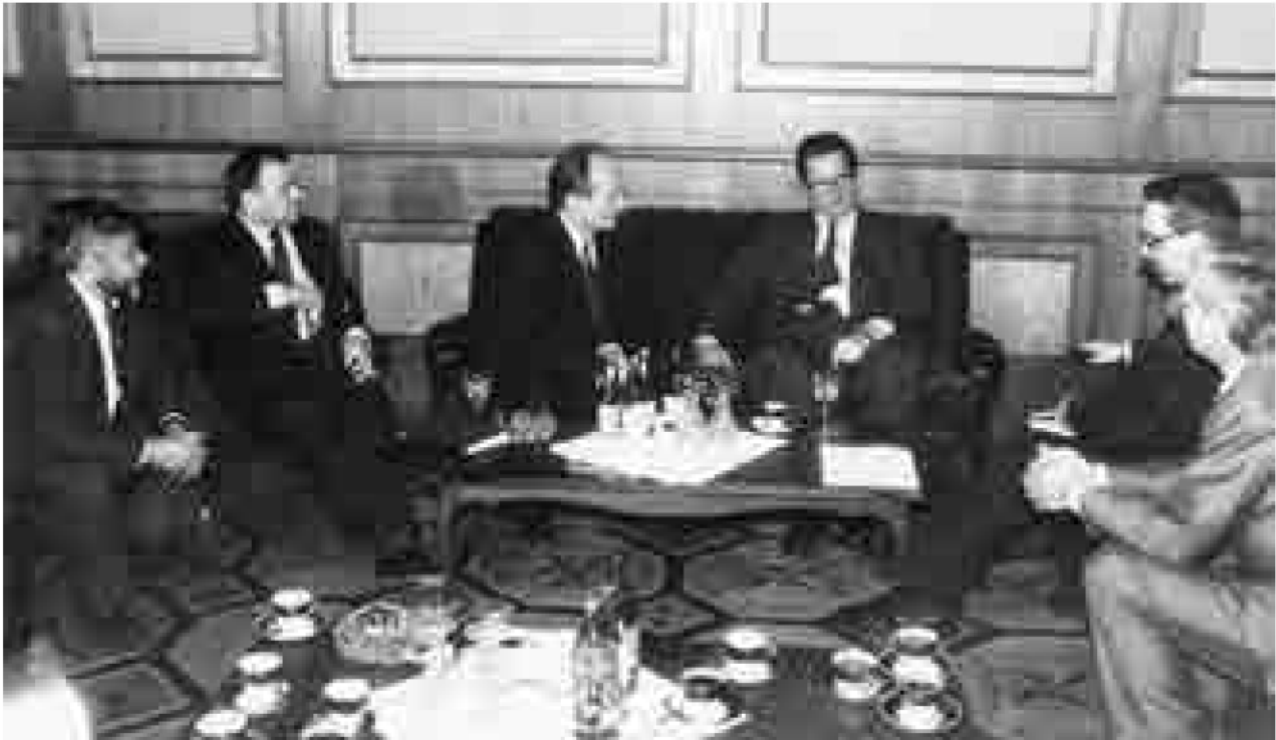
Голова Народного Руху Вячеслав Чорновіл і Віце-канцлер — міністр закордонних справ Німеччини Клаус Кінкель у резиденції високого гостя в Києві 16 лютого 1993 року.

Перший ліворуч — голова Народної Ради (опозиції у Верховній Раді України) Лесь Танюк, перший праворуч — голова Секретаріату Народного Руху Михайло Бойчишин.