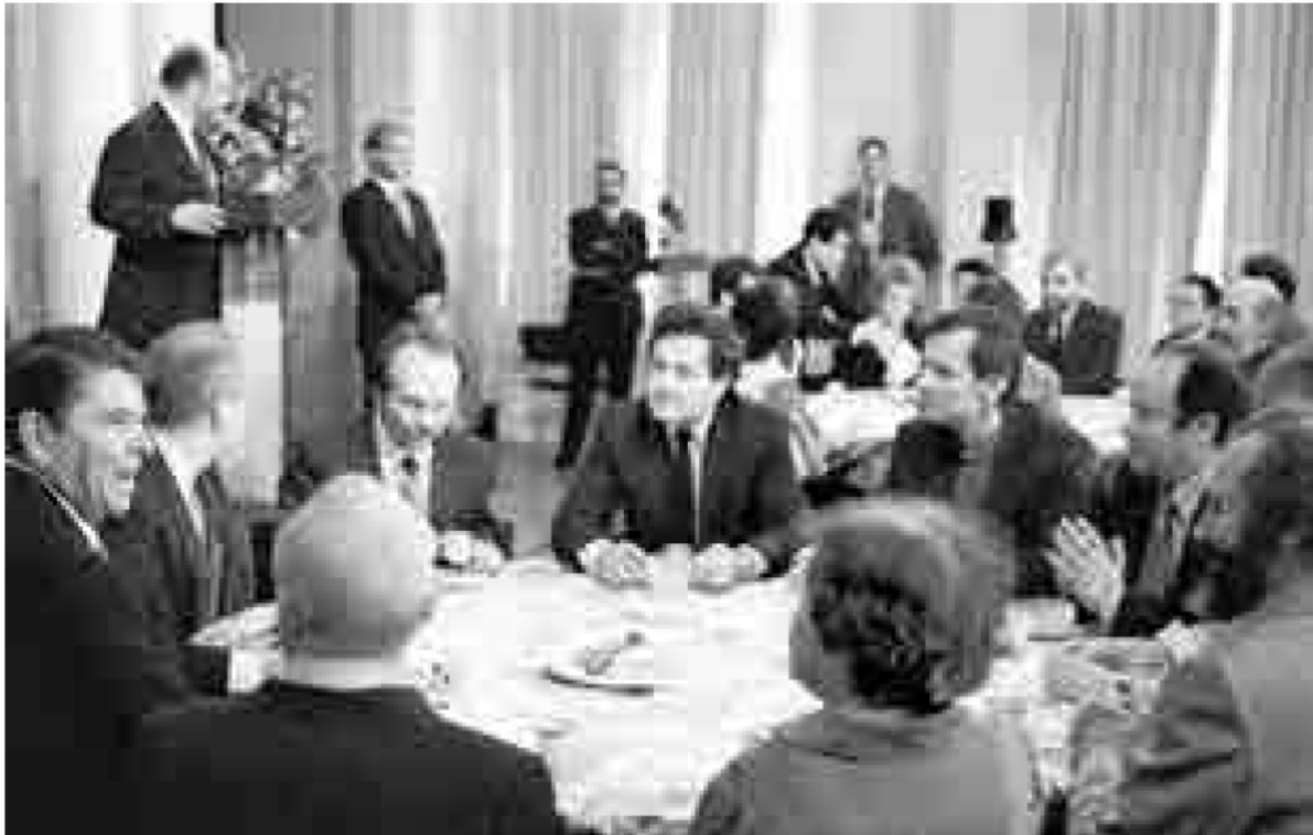
Вячеслав Чорновіл у колі радянських дисидентів за одним столом із Президентом США Рональдом Рейганом і Держсекретарем Джорджем Шульцем. Зустріч відбулась у резиденції американського посла в СРСР Джека Метлока «Спасо-Гаус» у Москві 29 травня 1988 року.