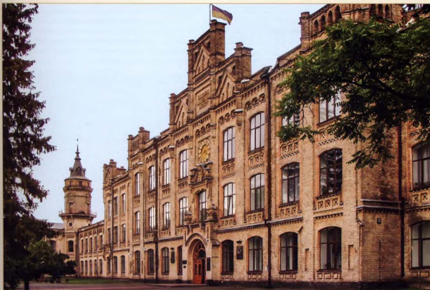
Центральний корпус Київського політехнічного інституту, де було розміщено сільськогосподарське відділення

Саме сільськогосподарське відділення КПІ є основою формування сільськогосподарського вищого навчального