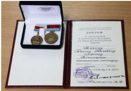
Світлина 11. Диплом і нагрудний знак лауреата 1-ї премії Мінвузу УРСР