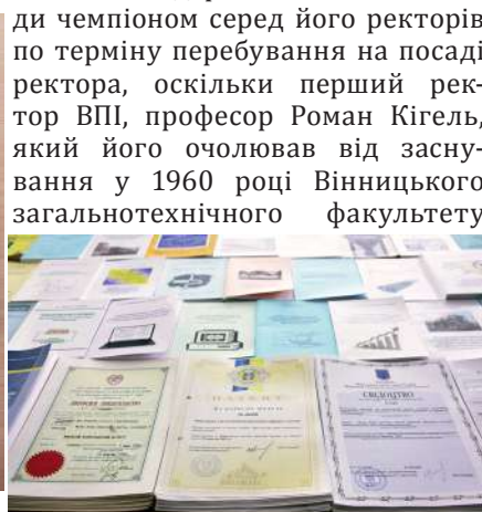
Світлина 24. Монографії, посібники, патенти та авторські свідоцтва професора Бориса Мокіна