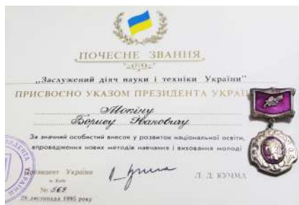
Світлина 13. Посвідчення і нагрудний знак заслуженого діяча науки і техніки України

А протягом 1991-1992 років, як професор і ректор-реформатор, а також доктор технічних наук, який виконав багато досліджень в галузі електроенергетичної інженерії та в напрямку моделювання і автоматизації технологічних процесів гірничого-металургійного комплексу, що приведені у переліку опублікованих наукових робіт, професор Борис Мокін став одним із академіків-засновників одразу трьох наукових академій – однієї зі статусом державної, якою є Національна академія педагогічних наук України, та двох зі статусом громадських організацій, якими є Академія інженерних наук України з розміщенням президії у Києві та Академія гірничих наук України з розміщенням президії у Кривому Розі, в роботі яких бере активну участь і по-сьогодні. За усі ці, вище описані досягнення професору Борису Мокіну у 1995 році указом президента України присвоєно звання «Заслужений діяч науки і техніки України».