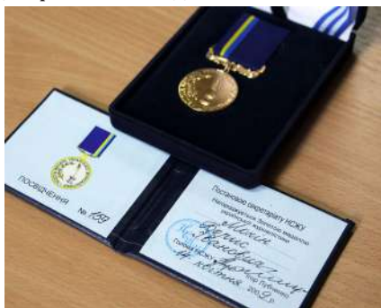
Світлина 10. Золота медаль Української журналістики Бориса Мокіна