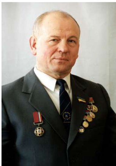
Світлина 14. 2003 р. Ректор ВНТУ, професор Борис Мокін, нагороджений орденом «За заслуги» III-го ступеня

представник науковців України, виступає з науковими доповідями на Міжнародних Конгресах ІМЕКО в італійському Туріні, фінському Тампере та австрійському Відні. Але і громадську та журналістську діяльність Борис Мокін у цей період не полишає – він продовжує писати та публікувати книги зі своєї історико-публіцистичної серії і здійснює керівництво Вінницьким відділенням Всеукраїнського об'єднання «Злагода». За сукупністю досягнутих результатів, ректор ВДТУ, академік НАПНУ, АІНУ, АГНУ, професор Борис Мокін, який у цей період ще й був обраний від України академіком Міжнародної академії наук вищої школи з центром у Москві, яка об'єднала професорів 40 країн, у 2000 році указом президента України нагороджений орденом «За заслуги» III ступеня.