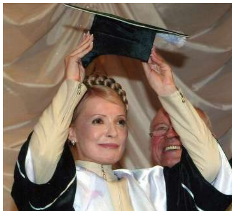
Світлина 16. 2007 р. Вручення Юлії Тимошенко атестату і мантиї Почесного професора ВНТУ

викладачів потім надати можливість тим двом з половиною тисячам із них після повернення їх з Київського Майдану в аудиторії відпрацювати пропущені заняття у другій половині дня. Але з часом він розчарувався в спроможності Віктора Ющенка керувати країною і на дострокових, і парламентських виборах 2007 року уже підтримував опозиційного лідера партії «Батьківщина» Юлію Тимошенко, яка відвідала університет напередодні виборів і яка була приємно вражена як запровадженням у ньому підготовки фахівців на основі поєднання канадських та європейських стандартів вищої освіти, так і тим, що Вчена рада ВНТУ після її виступу на засіданні ради одноголосно проголосувала за присвоєння їй – кандидату економічних наук звання «Почесний професор ВНТУ». Юлія Тимошенко ще тоді пообіцяла, що в разі перемоги на парламентських виборах її партії, що дасть змогу їй очолити уряд нашої країни, вона обов'язково візьме до себе в радники з питань вищої освіти на громадських засадах такого прогресивного