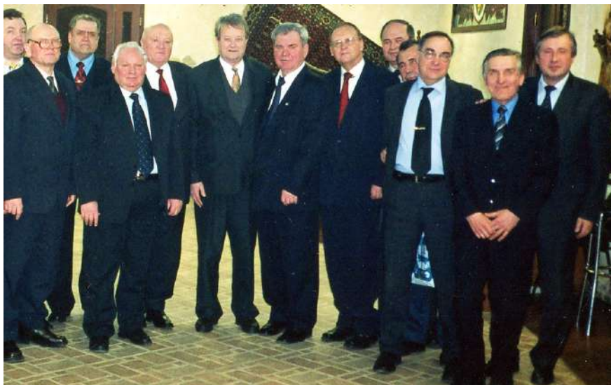
Світлина 15. 2004 р. Ректор ВНТУ, професор Борис Мокін в Одесі серед учасників Підсумкової колегії МОН України

представник науковців України, виступає з науковими доповідями на Міжнародних Конгресах ІМЕКО в італійському Туріні, фінському Тампере та австрійському Відні. Але і громадську та журналістську діяльність Борис Мокін у цей період не полишає – він продовжує писати та публікувати книги зі своєї історико-публіцистичної серії і здійснює керівництво Вінницьким відділенням Всеукраїнського об'єднання «Злагода». За сукупністю досягнутих результатів, ректор ВДТУ, академік НАПНУ, АІНУ, АГНУ, професор Борис Мокін, який у цей період ще й був обраний від України академіком Міжнародної академії наук вищої школи з центром у Москві, яка об'єднала професорів 40 країн, у 2000 році указом президента України нагороджений орденом «За заслуги» III ступеня.