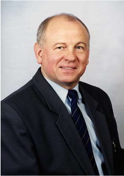
Світлина 1. Професор кафедр ВЕТЕСК і САКМІГ Борис Мокін

Д октор технічних наук, професор, заслужений діяч науки і техніки України, академік Національної академії педагогічних наук України Мокін Борис Іванович народився 3-го січня 1943 року в селі Старі Баба-ни Уманського району Черкаської області і був зареєстрований як Чернюк Борис Олександрович згідно з конспіративним прізвищем його батька Коновалова Олександра Федоровича, який під прізвищем Чернюк під час окупації Умані німецькими військами працював у службі охорони Уманської залізничної станції, добуваючи і пересилаючи в Центр інформацію про ешелони з живою силою і технікою ворога. Після визволення Умані від німецьких окупантів Олександр Коновалов продовжував перебувати в лавах тих, хто не мав