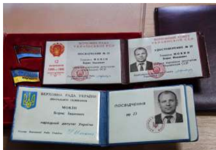
Світлина 7. 1990-1994 рр. Посвідчення і нагрудні знаки народного депутата УРСР та України