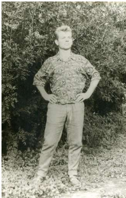
Світлина 2. 1961 р. Перша весна у Кривому Розі

він був відомий у Жашкові ще й як центрфорвард футбольної збірної команди Жашківського району, що брала участь у першості Черкаської області, а також як центрфорвард футбольної команди тресту «Криворіжаглобуд», що брала участь у першості Кривого Рогу та футбольної команди комбінату «Криворіжбуд», що брала участь у першості України серед колективів спортивного товариства «Трудові резерви».