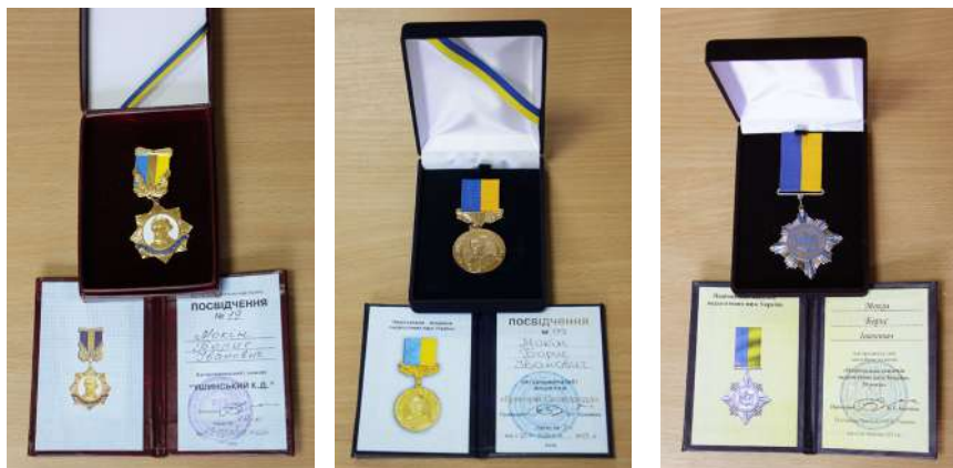
Світлина 20. 2012 р. Академічні медалі «Ушинський К. Д.», «Григорій Сковорода» та пам'ятна медаль до 20-річчя НАПН України