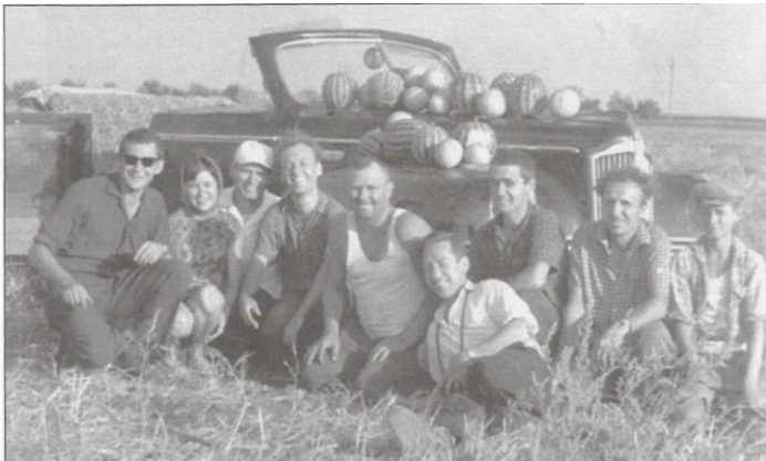
Знімальна група кіностудії ім. О. Довженка під час роботи над художнім фільмом за романом О. Сизоненка «Білі хмари»