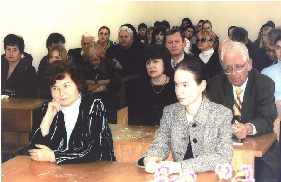
Зібрання науковців і письменників, присвячене пам'яті професора, лауреата Шевченківської премії Василя Фашченка.