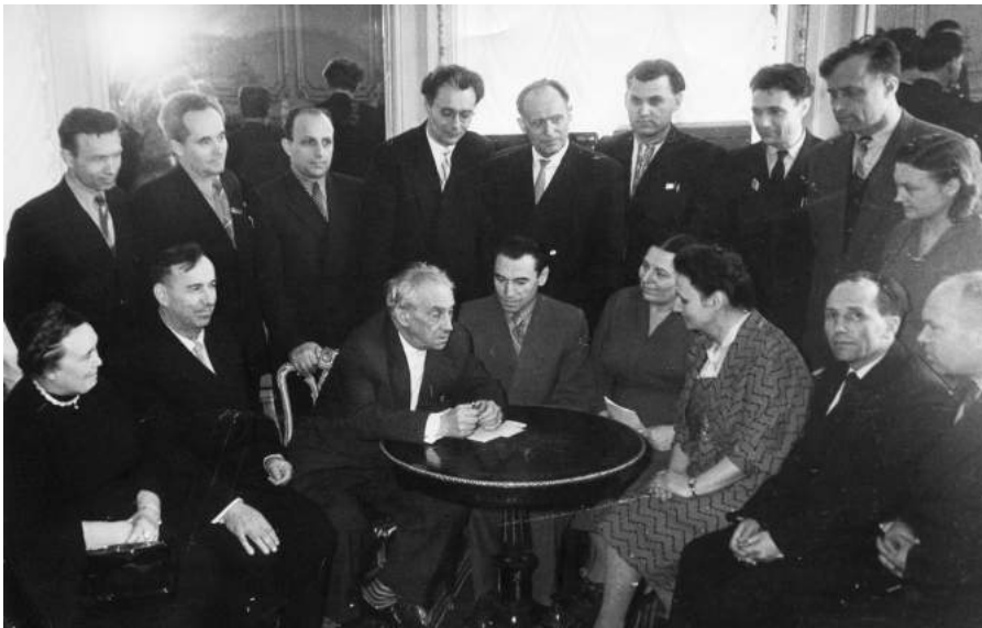
Зустріч студентів і викладачів з Максимом Рильським на одеських теренах.