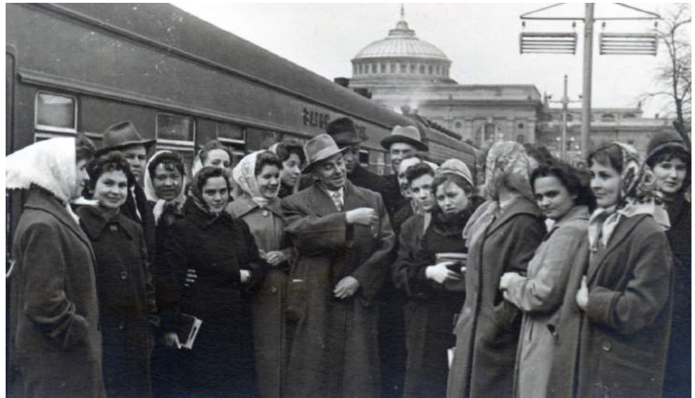
Зустрічаємо Павла Тичину на Одеському залізничному вокзалі.