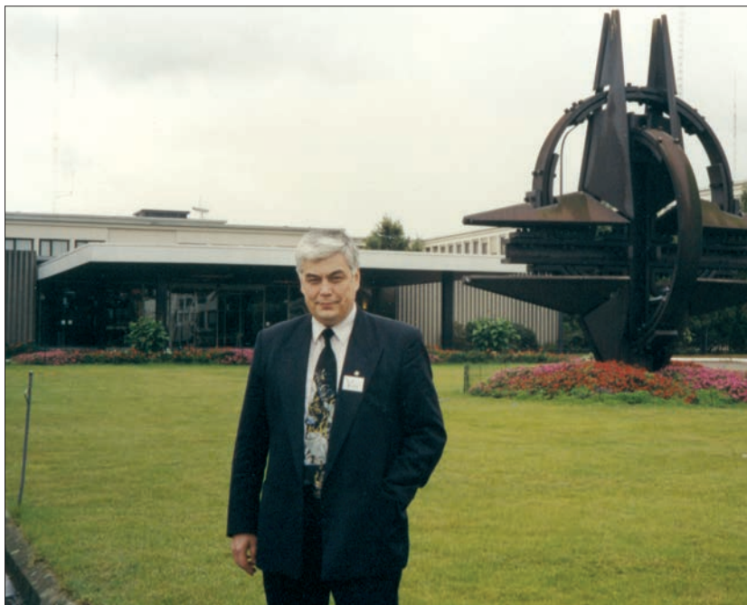
У штаб-квартирі НАТО у Брюсселі (2004)