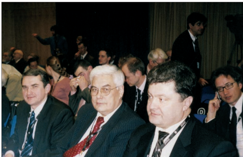
Під час міжнародної конференції, присвяченої річниці терактів у Мадриді, разом із Секретарем РНБО України Петром Порошенком та заступником Міністра закордонних справ України Олегом Шамшуром (Мадрид, 2005 р.)