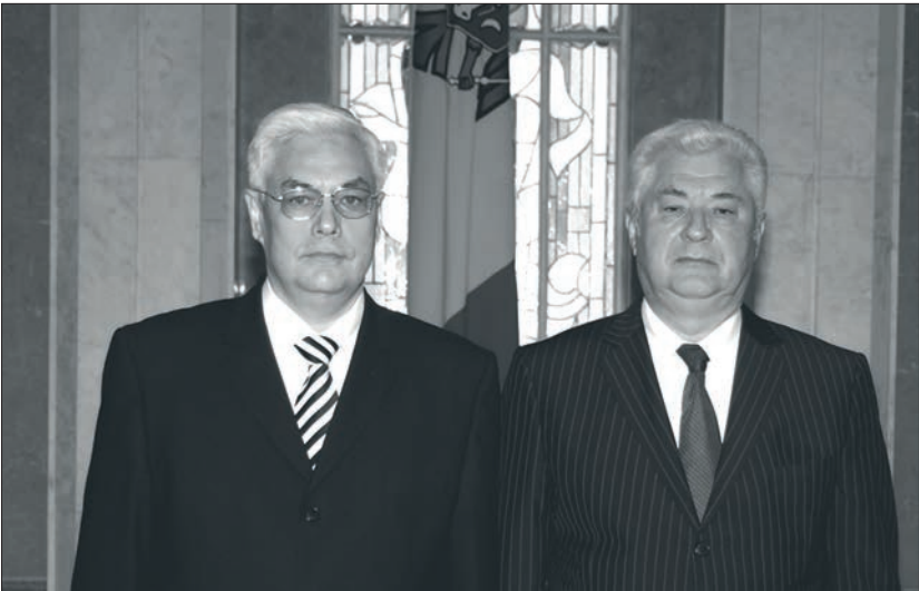
Надзвичайний і Повноважний Посол України в Республіці Молдова Сергій Пирожков і Президент Республіки Молдова Володимир Воронін під час вручення вірчих грамот (травень 2007 р.)