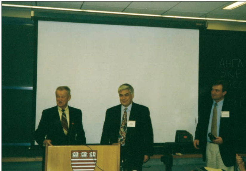
Наукова дискусія з патріархом американської політики Збігневом Бжежинським у Гарварді (Бостон, США, 1999 р.)