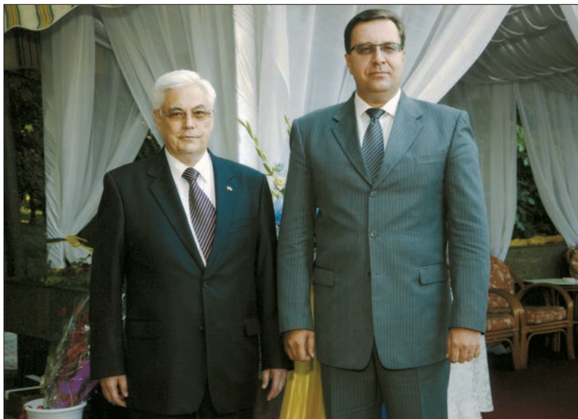
Зі спікером Парламенту Республіки Молдова Маріаном Лупу (серпень, 2011 р.)