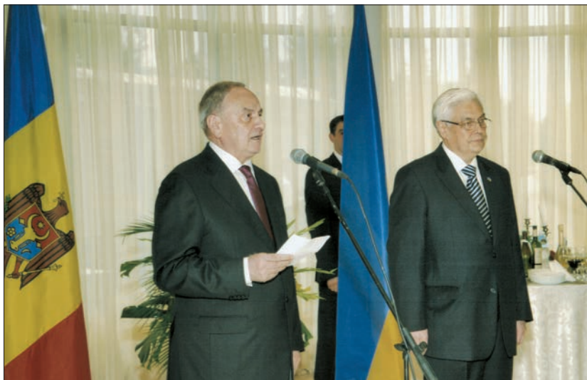
Вітання Президента Республіки Молдова Николае Тімофті з нагоди Дня незалежності України (24 серпня 2012 р.)