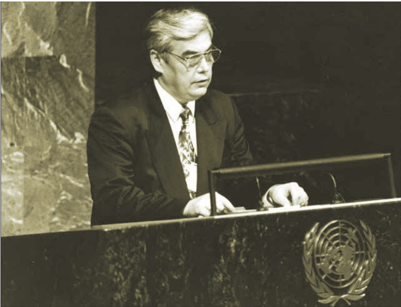
Виступ на пленарному засіданні ювілейної сесії Генеральної Асамблеї ООН (1995)