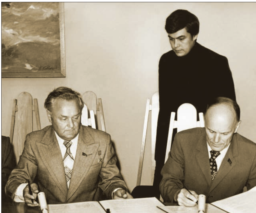
Перший досвід науково-організаційної роботи: підписання угоди про співробітництво між АН УРСР та Запорізькою областю (вересень 1976 р.)