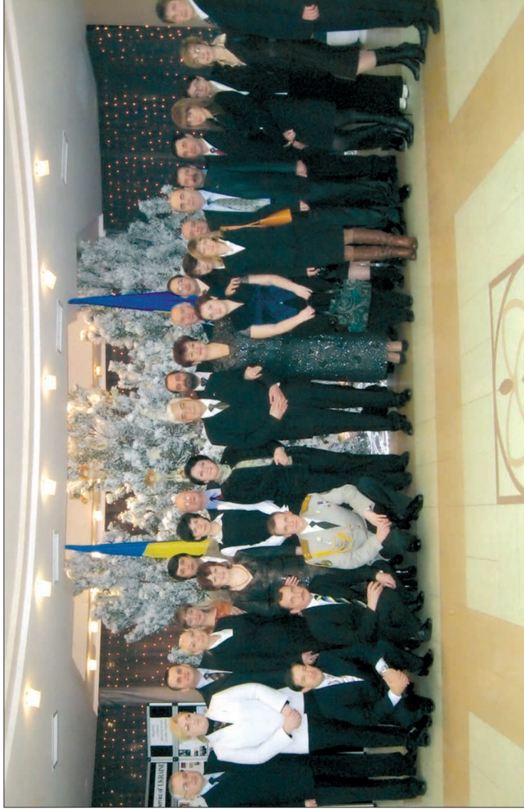
Співробітники Посольства України в Республіці Молдова під час відзначення Дня української дипломатії (Кишинев, 25 грудня 2011 р.)