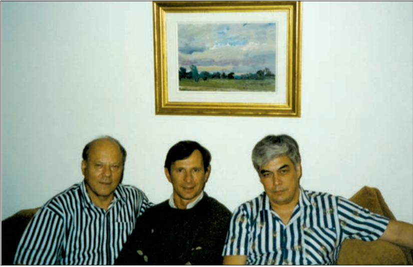
В гостях у канадського історика Ореста Субтельного разом з академіком НАН України Юрієм Пахомовим (Монреаль, Канада, 1995 р.)