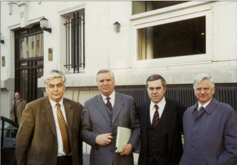
З Міністром закордонних справ України Анатолієм Зленком, Першим заступником міністра Євгеном Бершедою та Надзвичайним і Повноважним Послом України у Франції Юрієм Кочубеєм під час відрядження до Парижу (1999)