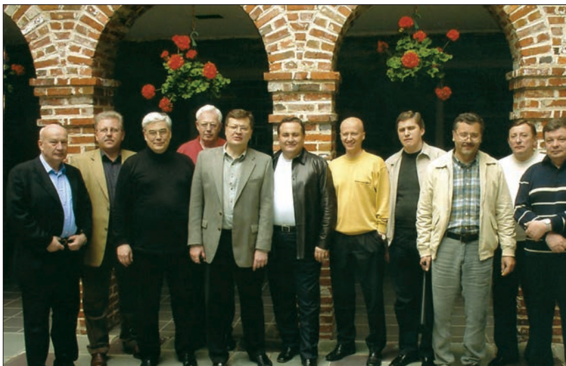
Члени делегації України під час засідання комісії «Україна — НАТО». У Посольстві України в США (Вашингтон, 2003 р.)