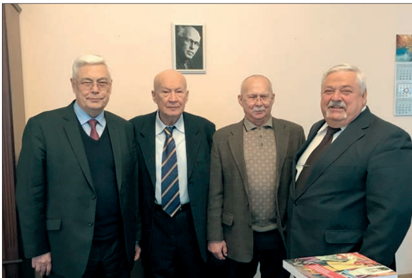
Директори Національного інституту стратегічних досліджень: академіки НАН України С.І. Пирожков, В.П. Горбулін, генерал-лейтенант О.Ф. Белов, член-кор. НАН України О.С. Власюк (березень 2018 р.)