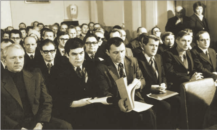
Серед колег і друзів під час засідання Президії АН УРСР (1979)