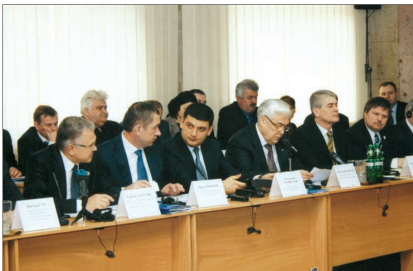
Урочисте засідання у Вінниці, присвячене річниці утворення Єврорегіону «Дністер» (лютий 2013 р.)