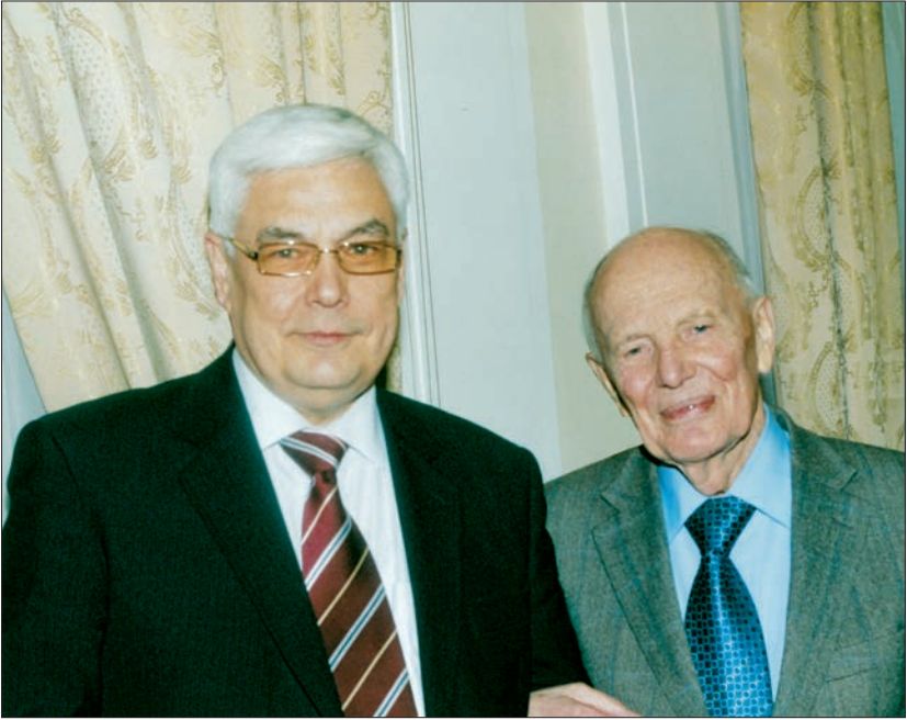
Щаслива доля бути багато років поруч із Борисом Євгеновичем Патоном