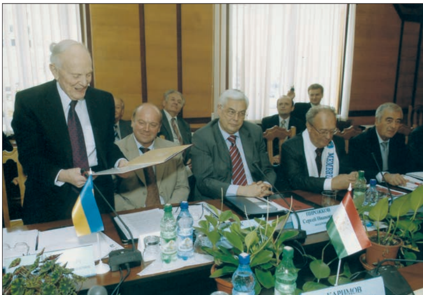
Приєм делегації НАН України на чолі з її Президентом Борисом Патonom у Республіці Молдова (травень 2012 р.)