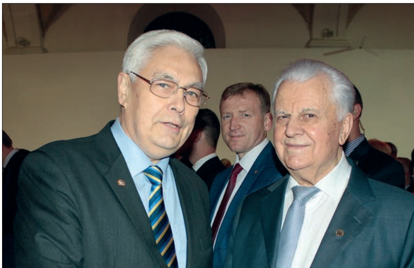
З першим Президентом незалежної України Леонідом Макаровичем Кравчуком (Київ, 2017)