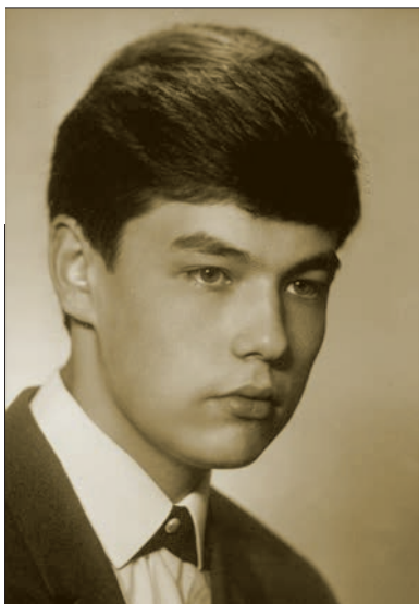
Студент 3-го курсу Київського інституту народного господарства (1968)