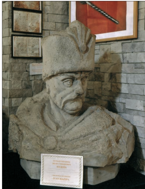
Пам'ятник Гетьману України Івану Мазепі, встановлений на території Бендерської Фортеці (Бендери, Придністров'я, Республіка Молдова) за ініціативи і сприяння Посла України Сергія Пирожкова (2011)