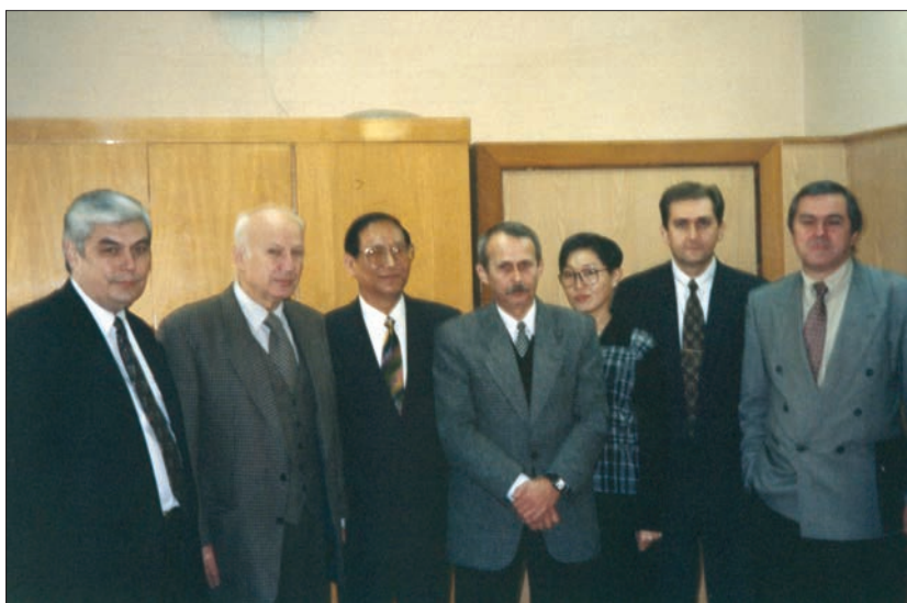
Приєм делегації Пекінського інституту міжнародних порівняльних досліджень в Національному інституті українсько-російських відносин при РНБО України (1998)