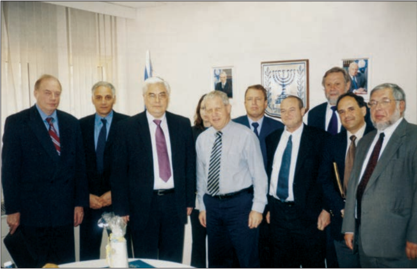
Зустріч у Раді Безпеки Ізраїлю (Тель-Авів, 2005 р.)