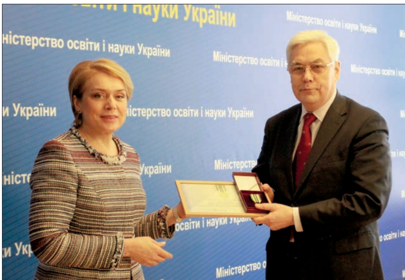
Міністр освіти і науки України Лілія Гриневич вручає відзнаку Президента України — ювілейну медаль «25 років Незалежності України» (2016)