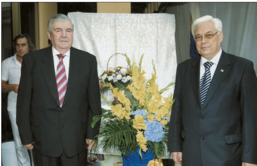
З першим Президентом незалежної Республіки Молдова Мірчею Снегуром (Кишинев, серпень 2012 р.)