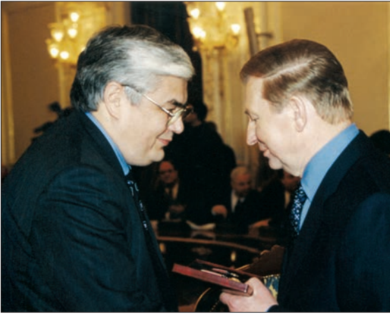
Перший орден «За заслуги» III ступеня вручає Президент України Леонід Данилович Кучма (1998)