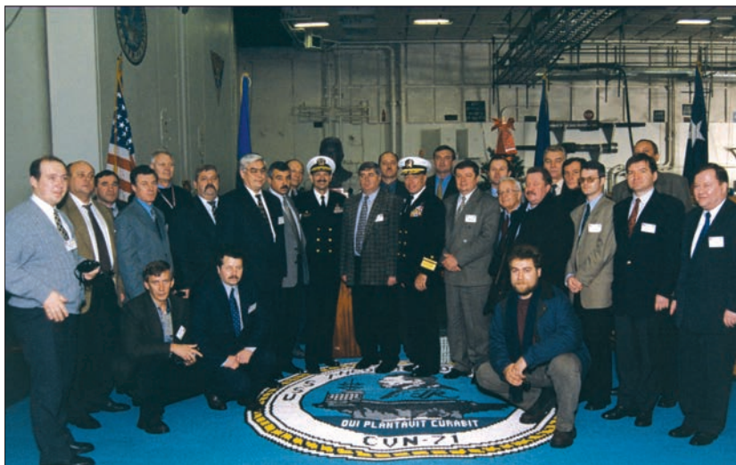
Слухачі програми «Національна безпека України» під час знайомства з авіаносцем США «Теодор Рузвельт» (Норфолк, США, 1999 р.)