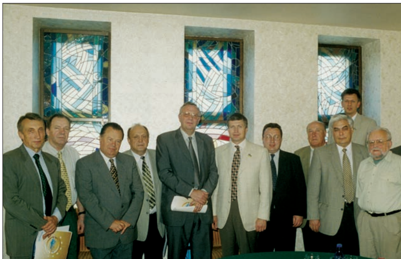
Серед засновників Інтелектуального Фонду «Україна — XXI століття» (1996)