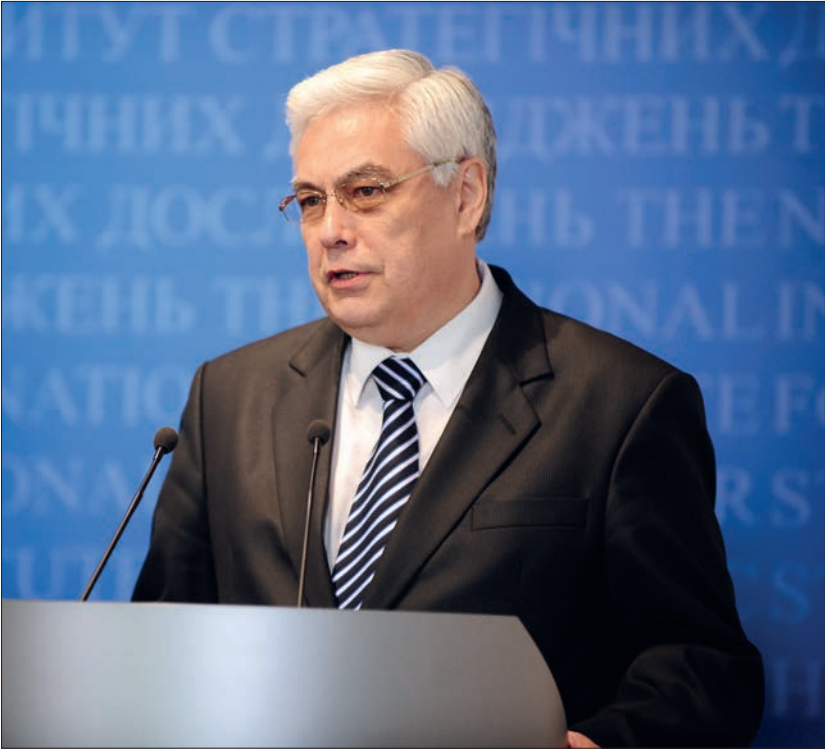
Виступ на ювілейному засіданні з нагоди 20-річчя Національного інституту стратегічних досліджень (березень, 2012 р.)