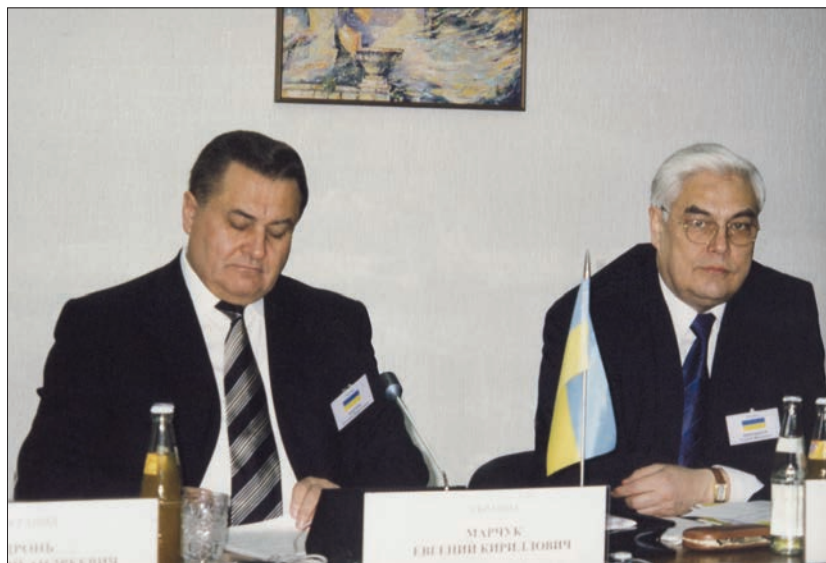
Разом із Секретарем РНБО України Євгеном Марчуком під час наради Секретарів Рад безпеки країн СНД (Мінськ, 2003 р.)