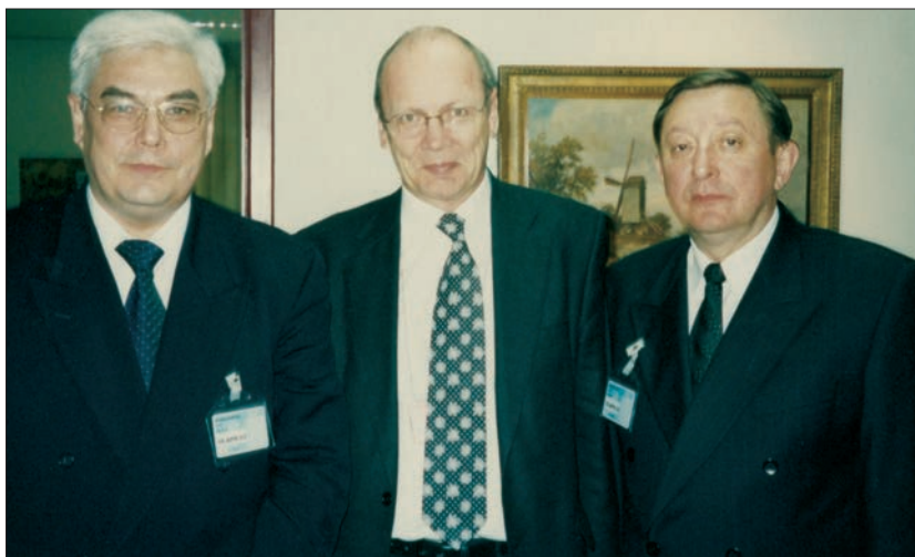
Під час зустрічі зі співголовою Спільної робочої групи «Україна — НАТО» з питань військової реформи високого рівня Едгаром Баклі та заступником Міністра оборони України Віктором Банних (Брюссель, 2005 р.)