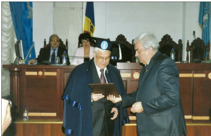
Почесний диплом Doctor Honoris Causa Академії наук Республіки Молдова вручає її Президент академік Георгій Дука (2012)