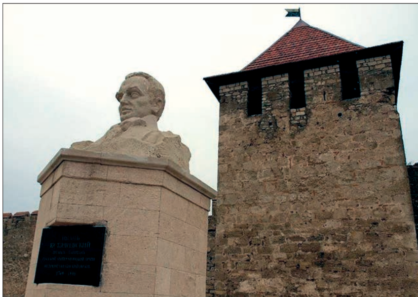
Пам'ятник Івану Котляревському перед мурами Бендерської фортеці (Бендери, Придністров'я, Республіка Молдова)