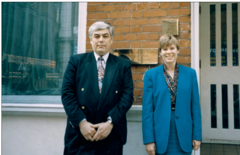
Зустріч із виконавчим директором Міжнародного інституту стратегічних досліджень Роуз Потемюллер (Лондон, Велика Британія, 1999 р.)