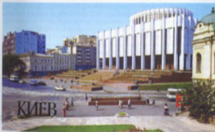
Український дім. Листівка, 1983

На місці перед Українським домом у 1804-1805 роках за проектом архітектора А.І. Меленського було збудовано перший Миський театр. Сучасна Європейська площа тоді мала назву Кінної, Садриба, на території якої постав театр, належала дружині архітектора А.І. Меленського Мар'їні Григорівні, яка мала намір