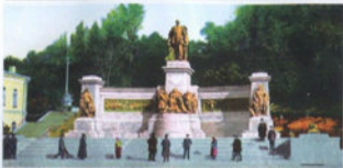
Пам'ятник Олександрові ІІ, 1912

Це був найбільший пам'ятник Олександрові ІІ в Російській імперії. Він складався з трьох п'єдесталів, які були об'єднані широким фронтоном з барельєфами. Увінчувала центральний п'єдестал бронзова фігура імператора на весь зріст в мундирі та мантії, на самому п'єдесталі герб Російської імперії та напис: «Царю-освободителю благодарный Юго-Западный край. 1911 год». З боків п'єдесталів були встановлені скульптурні композиції Милосердя та Правосуддя. Газета «Киевская мысль» відмічала: «С целью украсить место около памятника за ним будут устроены террасы, засаженные деревьями, так что фоном для памятника будет зелень. Ввиду устройства террас вход в Купеческий сад будет перенесен и устроен рядом со зданием Купеческого собрания, где будет поставлена гранитная небольшая лестница» 1 .