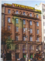
Хрещатик, 8.