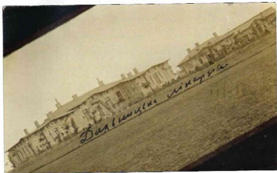
Фото Дальницької лікарні, 1910 р.